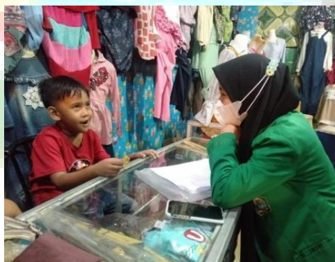
(Foto penliti bersama Fatar, 18 September 2021 di lokasi penelitian)