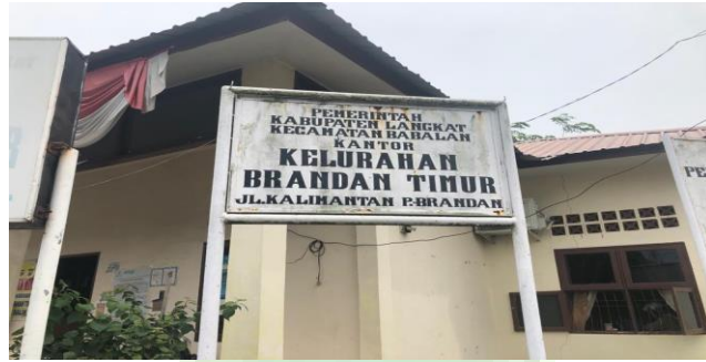
Kantor Kelurahan Brandan Timur, 9 Agustus 2021