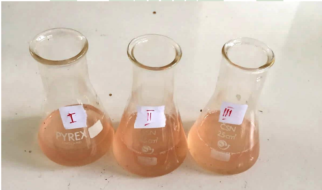
(Sampel Air Nira Buk Ratna)