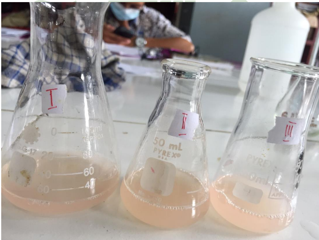
(Sampel Air Nira Pak Usman)