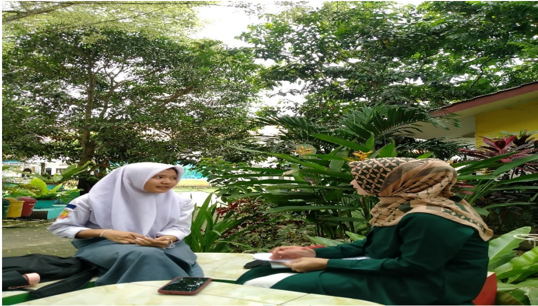
Gambar 5.9 Wawancara Dengan Salah Satu Siswi Kiran Kelas XI Di Taman Diskusi SMA N2