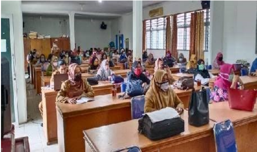
Gambar 5.15 Kegiatan Belajar Mengajar Di Ruang Kelas XI