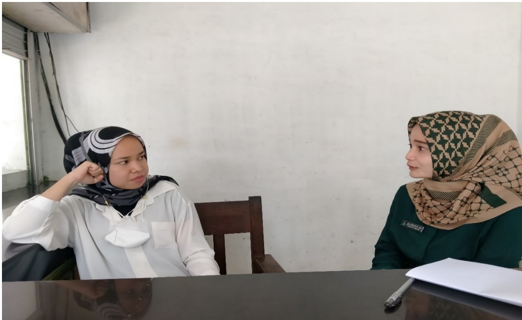
Gambar 5.8 Wawancara Dengan Salah Satu Siswi Kiran Kelas X Di Taman Lingkungan Sekolah