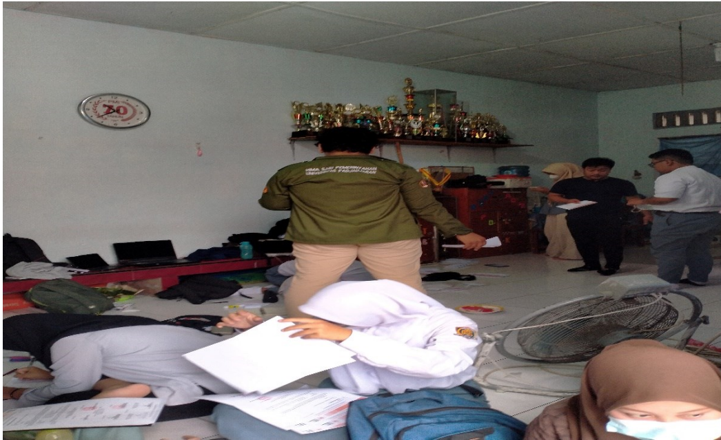
Gambar 5.16 Kegiatan LDK OSIS Di Halaman Sekolah