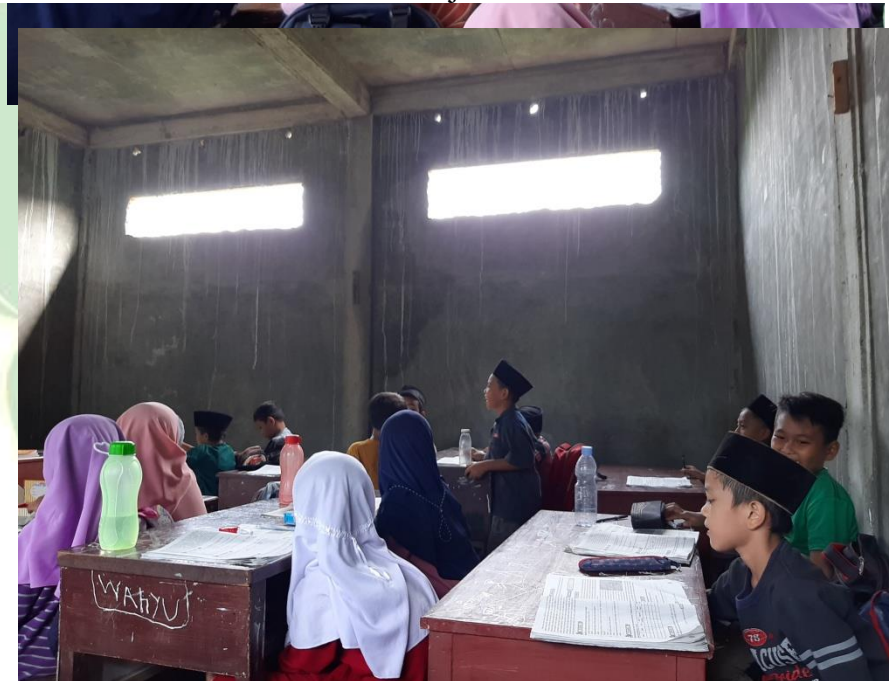
Gambar 2 Pengamatan Proses Pembelajaran