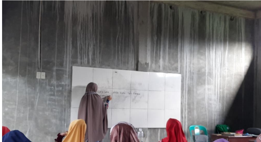
Gambar 1 Proses Pembelajaran di Kelas