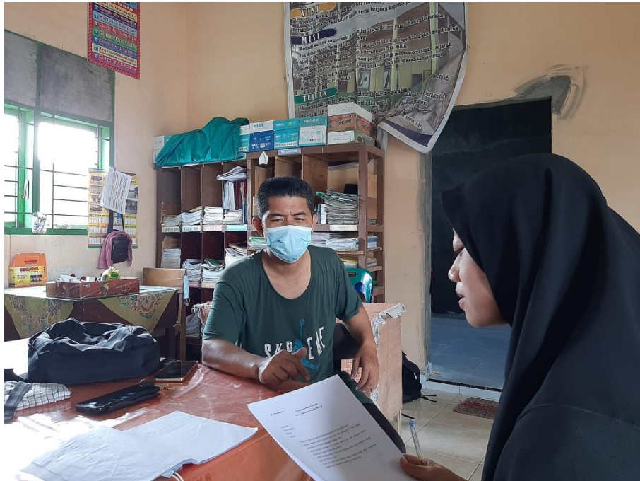
Gambar 5 Wawancara dengan Kepala Sekolah MIS Ar Rahman Tanjung Morawa