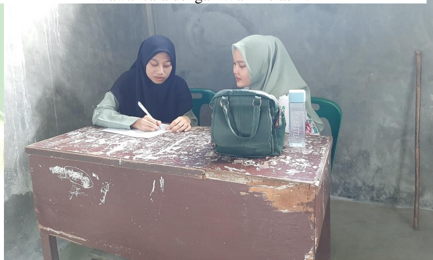
Gambar 4 Wawancara dengan Wali Kelas IV-2