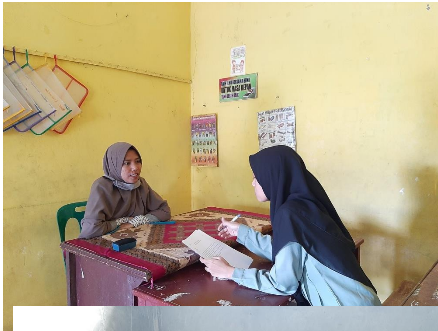
Gambar 3 Wawancara dengan Wali Kelas IV-1