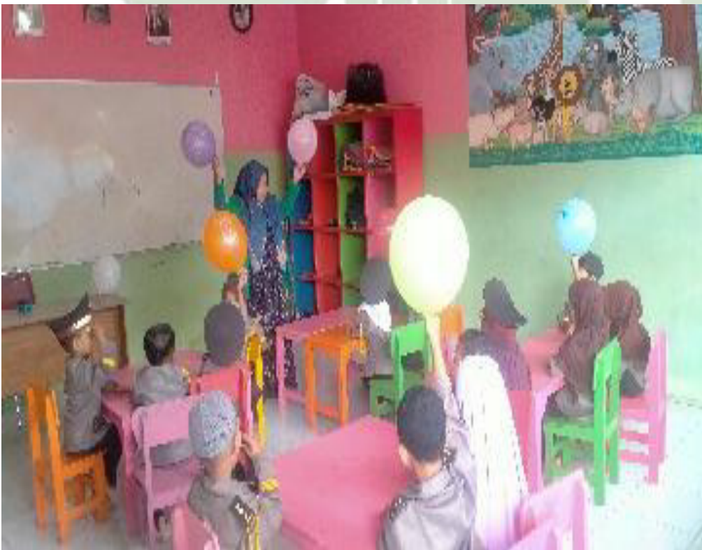
Peneliti merintahkan setiap kelompok mengangkat balon yang telah diberikan masing-masing.