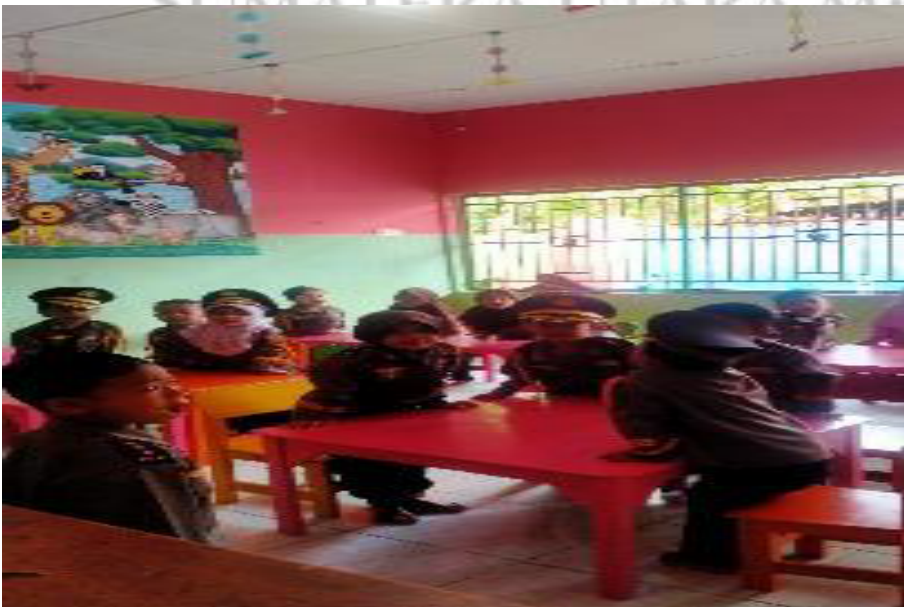
Anak menyiapkan untuk memberi salam kepada guru