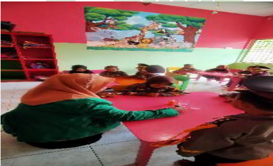
Menuangkan warna kedalam wada yang kosong untuk mendapatkan warna yang baru