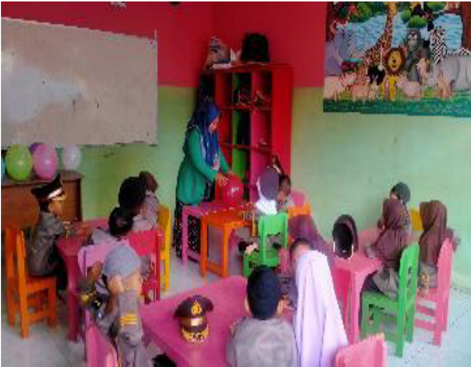
Penelitian membagikan media balon kepada setiap kelompok yang telah ditentukan