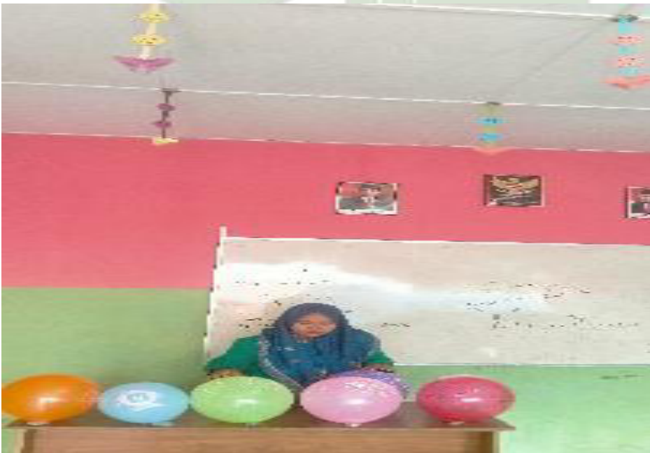
Peneliti mengenalkan macam-macam warna dengan menggunakan media balon