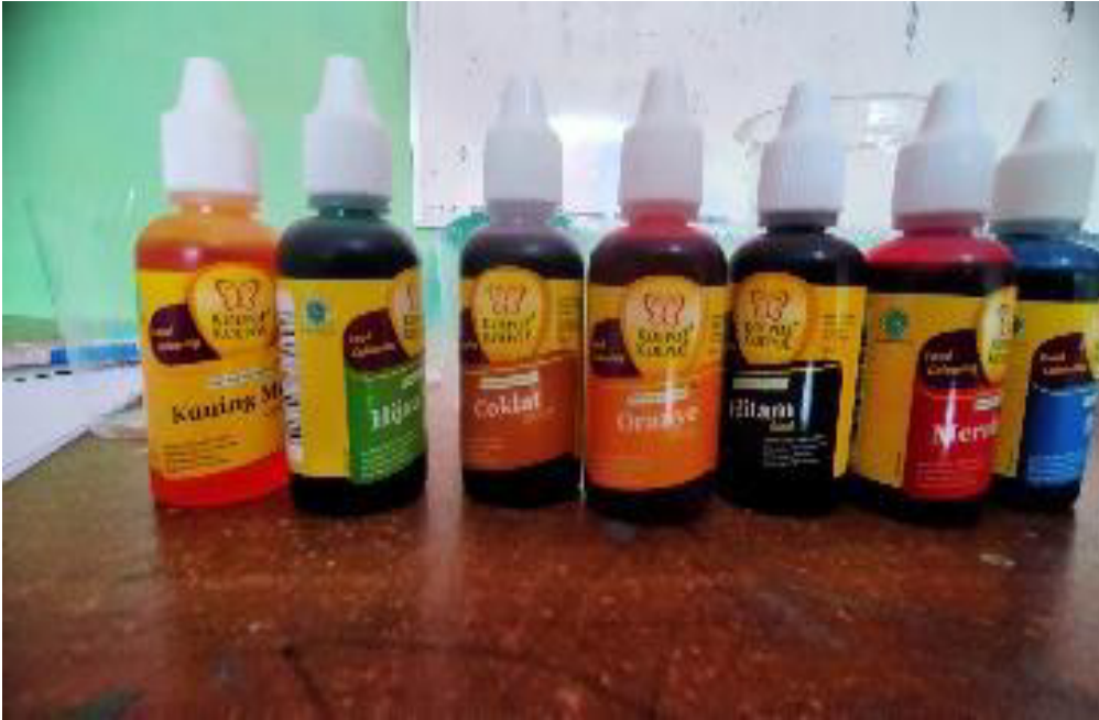
Bahan pewarna makan untuk melakukan eksperimen