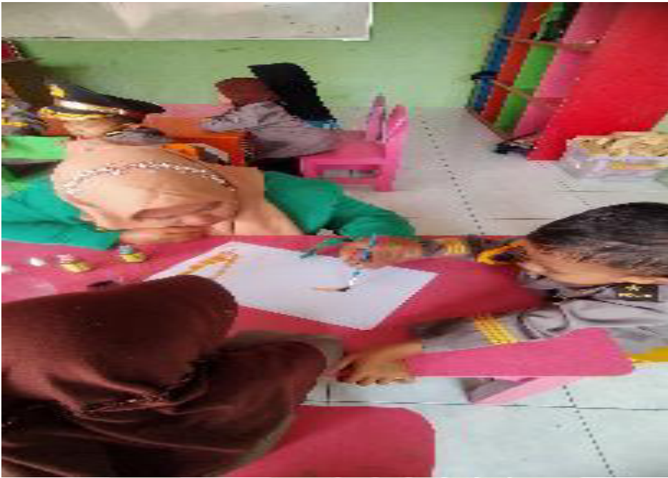
Peneliti memengangkan tangan anak untuk melukis dikertas dengan hasil warna yang dicampurkan