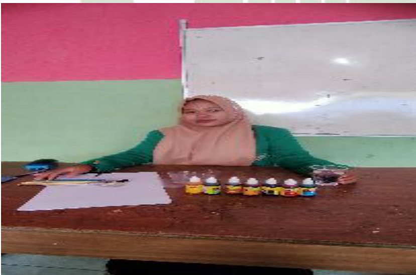
Memperkenalkan Baham-bahan untuk dilakukan metode eksperimen