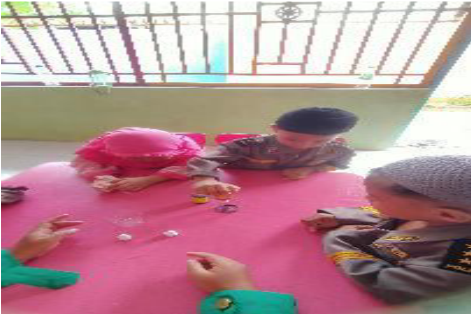
Anak- anak menuangkan pewarna makanan ke wadah yang baru