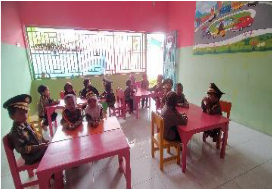
Anak membaca doa sebelum belajar dan membaca surah-surah pendek, beryel-yel dan bernyayi bersama sebelum dilaksanakan pembelajaran