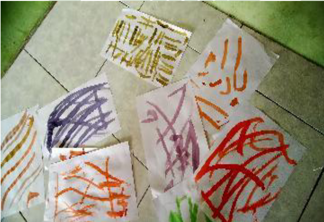
Hasil coretan anak-anak dengan pencampuran warna dan menghasilkan banyak warna