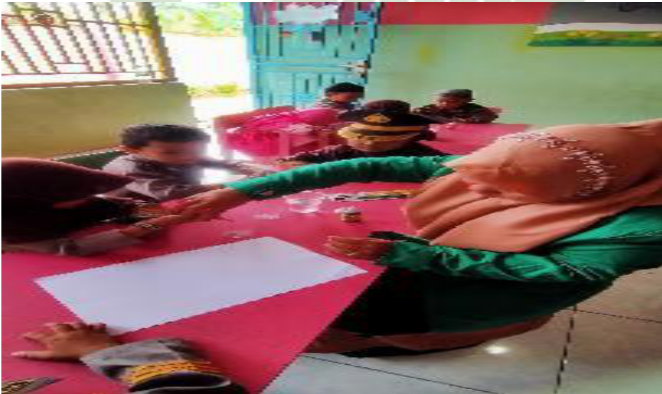
Peneliti mengajarkan anak untuk mengaduk warna yang sudah dicampurkan dan diaduk untuk dilukis dikertas yang telah disediakan.