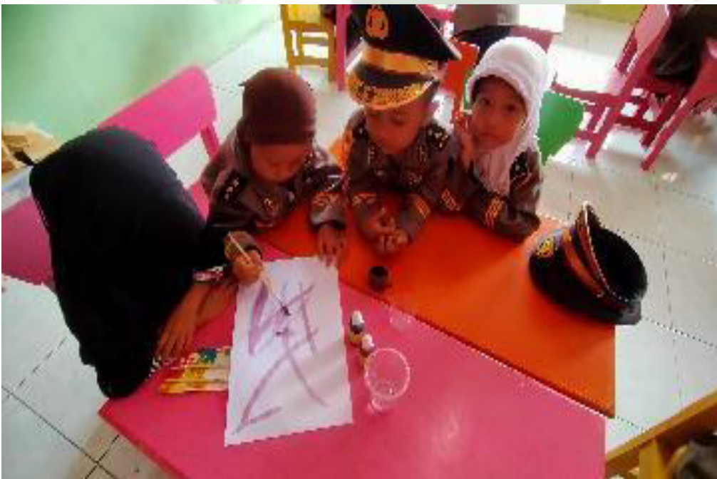
Anak-anak mulai mencoret dengan kuas Lukis secara bergantian