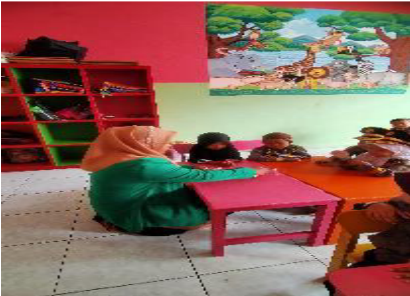
Mencampurkan warna primer dengan warna skunder disetiap kelompok