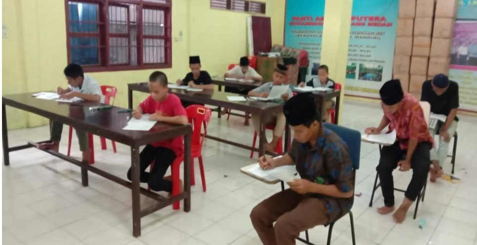
Proses Bimbingan karir di ruang bimbingan