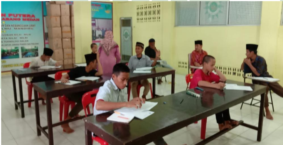
Proses Bimbingan karir di ruang bimbingan