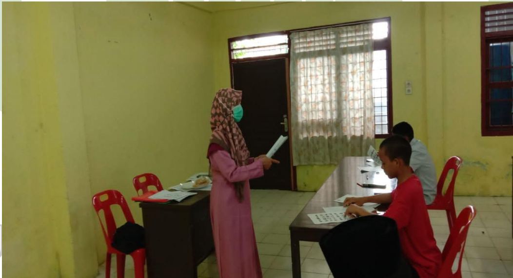
Proses Bimbingan karir di ruang bimbingan