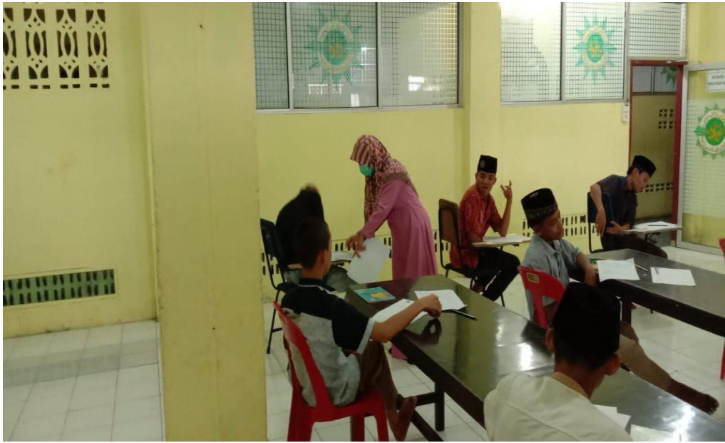
Proses Bimbingan karir di ruang bimbingan