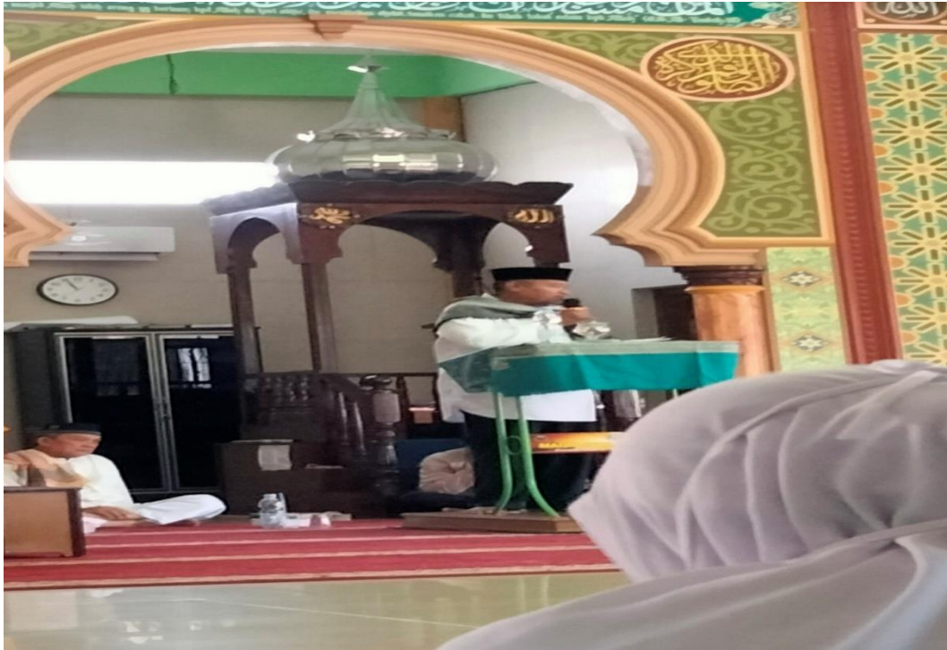
Gambar 3. Pertemuan dan Ceramah di Masjid Sabilul Muttaqin