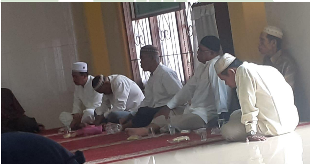
Gambar 4. Pertemuan dan Ceramah di Masjid Sabilul Muttaqin