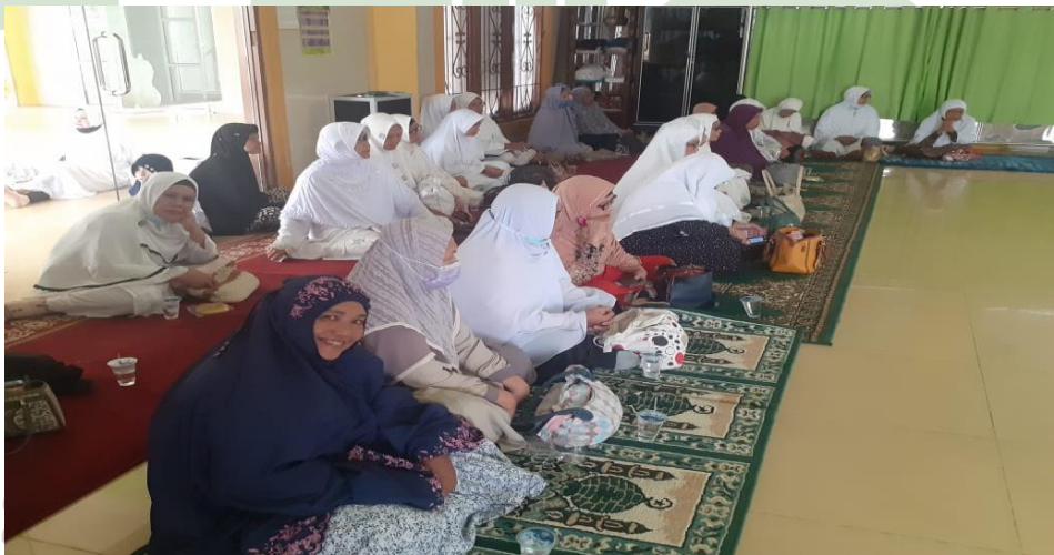
Gambar 2. Pengurus dan Anggota IPHI Kecamatan Babala