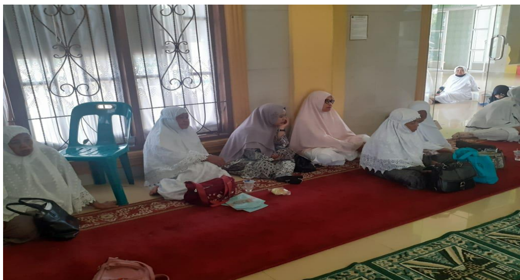
Gambar 5. Pertemuan dan Ceramah di Masjid Sabilul Muttaqin