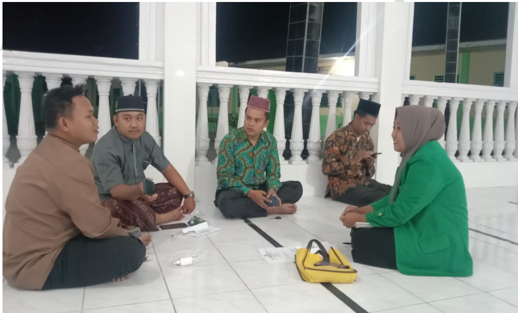
Gambar 1. Melakukan wawancara dengan pengurus dan anggota BKPRMI