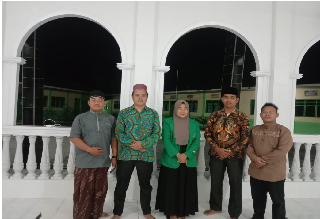
Gambar 4. Foto bersama pengurus BKPRMI