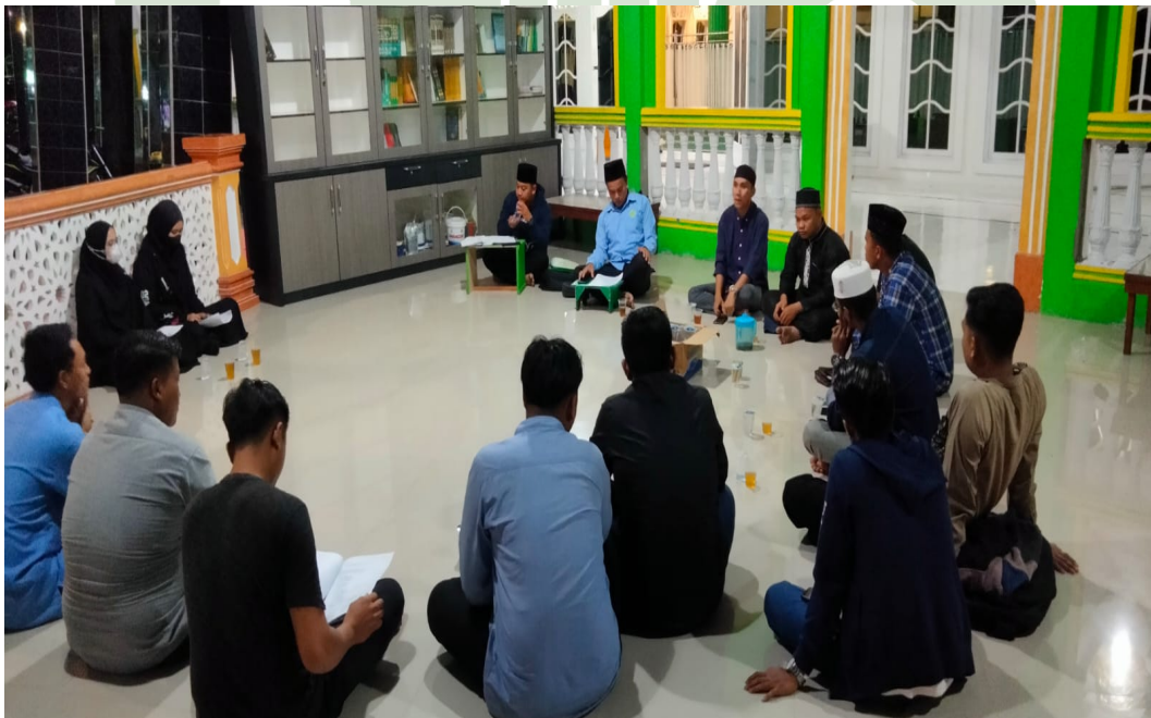
Gambar 3. Rapat bersama pengurus dan anggota BKPRMI