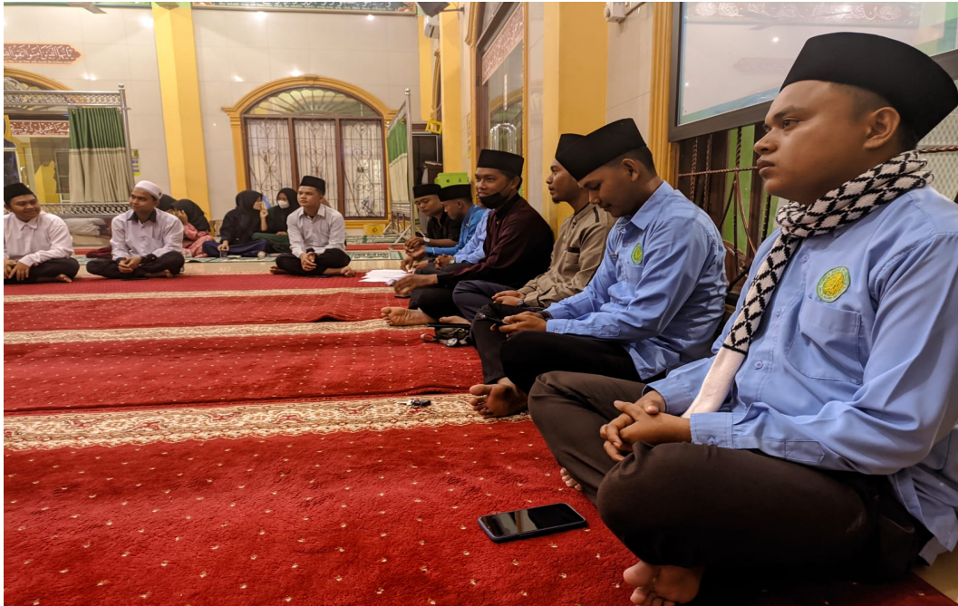
Gambar 2. Kegiatan kajian bulanan BKPRMI