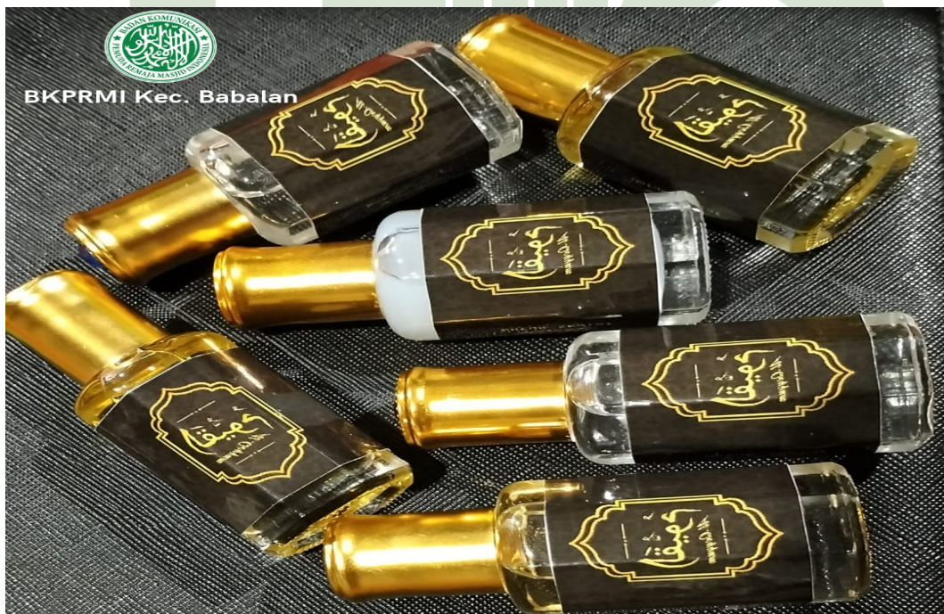
Gambar 5. Produk minyak wangi Al-Qayyum