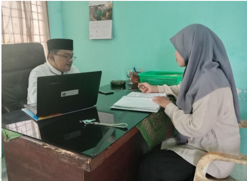
Gambar 3. Wawancara bersama Penghulu KUA Rantau Utara