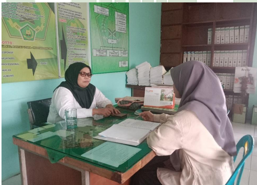
Gambar 4. Wawancara bersama Staf Fungsional Umum