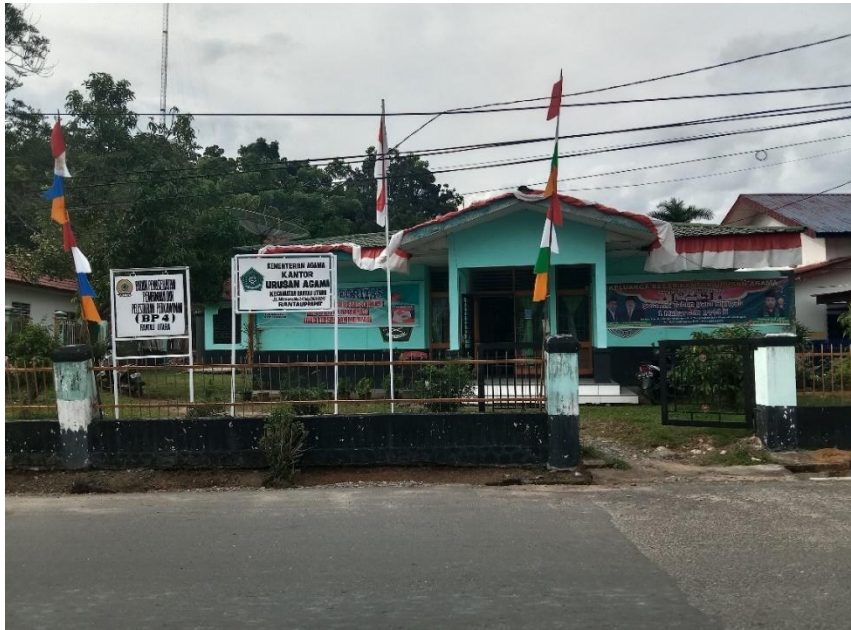
Gambar 1. Tampak depan dari KUA Rantau Utara