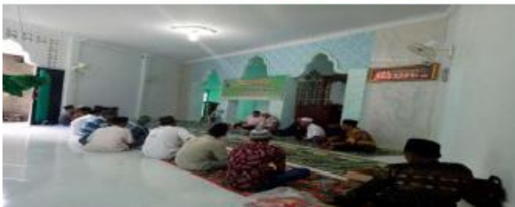
Gambar Pembinaan Keagamaan Mualaf di Kabupaten Langkat