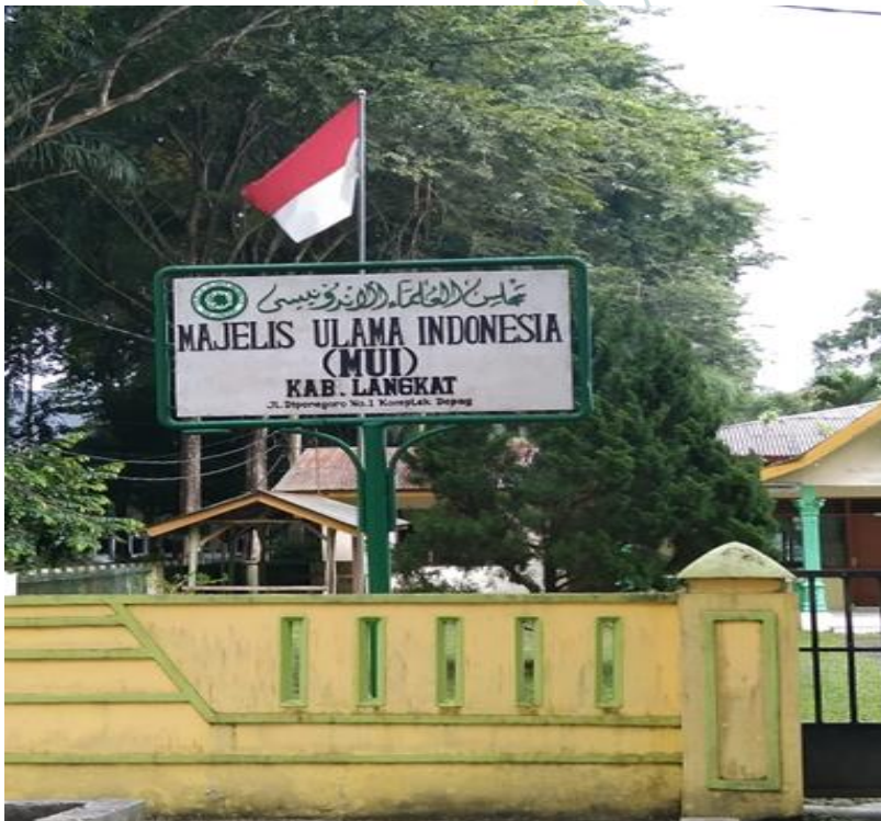
Gambar Kantor Majelis Ulama Indonesia Kabupaten Langkat