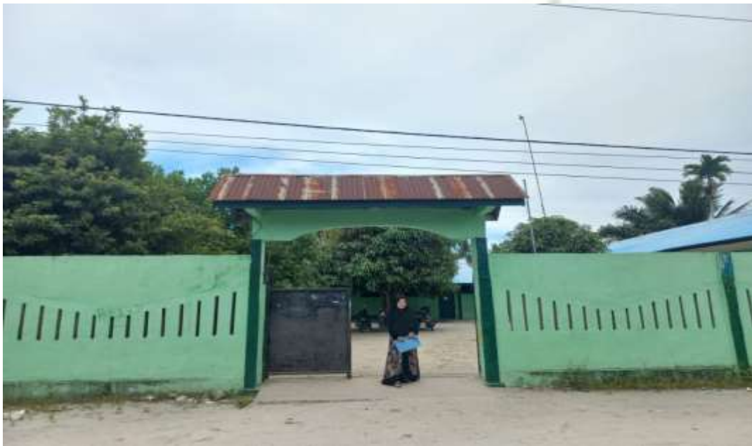
Sekolah Tampak Depan