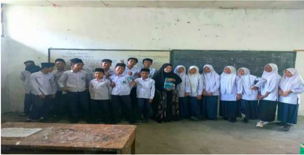
Foto Bersama Siswa