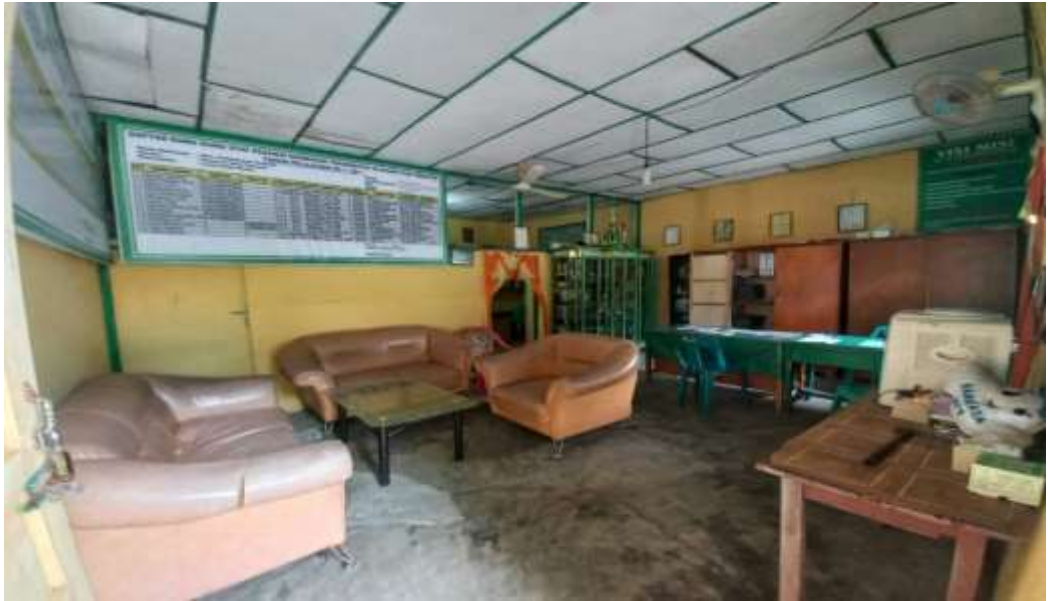
Ruangan Kantor Guru