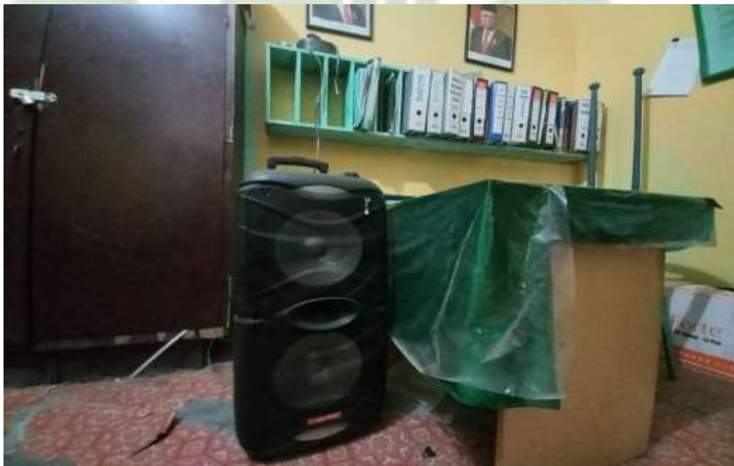
Speaker and Tape Recorder