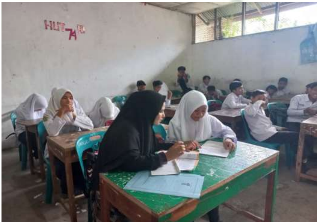
Foto Wawancara Dengan Siswa