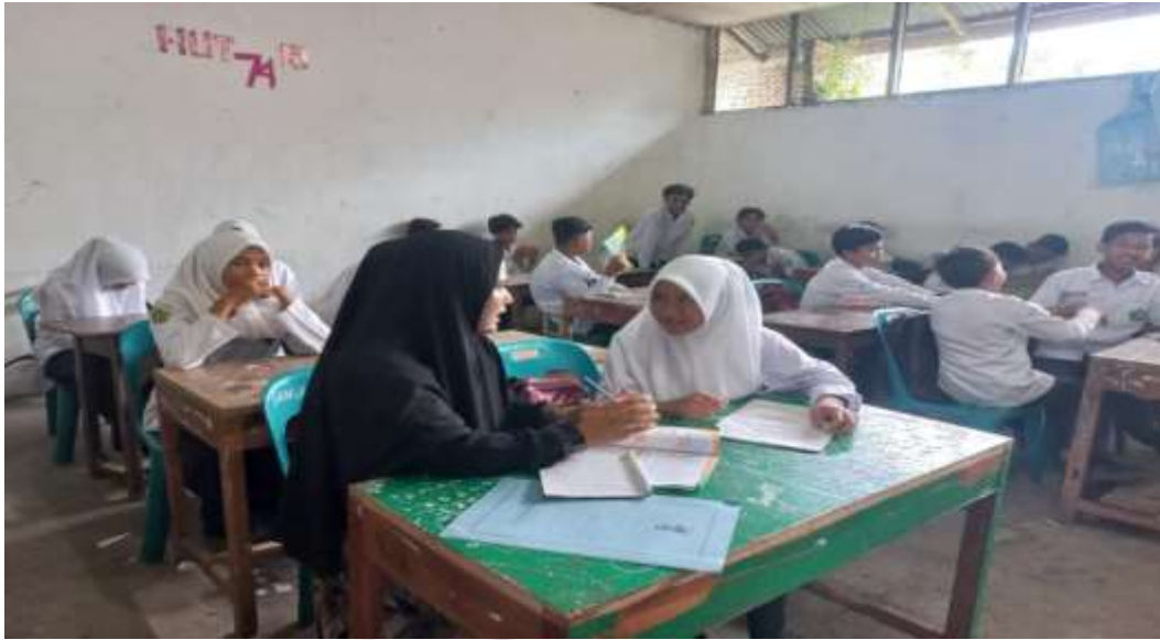
Foto Wawancara Dengan Siswa