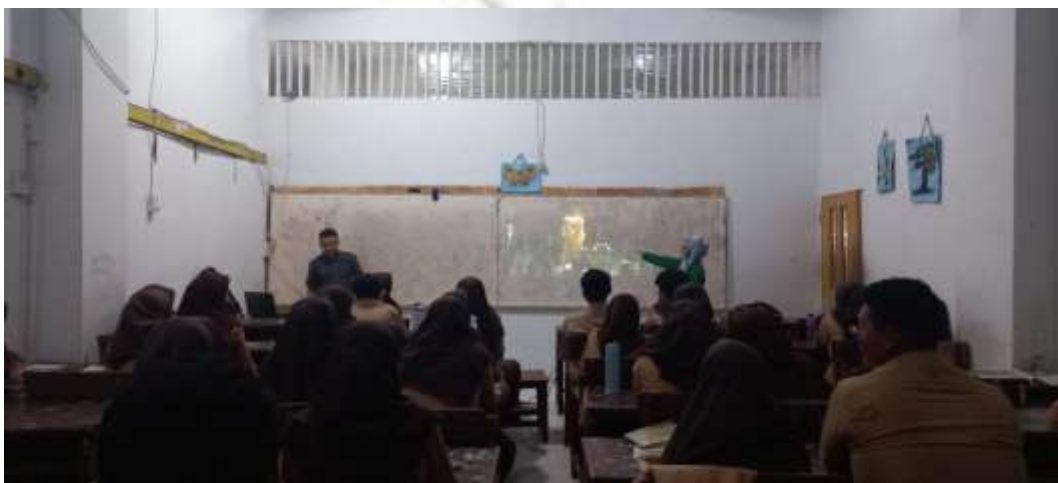
Pembelajaran SKI dengan Media Video dan Gambar