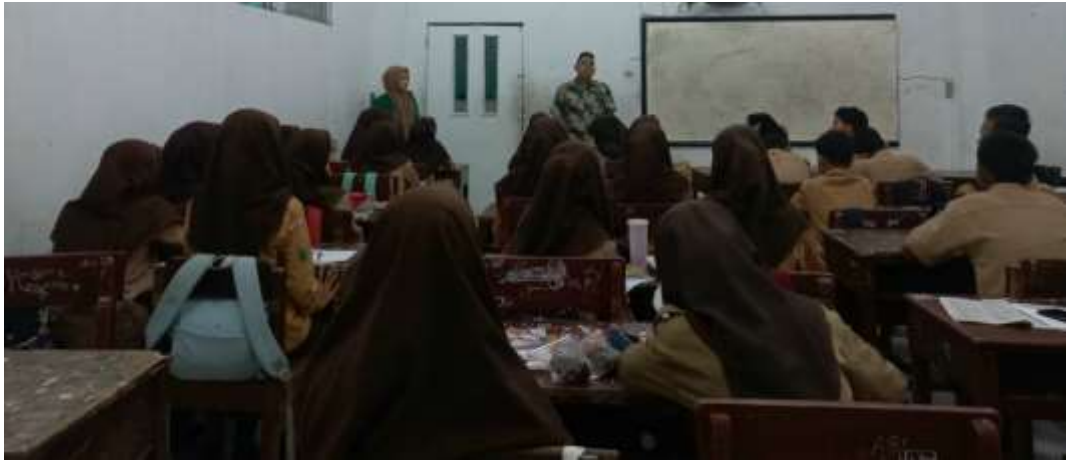
Ada Peneliti dan Guru SKI