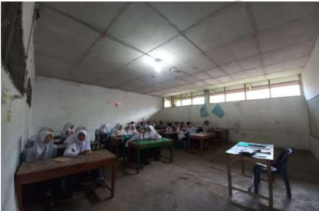
Proses Belajar Siswa