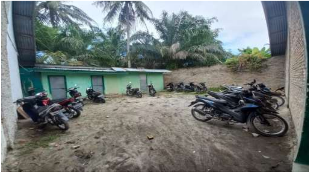
Sekolah Tampak Belakang