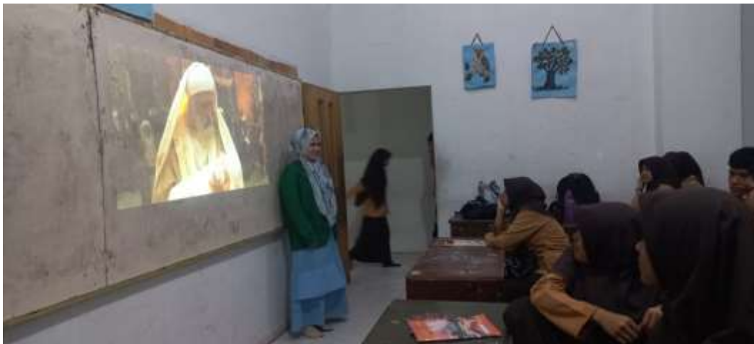
Pembelajaran SKI dengan Media Video dan Gambar