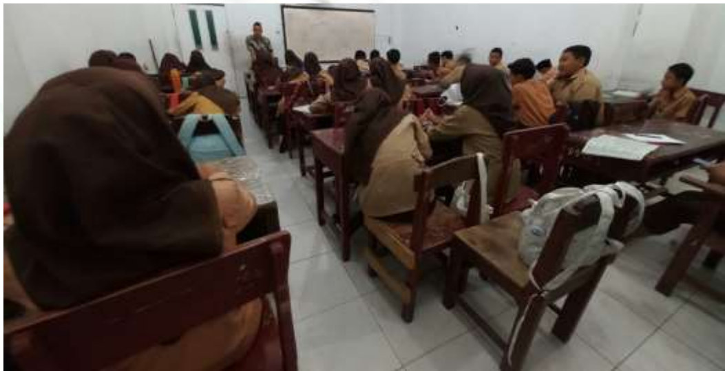
Pembelajaran Di Kelas Kurang Kondusif, Ada siswa yang mengobrol dan siswa yang tidur.