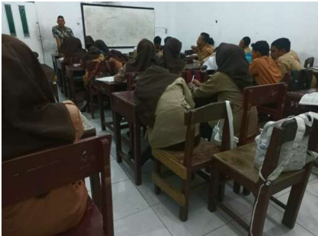
Siswa Tidur Di Kelas dan Tidak Fokus Mengikuti Pembelajaran SKI