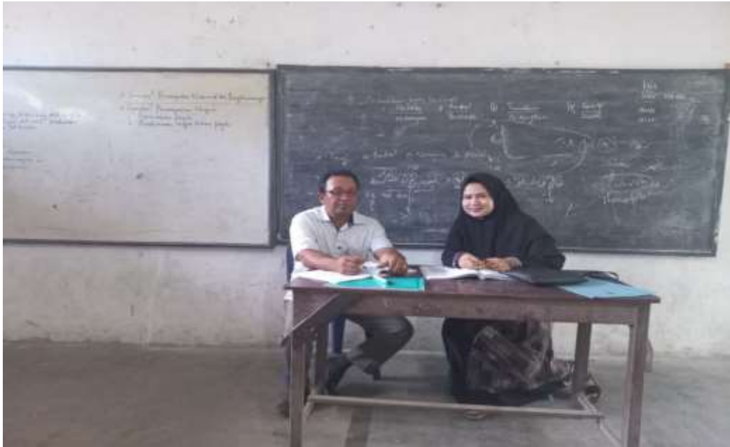
Wawancara Bersama Guru