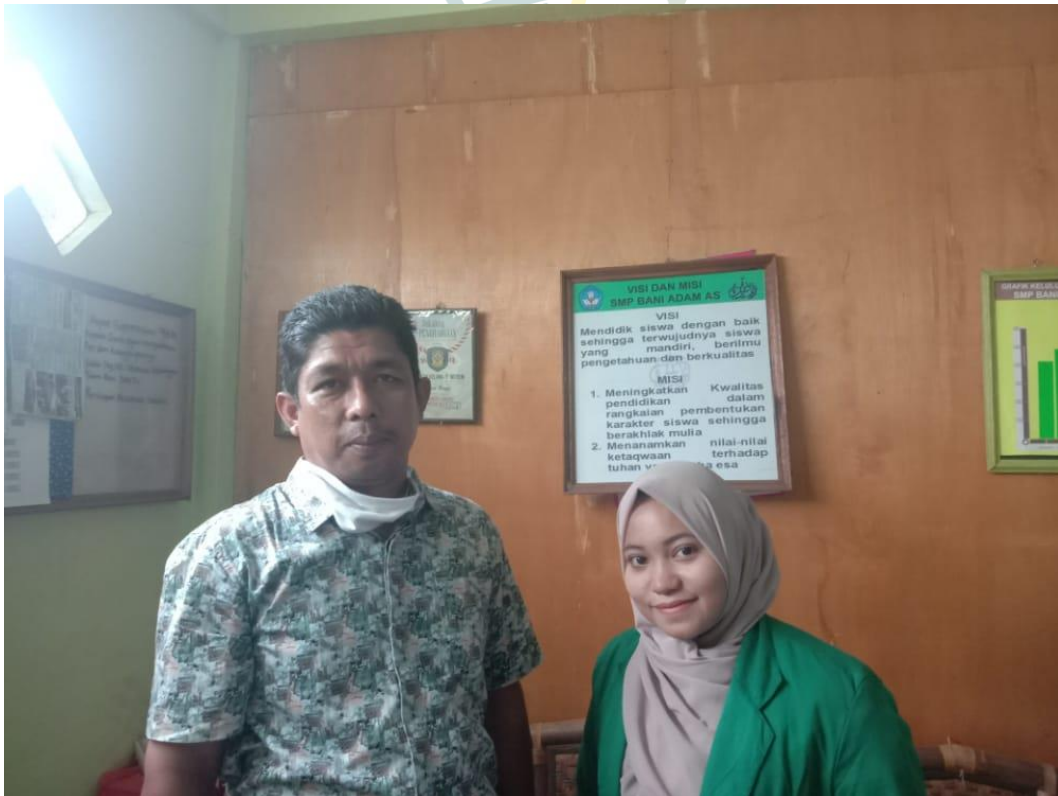
Gambar Wawancara Dengan Bapak Kepala Sekolah SMP Bani Adam