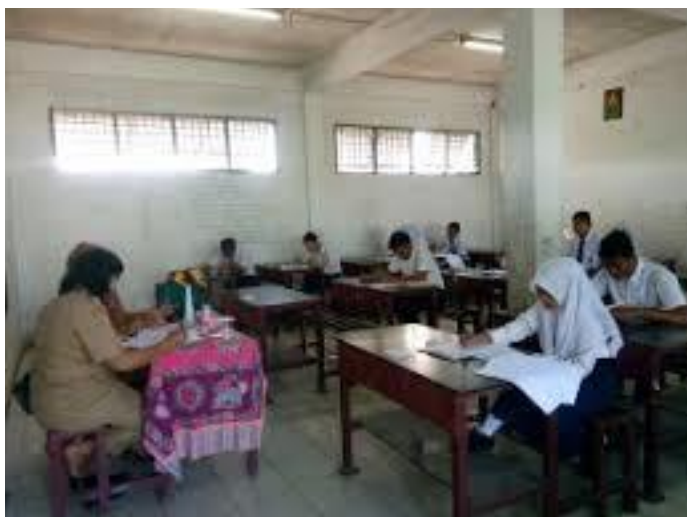
Gambar Suasana Belajar