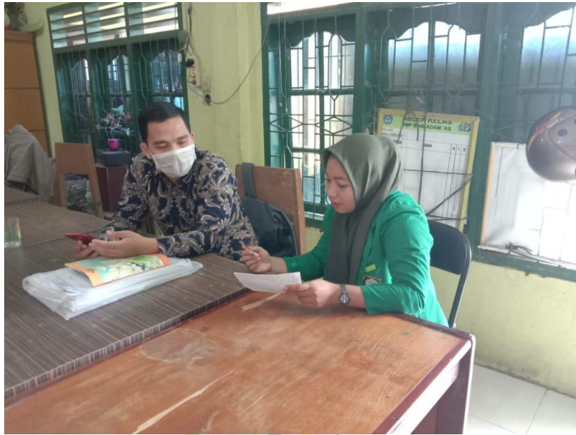
Gambar Wawancara Dengan WKS Kurikulum