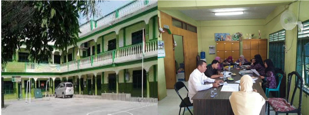
Gambar Depan dan Ruang Guru SMP Bani Adam