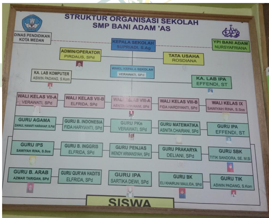
Gambar Struktur Organisasi