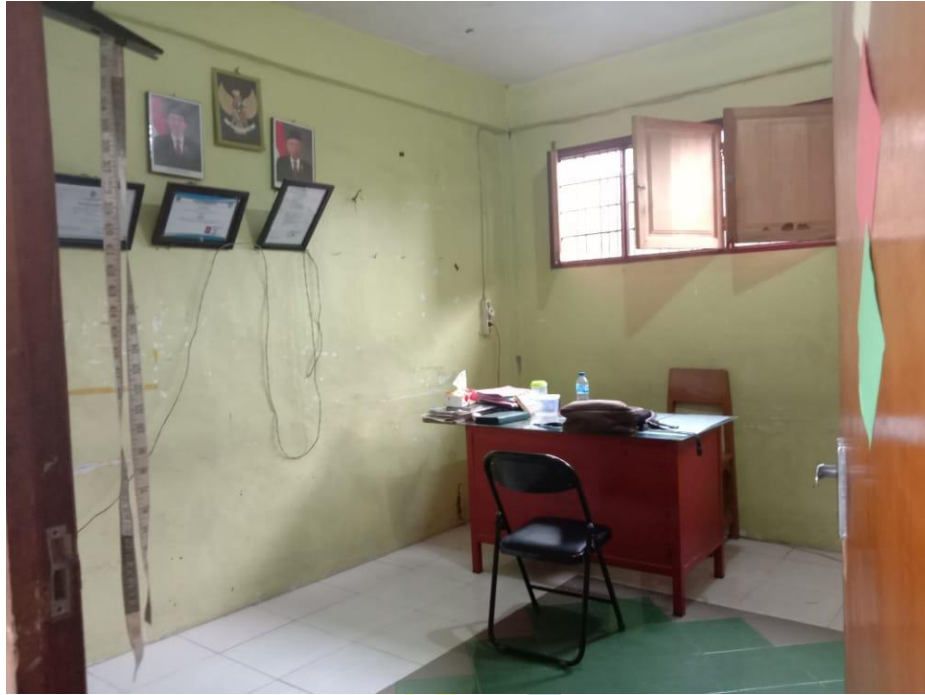
Gambar Ruang Kepala Sekolah