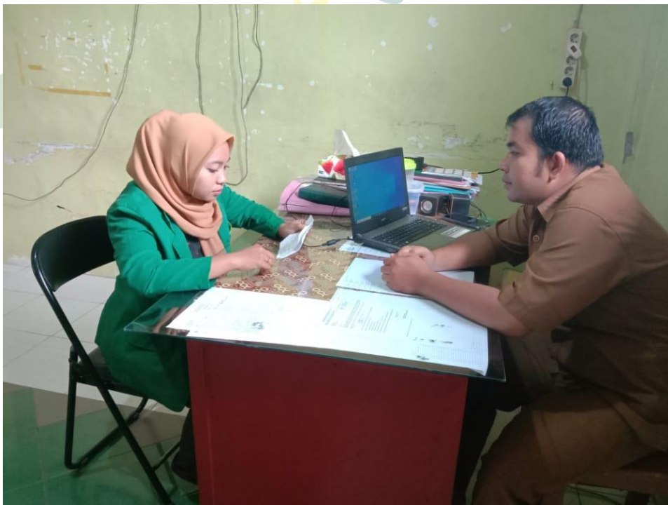
Gambar Pegawai TU