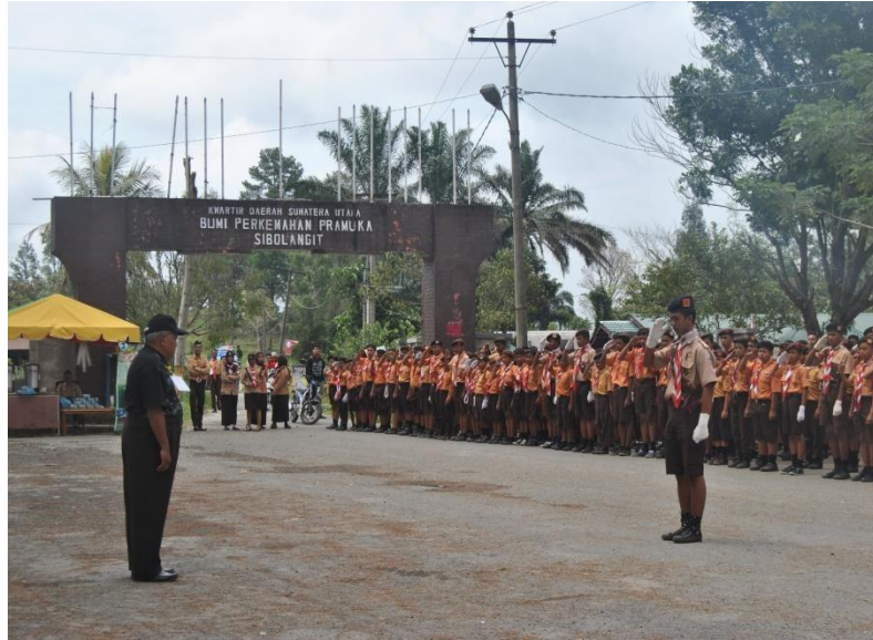
Kegiatan Pramuka SMP Bani Adam