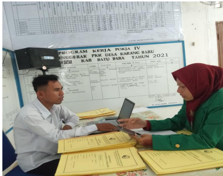
Gambar 1.2 Wawancara dengan perangkat desa yaitu Sekretaris Desa Karang Baru, Kecamatan Datuk Tanah Datar, Kabupaten Batubara.