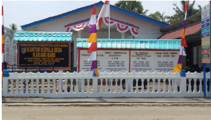
Gambar 1.1 Kantor Kepala Desa Karang Baru, Kecamatan Datuk Tanah Datar, Kabupaten Batubara.