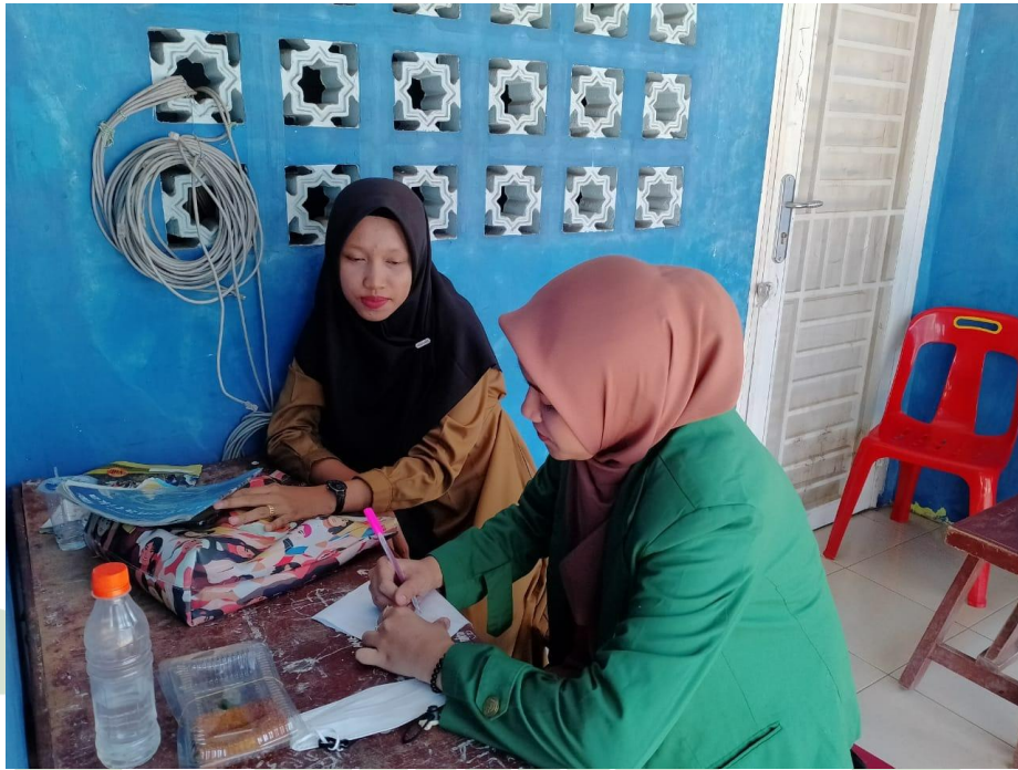
Gambar wawancara dengan Guru IPS Madrasah Tsanawiyah Swasta Hidayatussalam