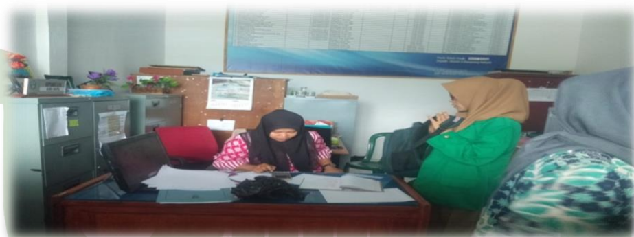
GAMBAR: pengambilan Data Sekolah dengan bagian pengurus tata usaha.