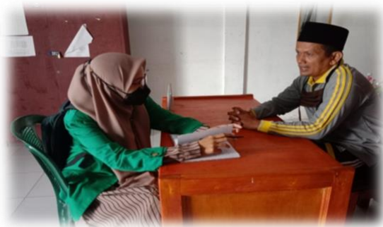
Gambar: wawancara perwakilan guru bidang studi pendidikan agama islam di SMA NEGERI 2.