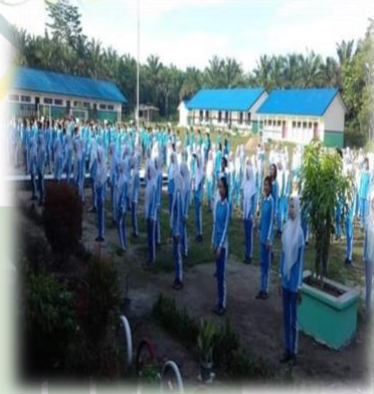
gambar: kegiatan dan belajar di SMA NEGERI 2 KAMPUNG RAKYAT.