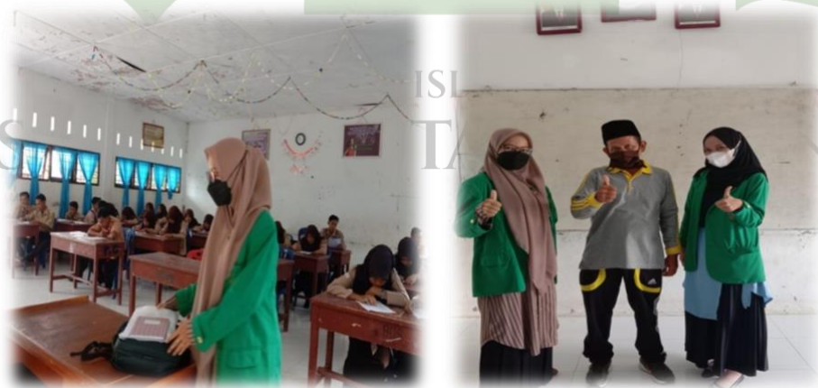
Gambar: wawancara dengan siswa kelas X