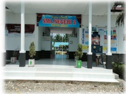
Gambar: lingkungan sekolah dan siswa