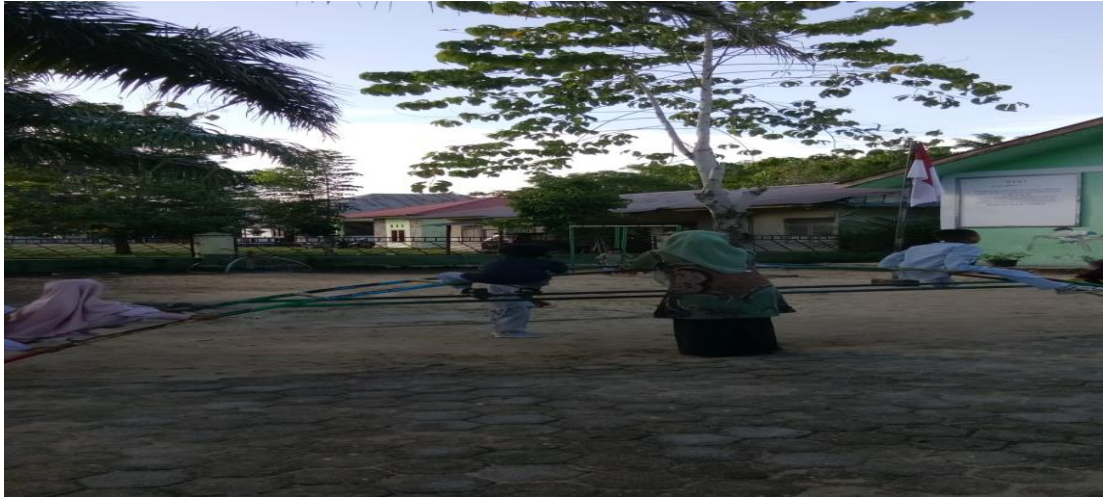
Anak menyapa teman nya