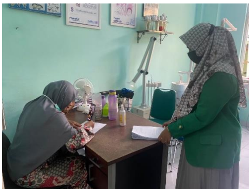
Pengisian Kuisisioner Oleh Drg Yang Berada Di Ruang Poli Gigi