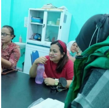
Pengisian Kuisisioner Oleh Ibu Yang Berada di Ruang Pemeriksaan