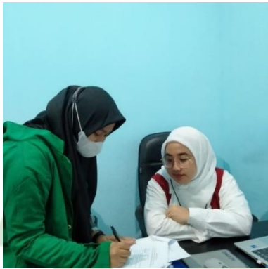
Pengisian Kuisisioner Oleh Ibu Yang Berada di Ruang Tata Usaha