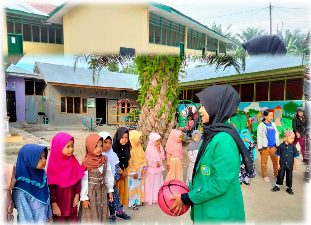
4. Kegiatan Menangkap Bola