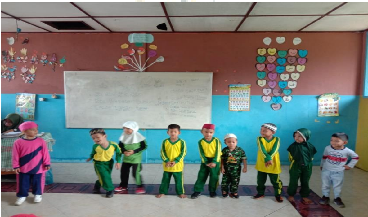
Anak-anak di Dalam Kelas.