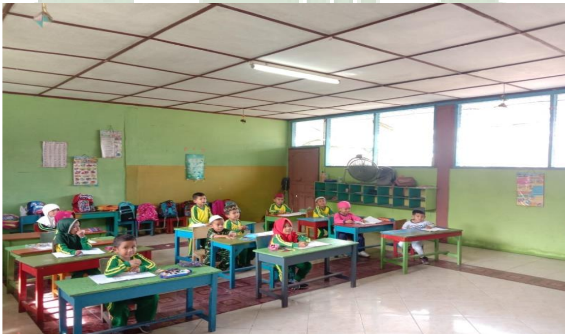
Ruangan Kelas Belajar RA Al-Mukhlisin