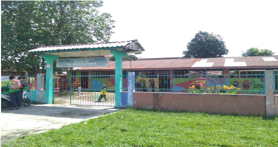
Foto Sekolah RA Al-Mukhlisin.