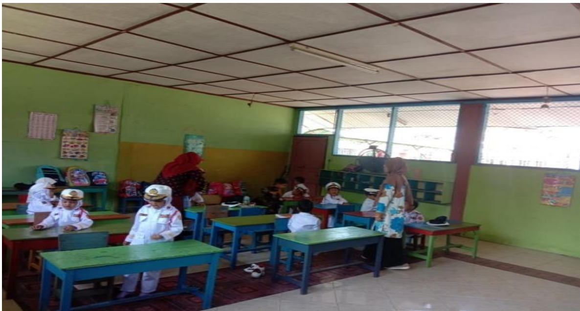
Suasana Guru Mengajar di Kelas RA Al-Mukhlisin