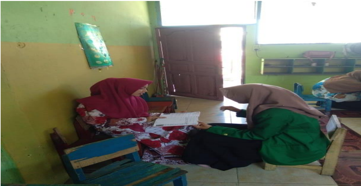
Wawancara Guru RA Al-Mukhlisin