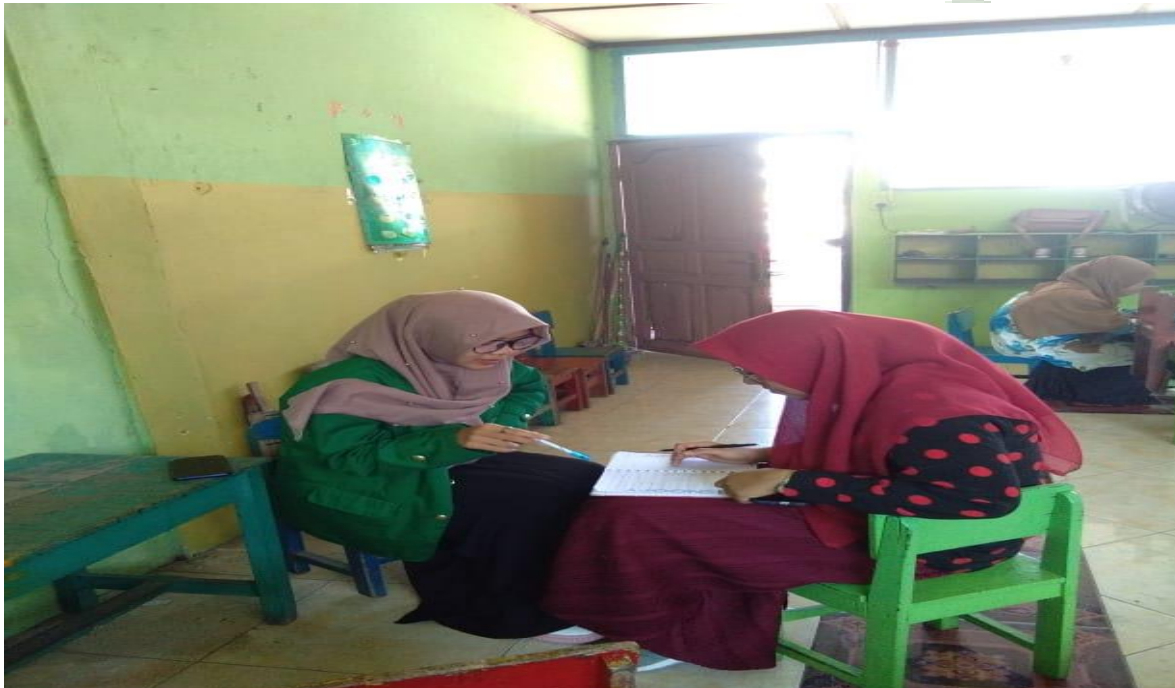
Wawancara Guru RA Al-Mukhlisin