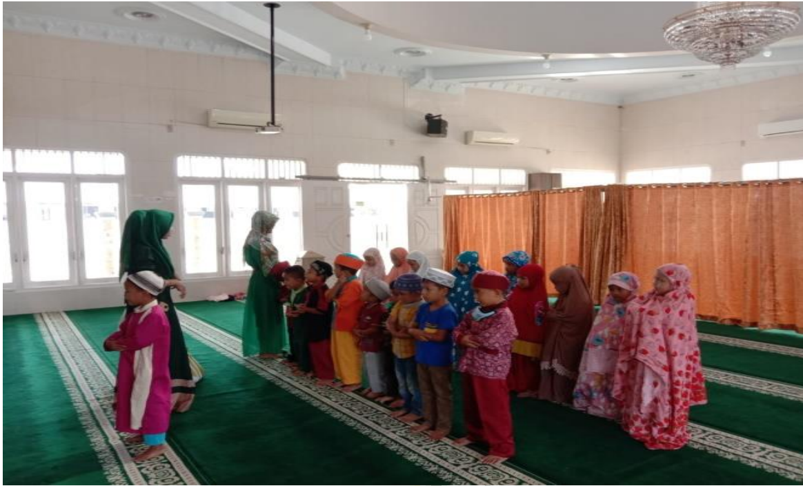
Suasana Anak Ketika Sholat