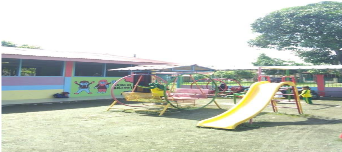
Alat Permainan Outdoor RA Al-Mukhlisin.