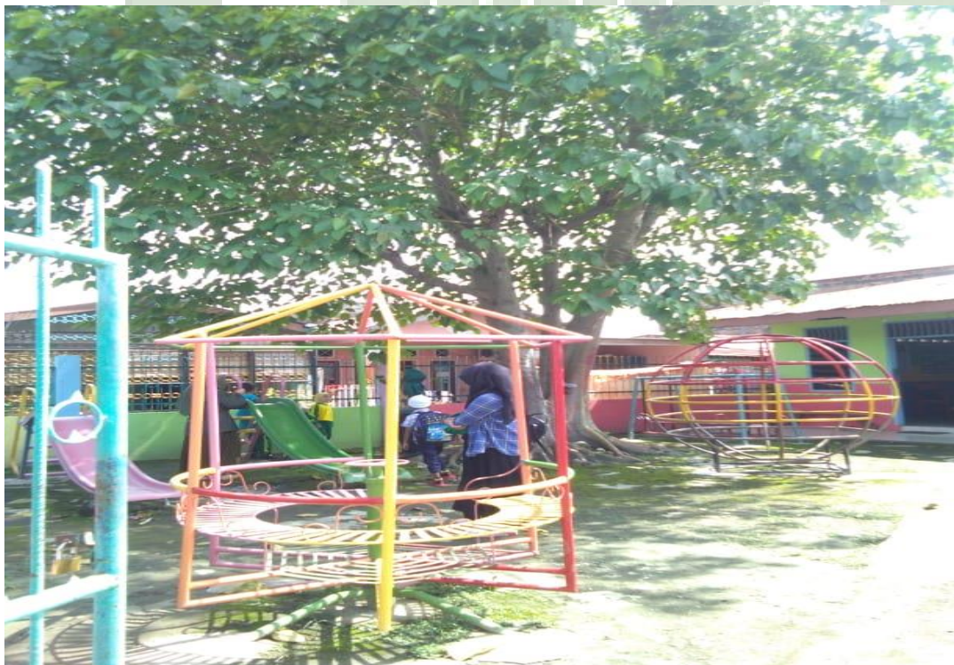
Alat Permainan Outdoor RA Al-Mukhlisin.