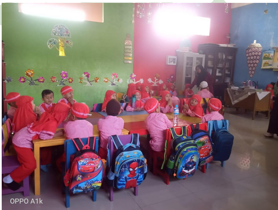
Anak-anak mendengarkan arahan dari guru di dalam kelas (pra siklus)