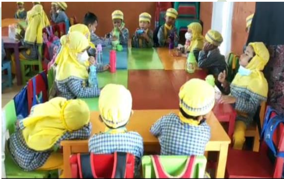
Antusias anak-anak saat guru menceritakan dongeng (Siklus II)