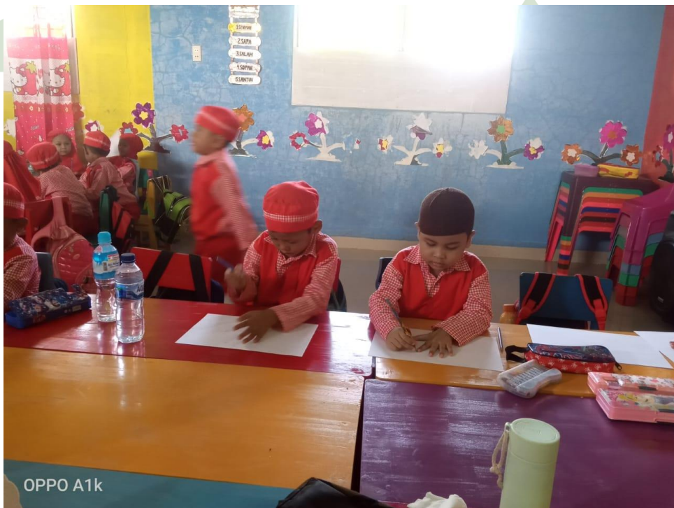
Anak-anak belajar dan di bombing oleh guru (pra siklus)