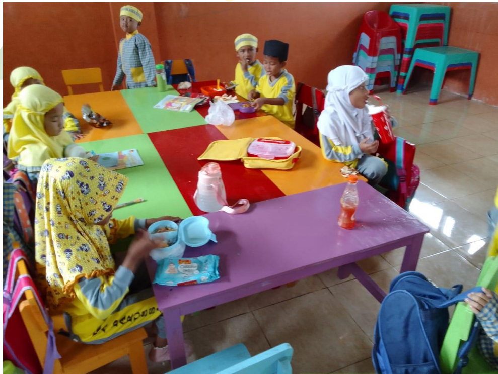
Anak-anak makan bersama di jam istirahat (Siklus II)