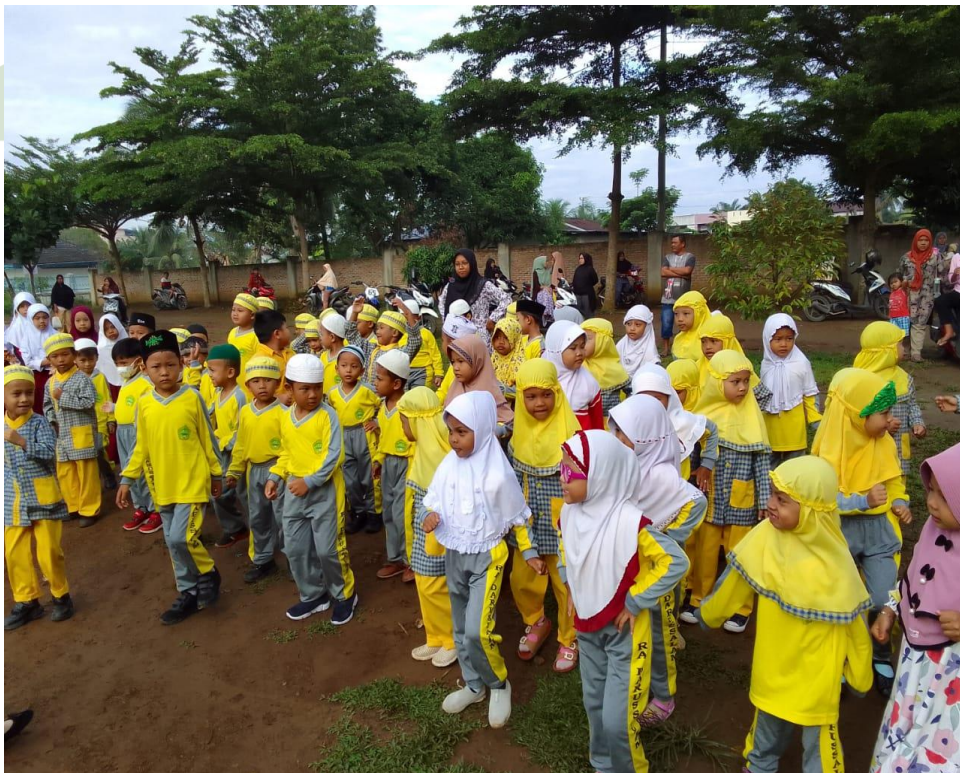
Anak-anak baris berbaris sebelum masuk kelas (Siklus II)