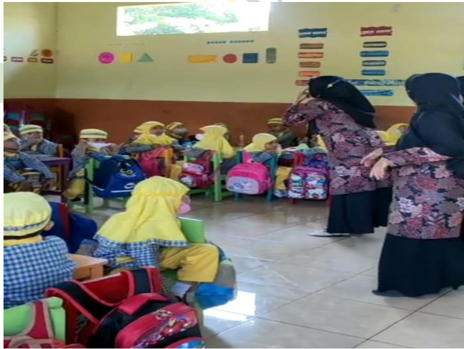
Proses belajar dengan metode bercerita (Siklus II)