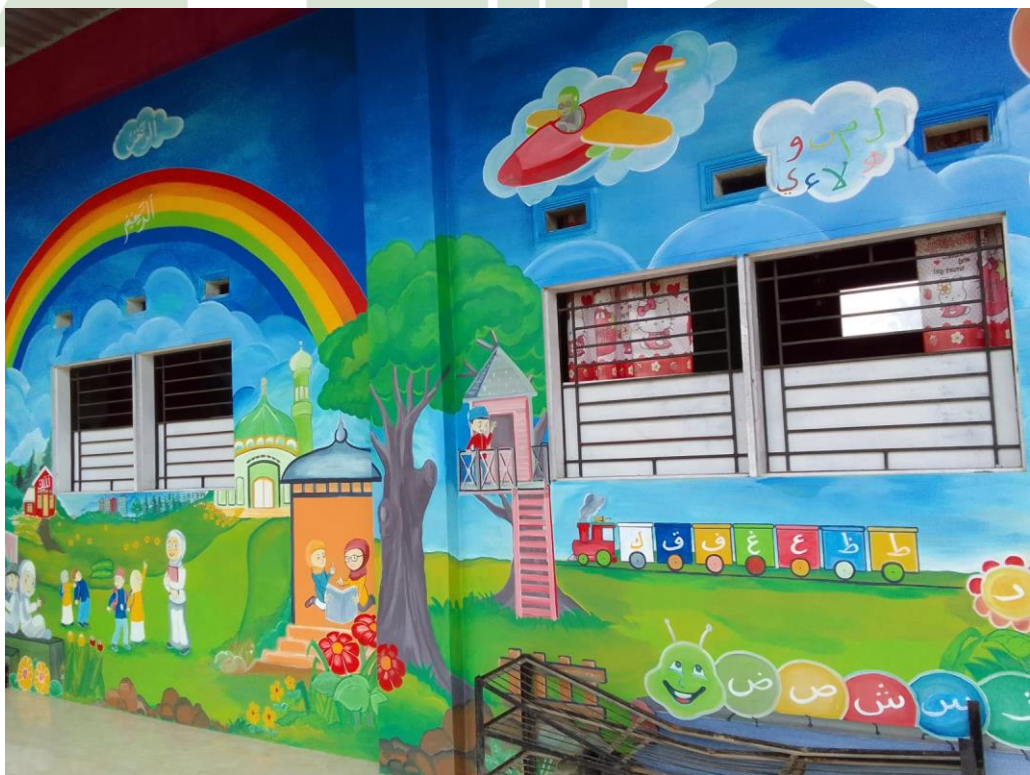
Keadaan Gedung RA Darussalam (Pra Siklus)