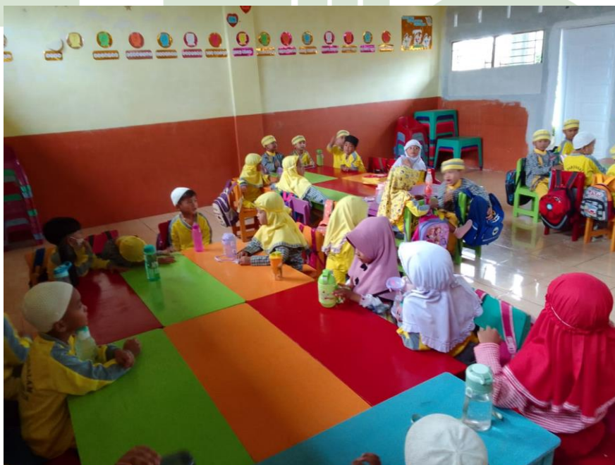
Guru menceritakan dongeng berjudul asal usul burung cendrawasih