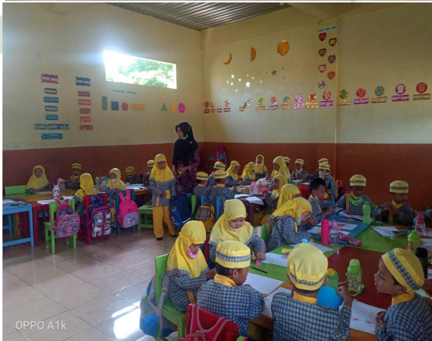
Baris berbaris dan proses belajar (Siklus)