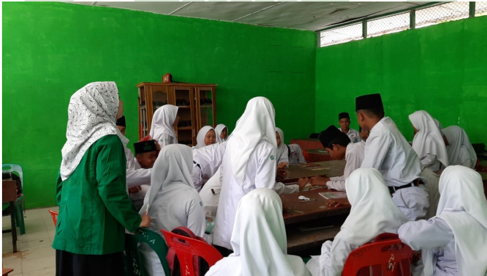
يعمل الطلاب في مهام باستخدام سكرابيل