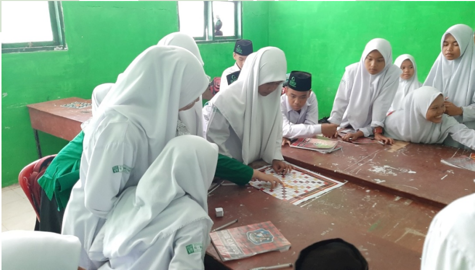
يعمل الطلاب في مهام باستخدام سكرابل