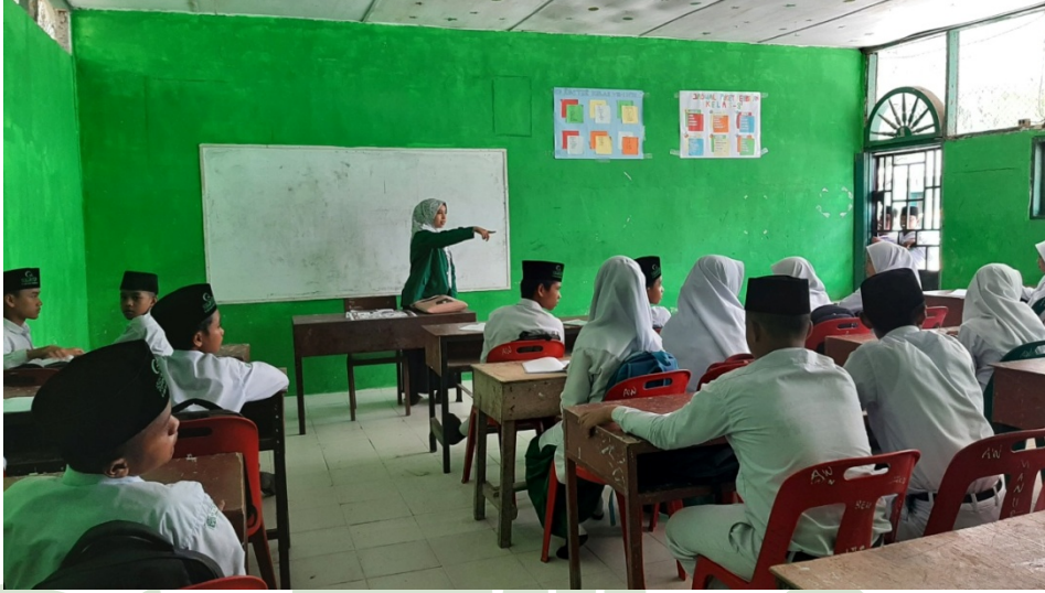
تشرح الباحثة للطلاب