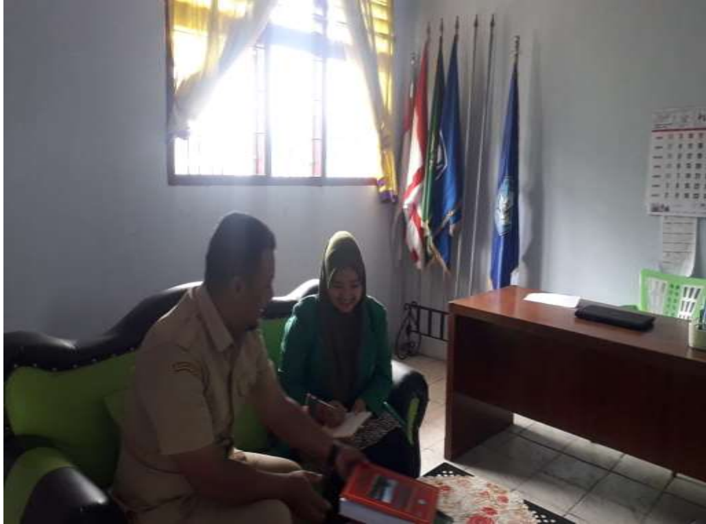
Photo Beserta Wawancara Kepada Siswa UNIVERSITAS ISLAM NEGERI SUMATERA UTARA MEDAN