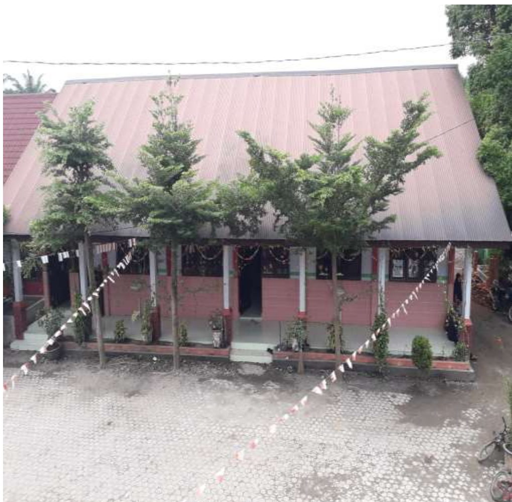
UNIVERSITAS ISLAM NEGERI Ruang Kepala Sekolah SUMATERA UTARA MEDAN