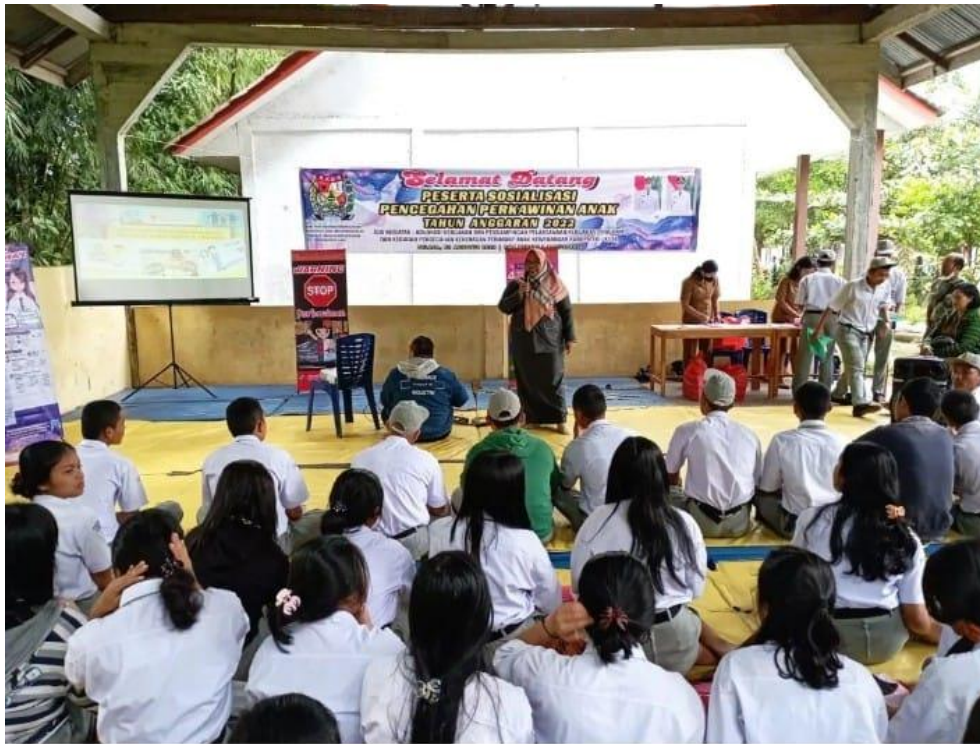
Upaya Pencegahan Pernikahan dini dengan regulasi dan MoU