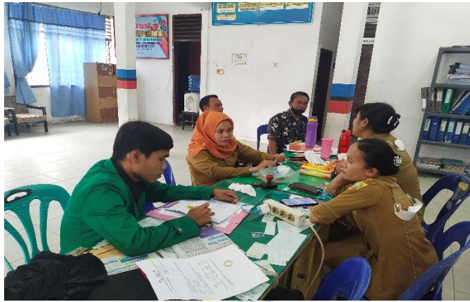
Pengambilan Data Di Kantor Lurah Kota Pinang