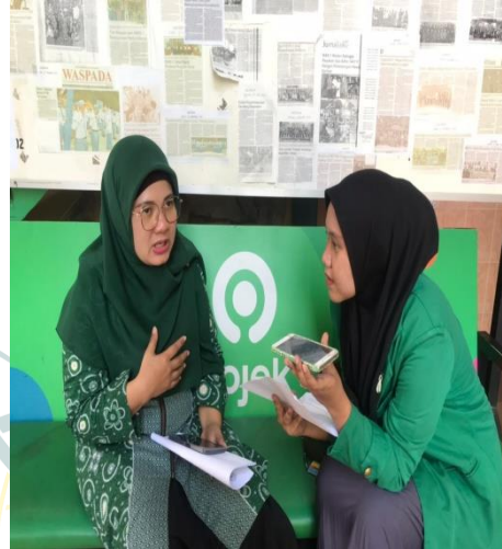
Interview with Teacher