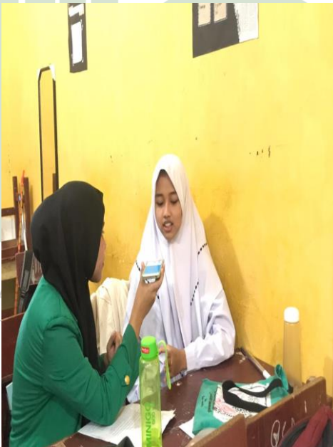
Interview with Student