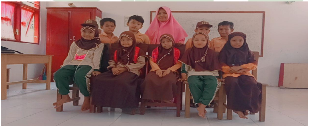
siswa kelas IV SD N 0111 Hasahatan