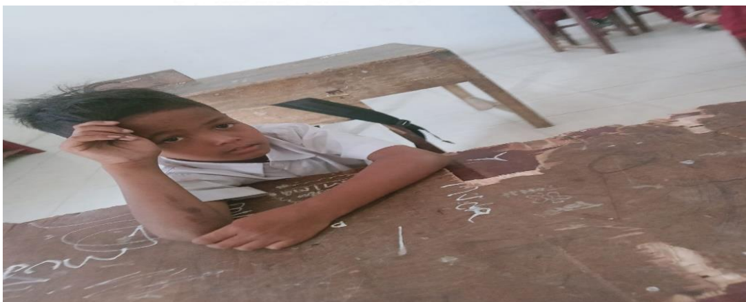
Siswa yang di Wawancarai