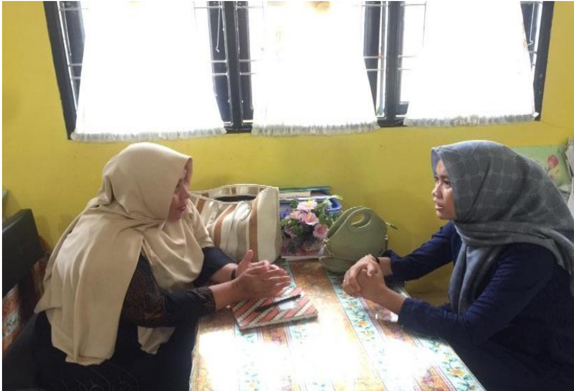
Wawancara Bersama Guru BK