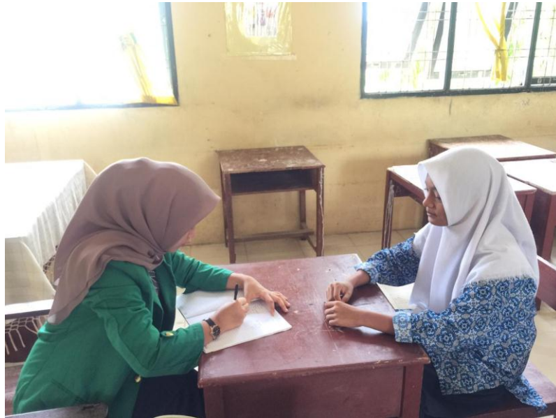
Wawancara Bersama Siswi