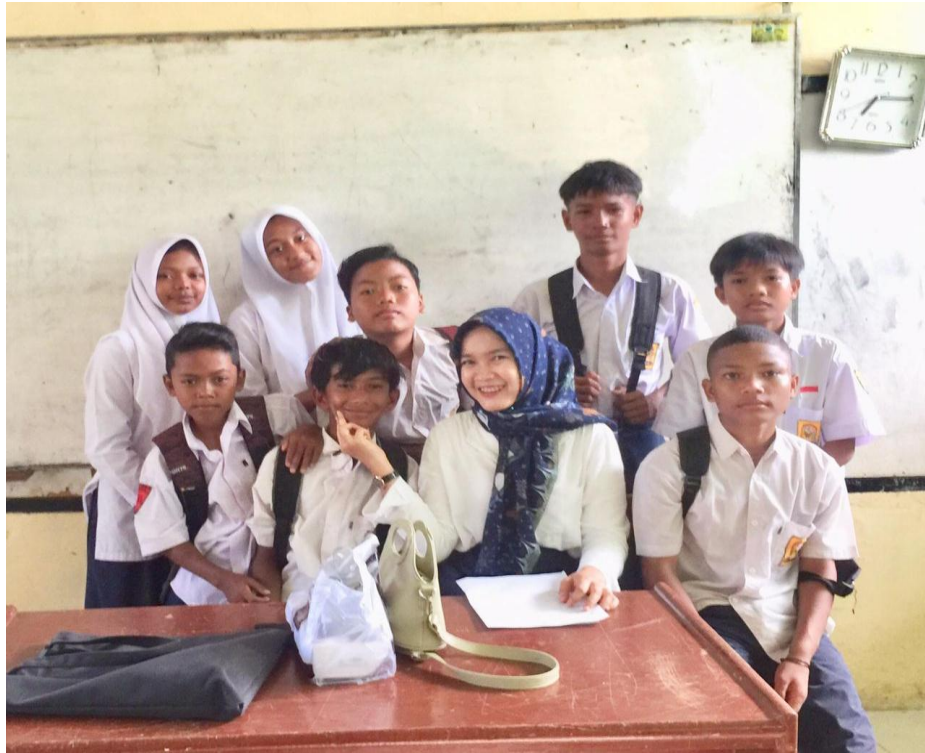
Dokumentasi Bersama Siswa-Siswi