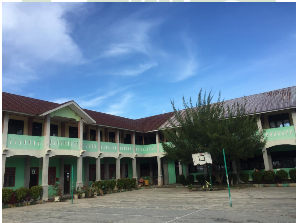
Tampak Depan Sekolah