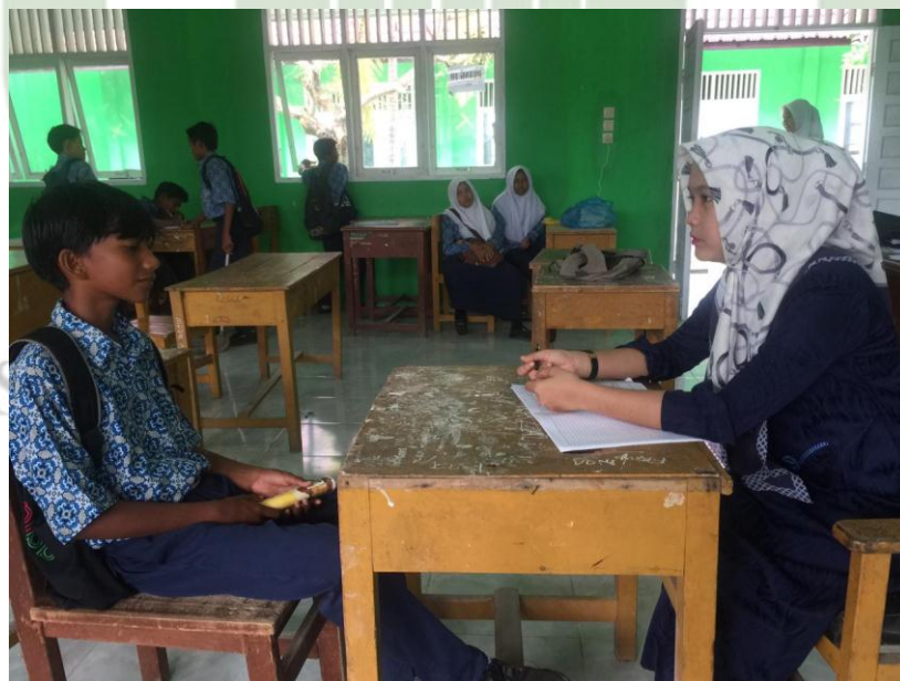
Wawancara Bersama Siswa