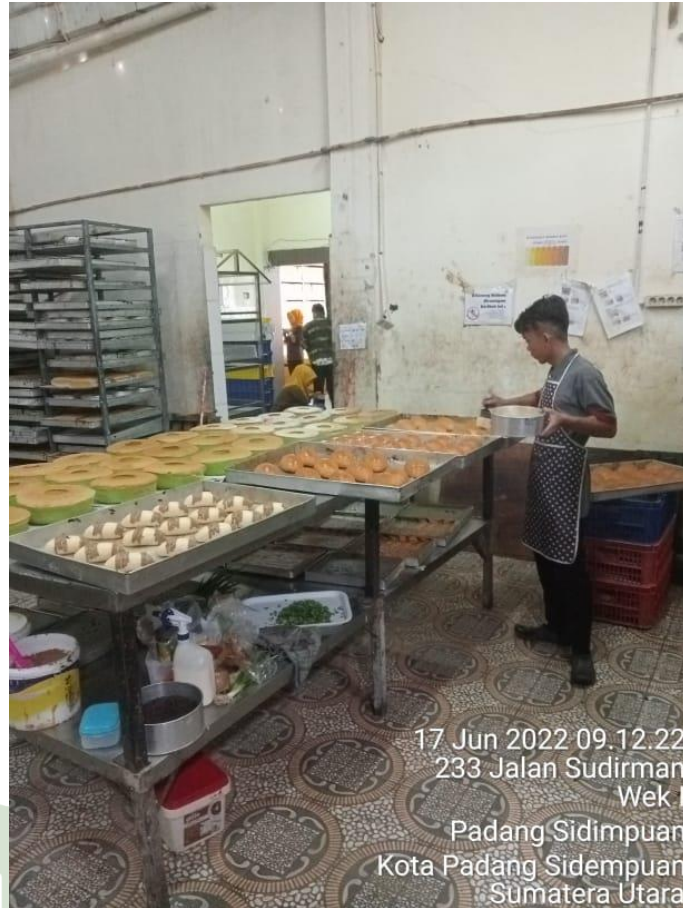
17 Jun 2022 09.12.22 233 Jalan Sudirman Wek I Padang Sidempuan Kota Padang Sidempuan Sumatera Utara