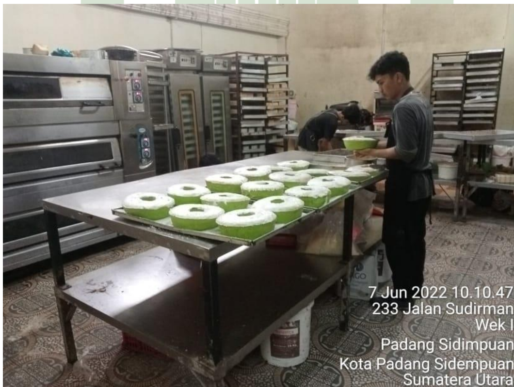
7 Jun 2022 10.10.47 233 Jalan Sudirman Wek I Padang Sidempuan Kota Padang Sidempuan Sumatera Utara