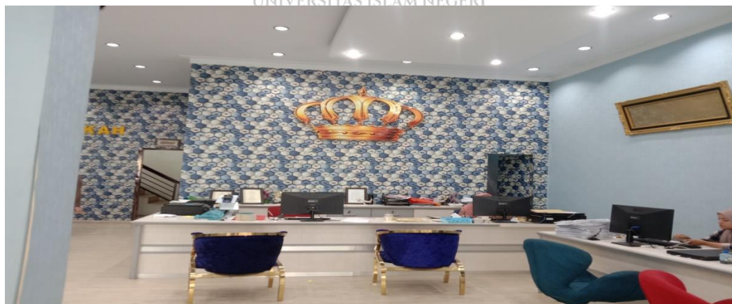
Potret Kantor PT. Ameera Mekkah Travel