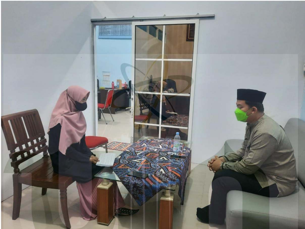
Lampiran 3 Wawancara Dengan Kepala Sekolah

UNIVERSITAS ISLAM NEGERI SUMATERA UTARA MEDAN