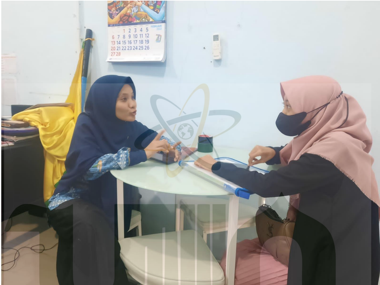
Lampiran 6 Wawancara Dengan Wali Kelas

UNIVERSITAS ISLAM NEGERI SUMATERA UTARA MEDAN