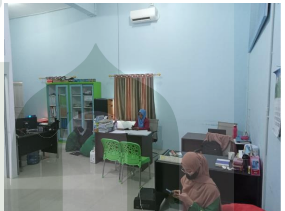
Ruangan Kepala Yayasan