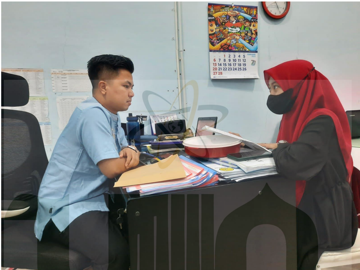
Lampiran 4 Wawancara Dengan Waka Kesiswaan

UNIVERSITAS ISLAM NEGERI SUMATERA UTARA MEDAN