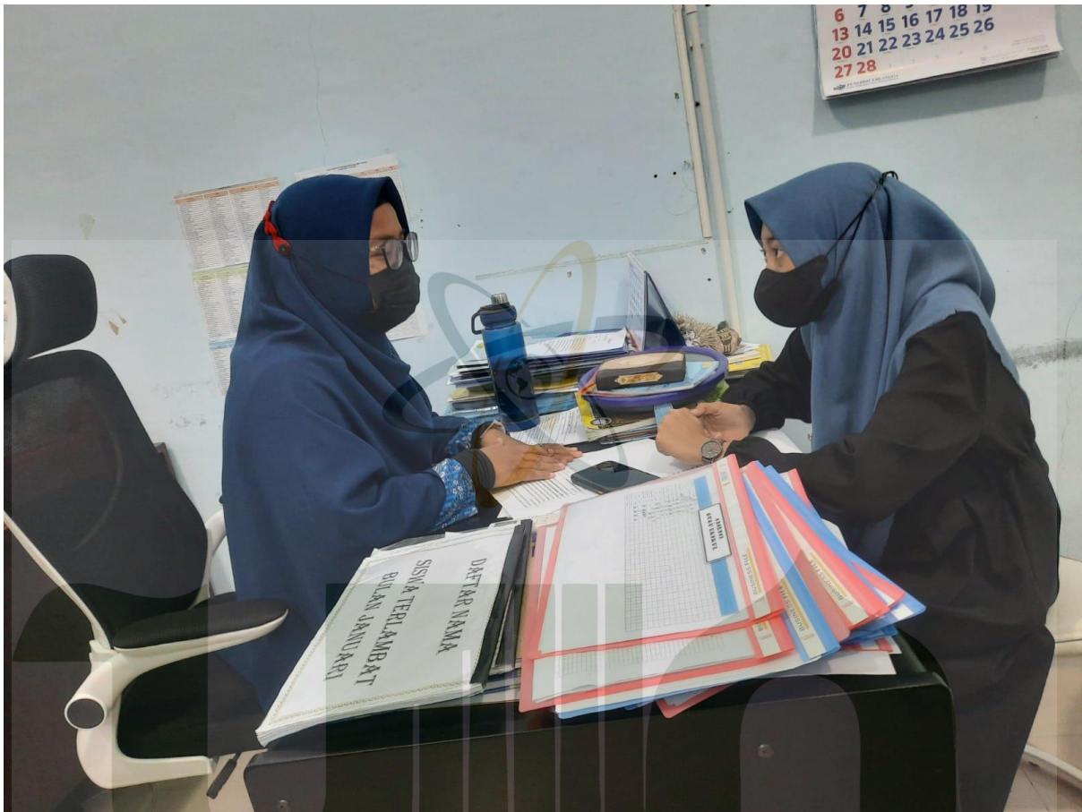
Lampiran 5 Wawancara Dengan Guru BK

UNIVERSITAS ISLAM NEGERI SUMATERA UTARA MEDAN