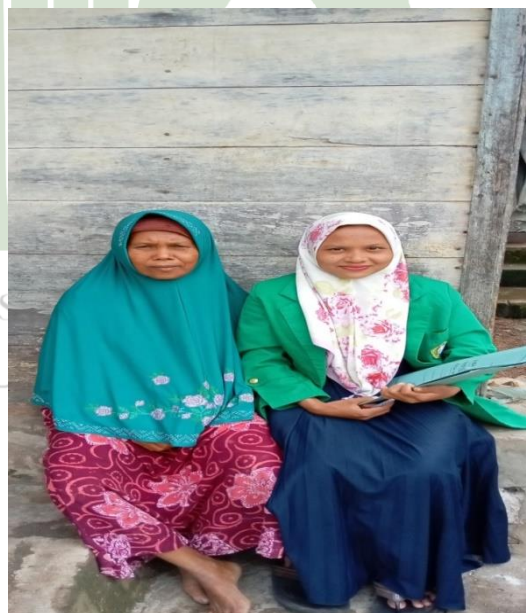
Gambar: Wawancara dengan masyarakat hatobangon di Kecamatan Padang Bolak Julu Kabupaten Padang Lawas Utara.