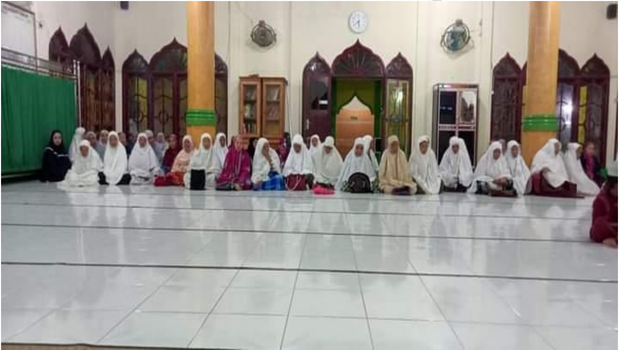
Foto Kegiatan Pengajian Pengajian di Masjid Baitul Huda di Simpang Tiga Kecamatan Besitang