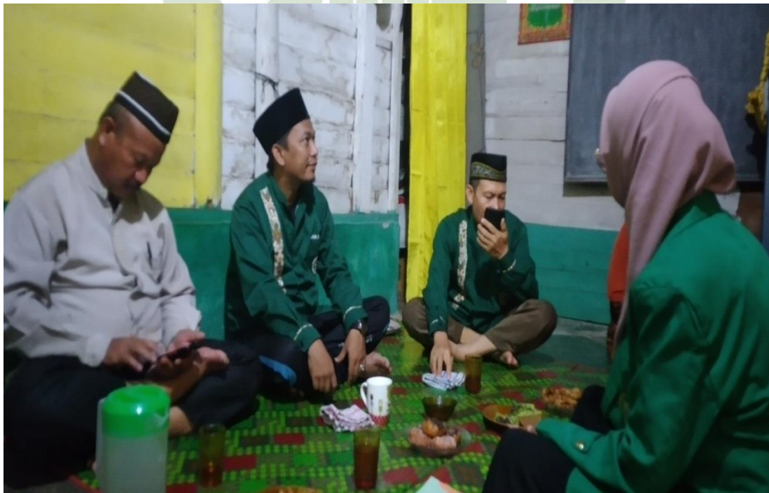
Foto Wawancara dengan Dewan Pakar Dewan Masjid Indonesia, Ketua dan Bendahara Dewan Masjid Indonesia Kecamatan Besitang