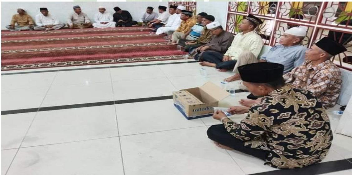
Foto Kegiatan Nuzulul Quran di Masjid Raya Kecamatan Besitang