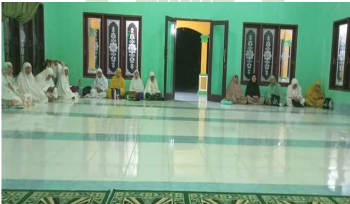
Foto Kegiatan Gerakan Shalat Subuh Berjamaah di Masjid Al-Ikhlas Pantai Gadung Desa Bukit Mas Kecamatan Besitang