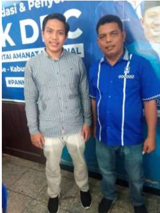
Wawancara dengan Ketua DPC PAN Kecamatan Batang Serangan/Anggota DPRD Kabupaten Langkat.