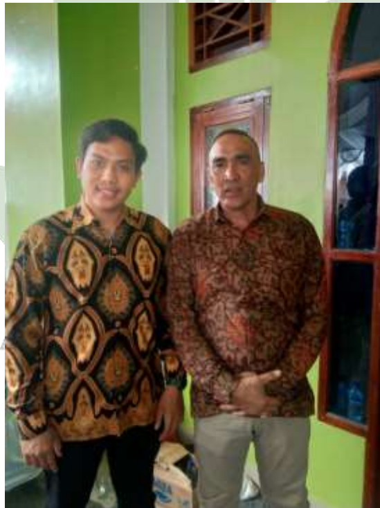
Wawancara dengan Wakil Ketua DPD PAN Kabupaten Langkat/Anggota DPRD Kabupaten Langkat.