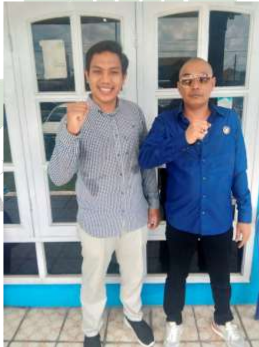
Wawancara dengan Bendahara DPD PAN Kabupaten Langkat/Anggota DPRD Kabupaten Langkat.