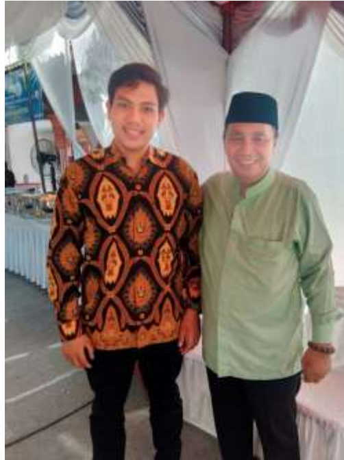
Wawancara dengan Ketua DPD PAN Kabupaten Langkat/Wakil Ketua DPRD Kabupaten Langkat.