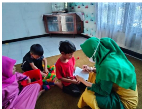
Pembelajaran Permainan Konstruktif Balok Anak Dan Guru