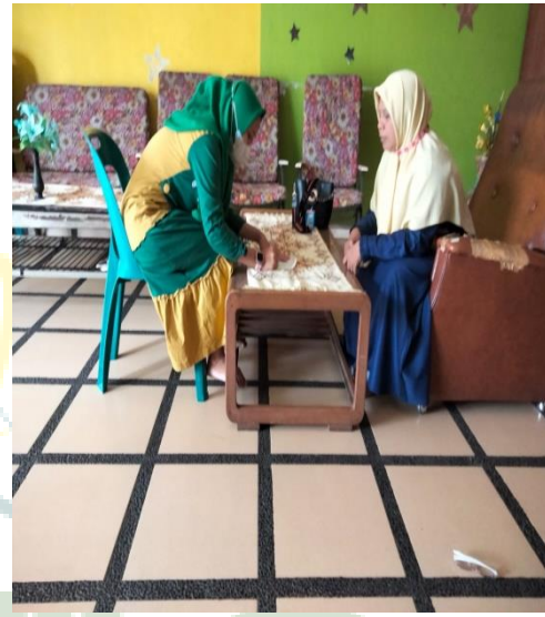
Wawancara Dengan Guru