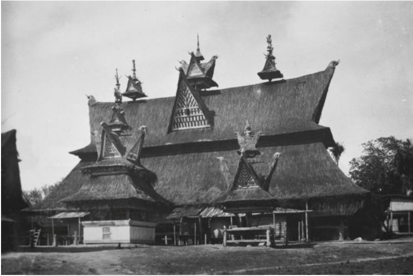
Rumah Adat Karo

Rumah adat Karo dihiasi berbagai macam ornamen, salah satu yang menarik untuk diamati ialah ornamen yang berfungsi sebagai pengikat bilah-bilah papan yang disebut dengan Pengeretret. Secara filosofis pengeretret ini menggambarkan motif kulit ular sawah berkepala dua dan berkaki empat yang menyimbolkan hubungan sepasang manusia yang diikat dalam satu perkawinan, dan terus menjaga persatuan agar rumah terjaga dengan baik. Selain itu ornamen tersebut juga dipercaya sebagai penolak bala.