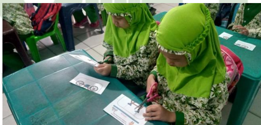
Menggunting puzzle gambar sepeda