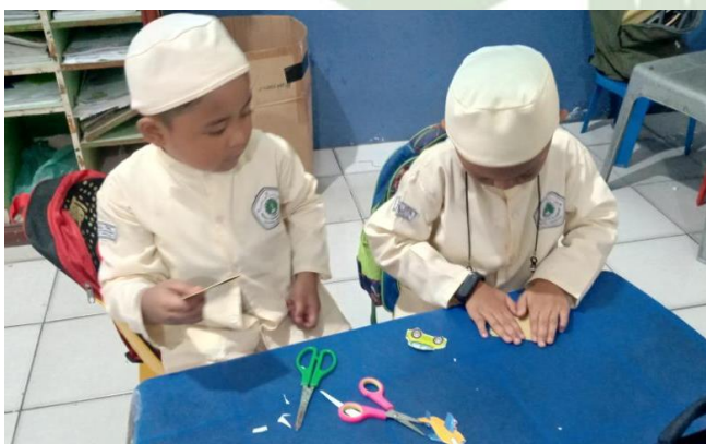
Membuat pop-up kartu sederhana