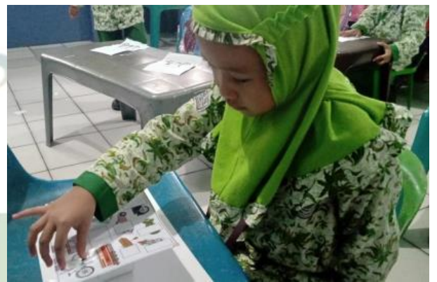
Menyusun potongan gambar yang hilang