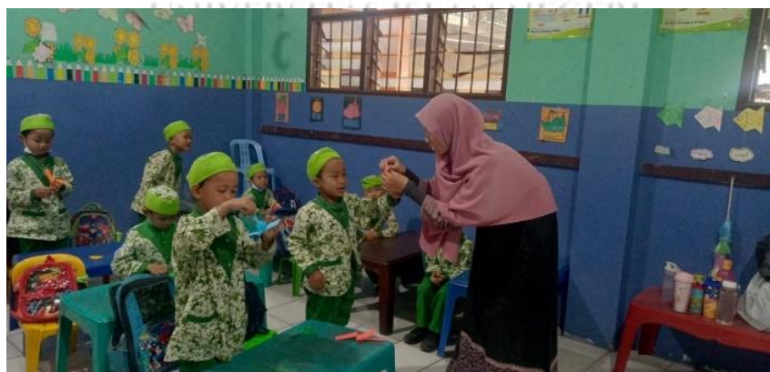
Membuat baling-baling helicopter dari kertas origami