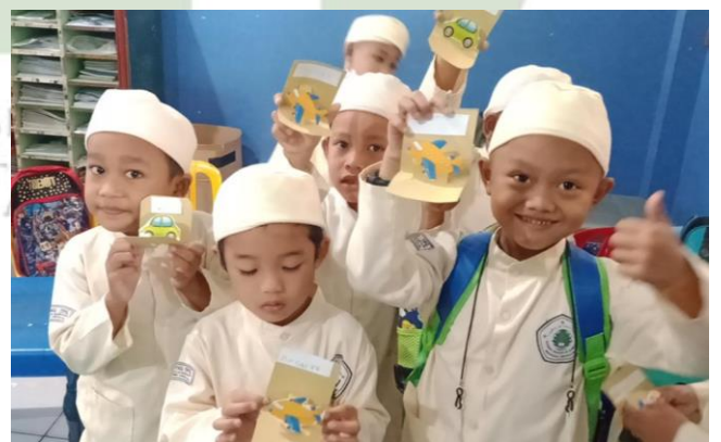
Memperlihatkan hasil kerja anak