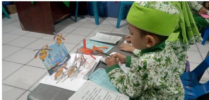
Menghitung jumlah kendaraan yang ada di media pop-up