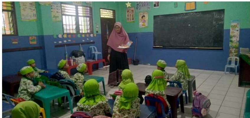
memperkenalkan media pop-up book pada anak