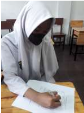
b. Proses Konseling