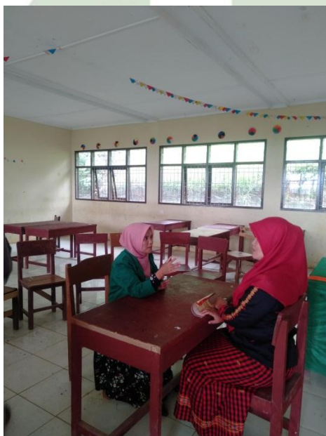
Gambar 1.6. Wawancara dengan ibu NS guru BK SMK N 1 Sipirok