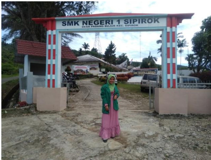
Gambar 1.3. Gerbang Sekolah SMK Negeri 1 Sipirok