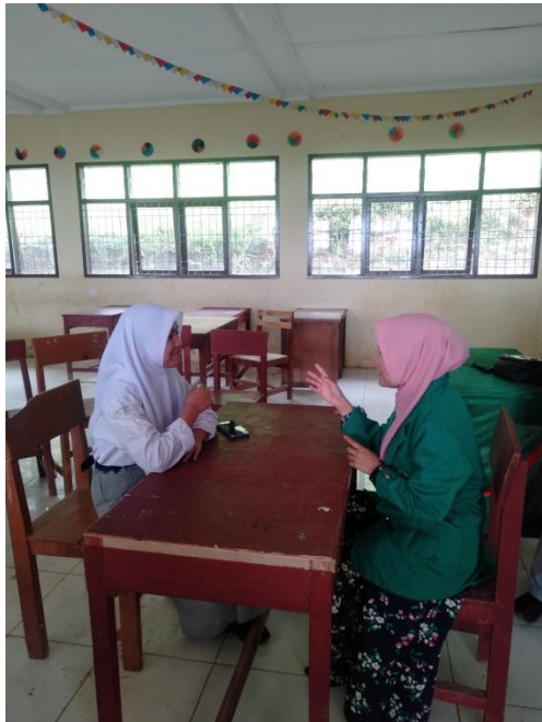
Gambar 1.7. Wawancara dengan salah satu siswa