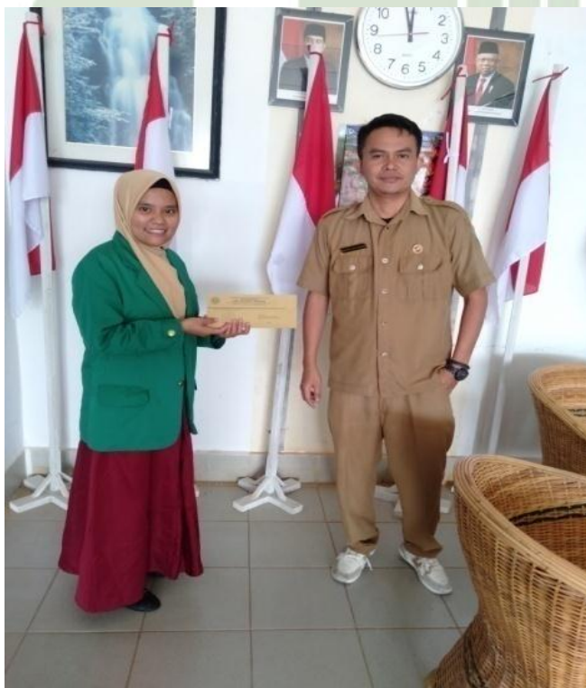
Gambar 1.4. Dengan Kepala Sekolah SMK Negeri 1 Sipirok