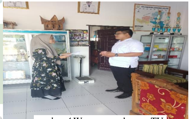
gambar 4 Wawancara dengan TU