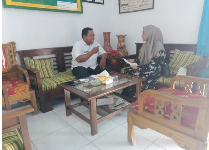
Gambar 2 Wawancara dengan Kepala Sekolah