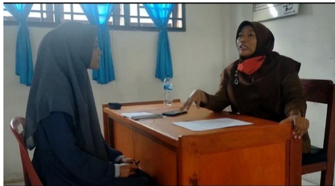
gambar 5 Wawancara dengan guru