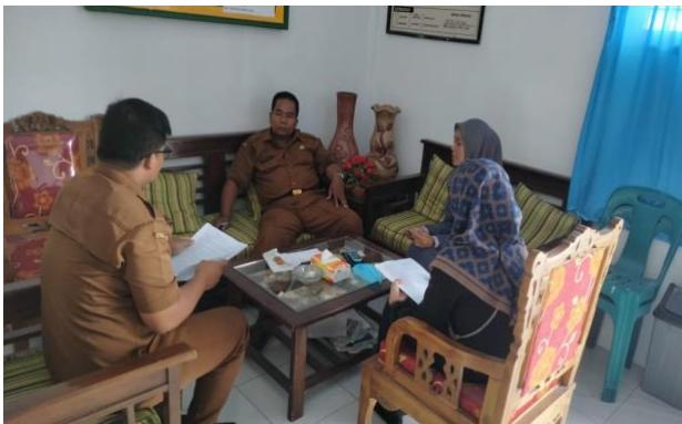
gambar 3 Wawancara dengan Wakil Kepala Sekolah dan Kepala Sekolah