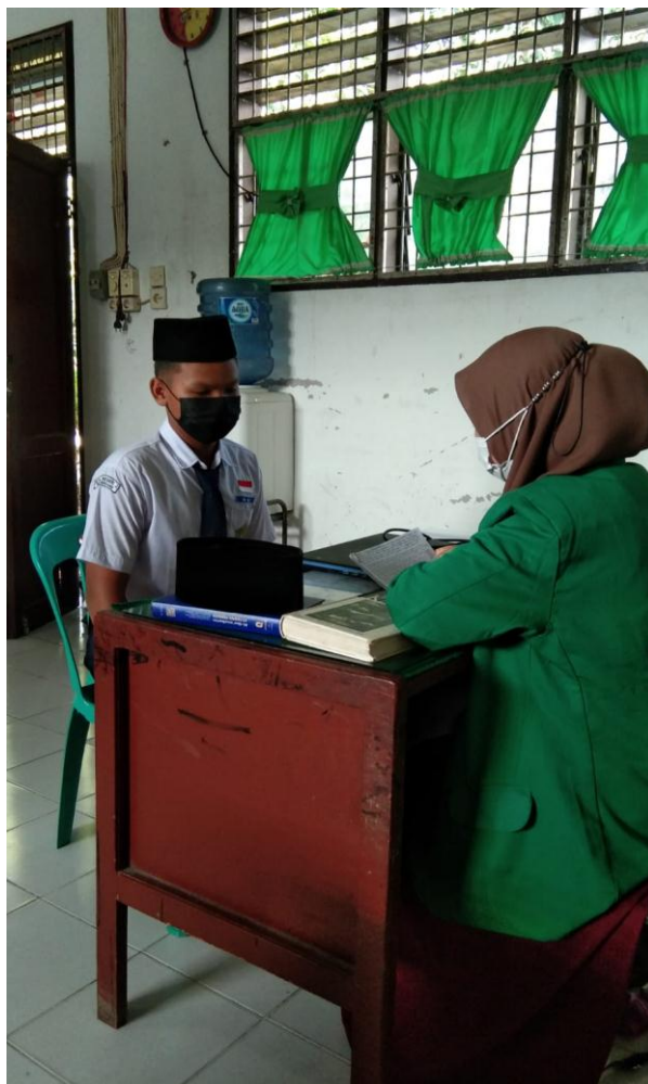
Gambar 5.9 Wawancara dengan Siswi MTs Negeri 2 Deli Serdang Berinisial (NA)

UNIVERSITAS ISLAM NEGERI SUMATERA UTARA MEDAN