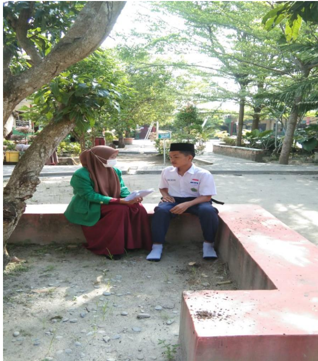
Gambar 5.5 Wawancara dengan Siswi MTs Negeri 2 Deli Serdang Berinisial (RH)