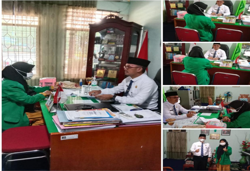
Gambar 5.3 Wawancara dengan Kepala Sekolah MTs Negeri 2 Deli Serdang