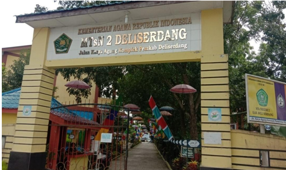
Gambar 5.1 Pintu Masuk Madrasah Tsanawiyah Negeri 2 Deli Serdang