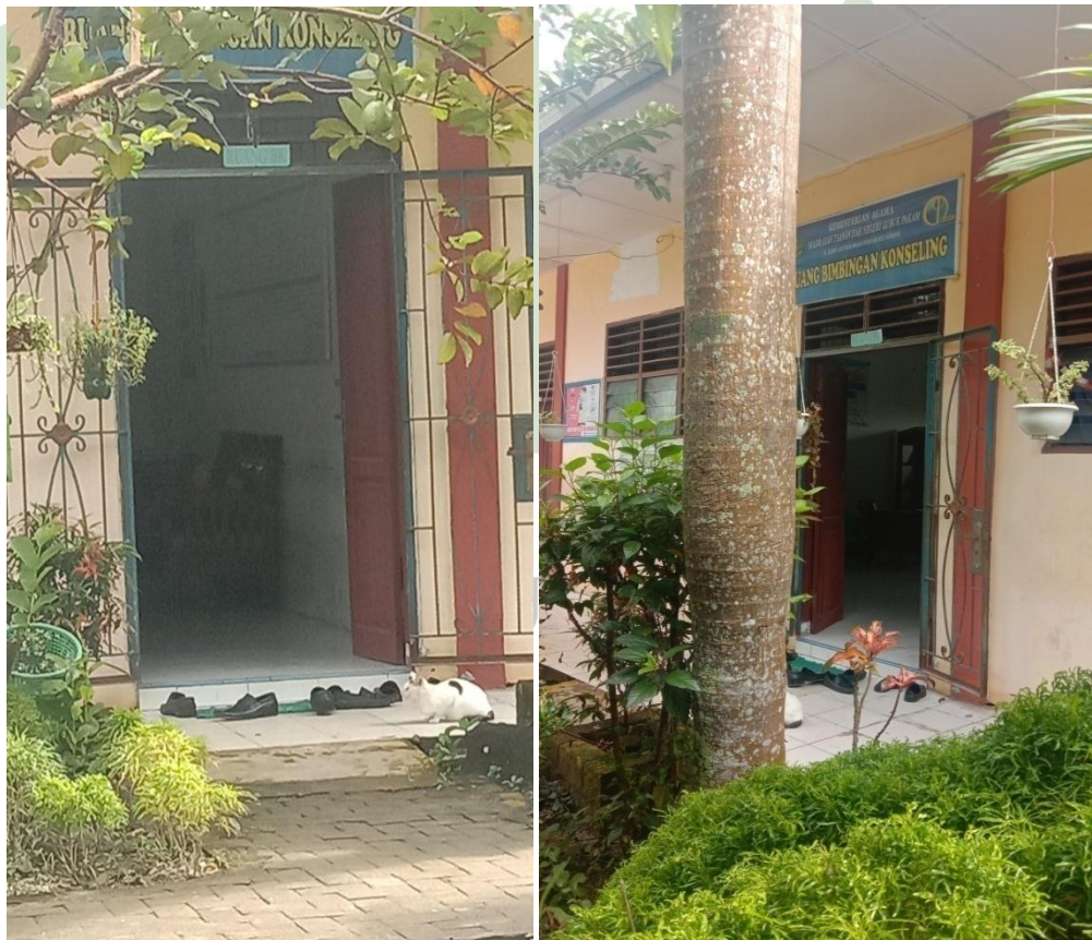
Gambar 5.2 Ruang BK Madrasah Tsanawiyah Negeri 2 Deli Serdang