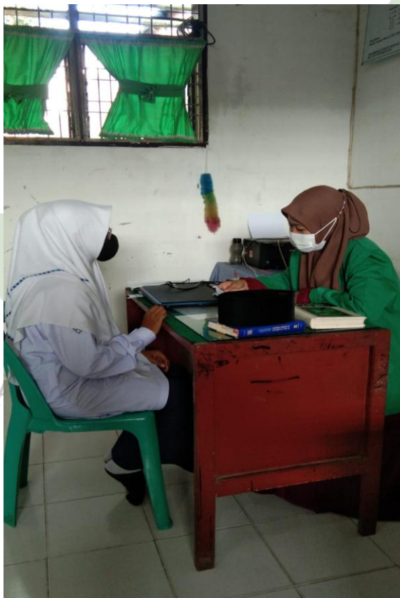
Gambar 5.8 Wawancara dengan Siswi MTs Negeri 2 Deli Serdang Berinisial (GC)