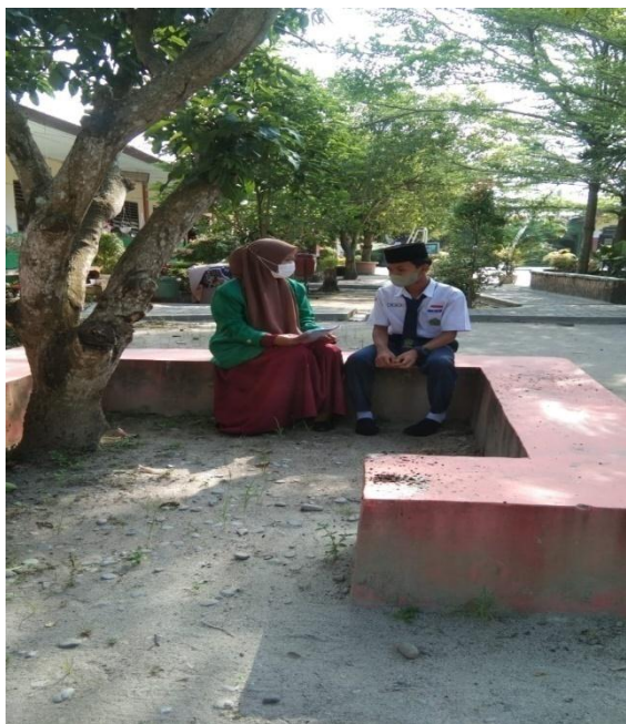
Gambar 5.7 Wawancara dengan Siswi MTs Negeri 2 Deli Serdang Berinisial (SA)