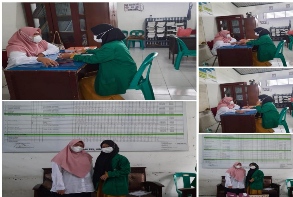
Gambar 5.4 Wawancara dengan Guru BK MTs Negeri Negeri 2 Deli Serdang