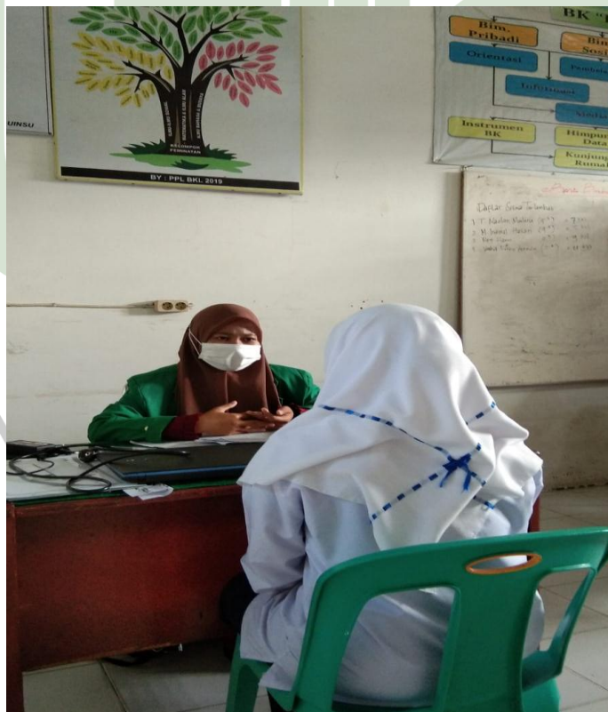
Gambar 5.6 Wawancara dengan Siswi MTs Negeri 2 Deli Serdang Berinisial (NM)