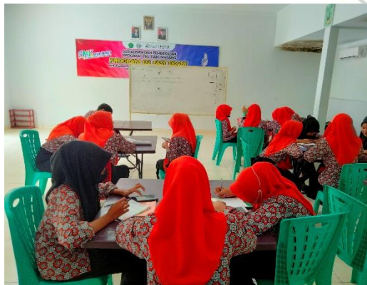
Pic 3 Students were writing narrative text