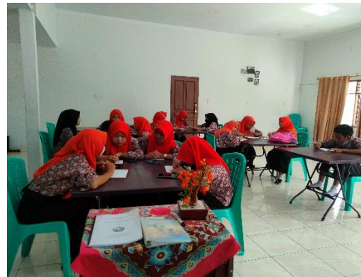
Pic 2 Students were writing narrative text