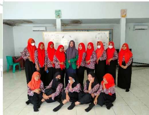
Pic 4 Researcher and all of the students of X Culinary art