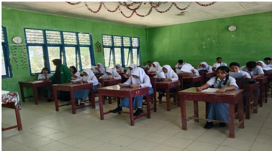
Pembagian/pengisian angket 1