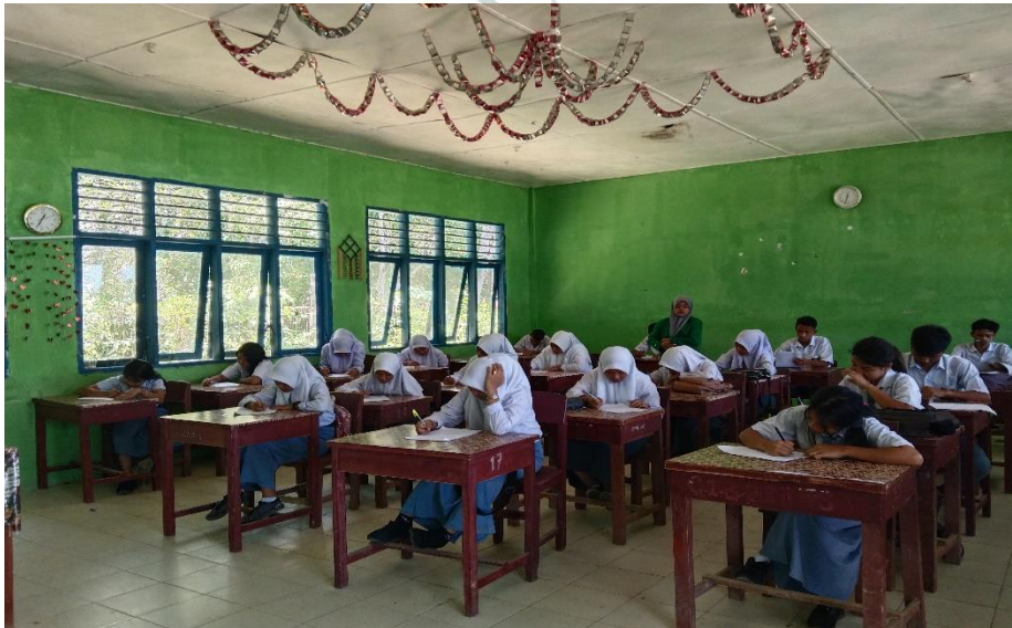
Pengisian angket ke 2