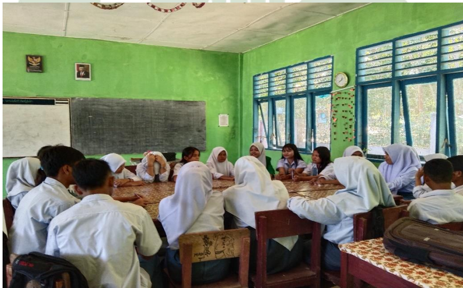
Pelaksanaan bimbingan kelompok