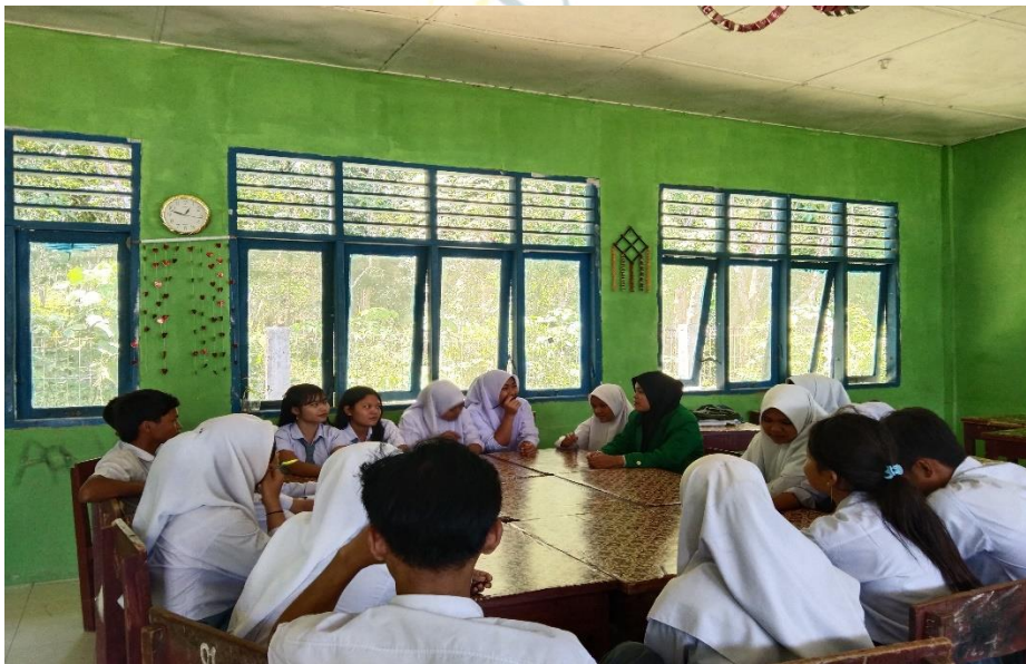
Pelaksanaan Bimbingan Kelompok