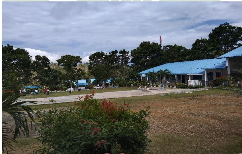
Lapangan sekolah SMA Negeri 2 Siabu