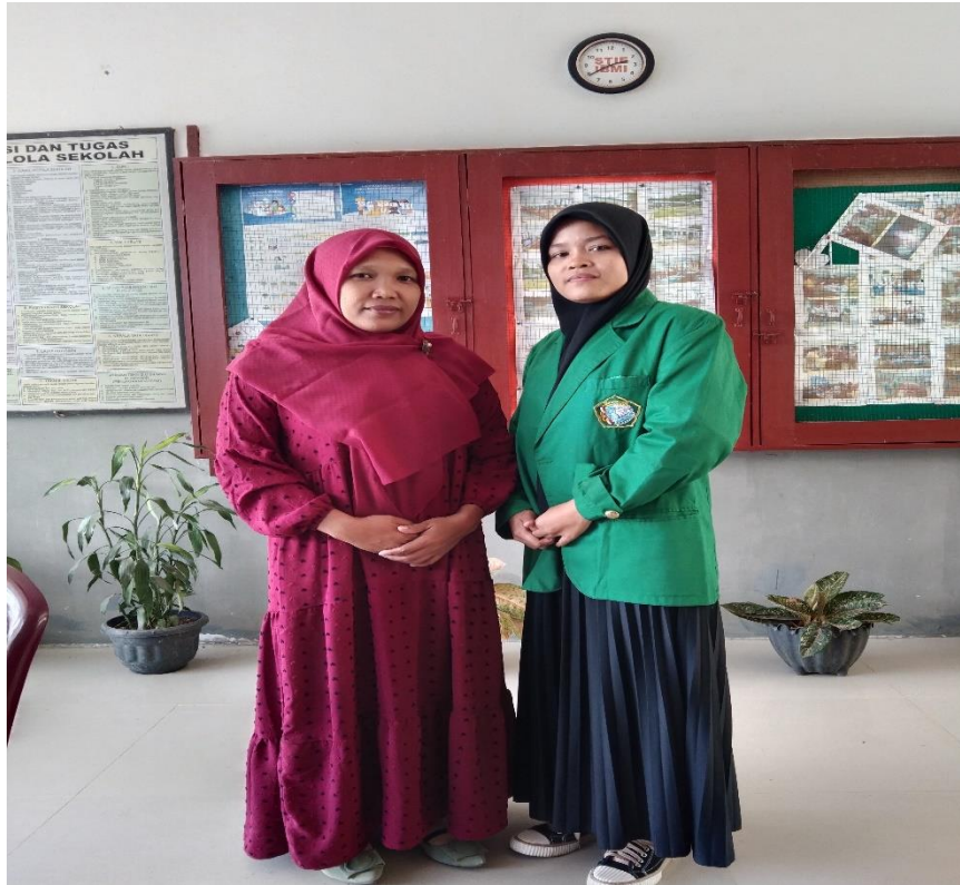
Foto Bersama Guru BK

UNIVERSITAS ISLAM NEGERI SUMATERA UTARA MEDAN