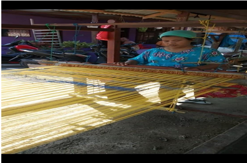
Gambar 1. foto masyarakat pengrajin kain tenun songket di desa kampung panjang kecamatan talawi