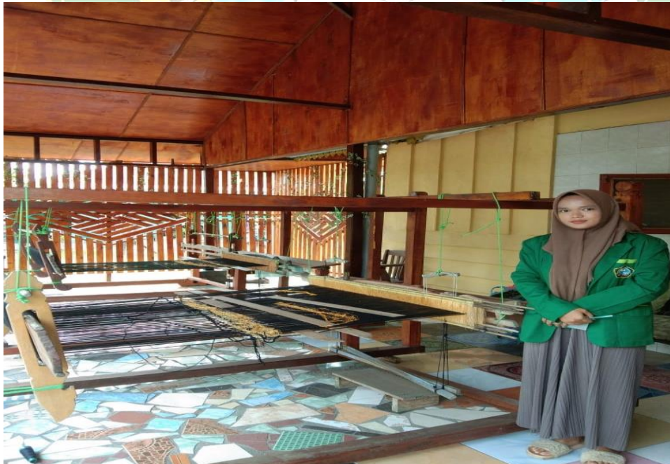
Gambar 2. foto ATBM (alat tenun bukan mesin)