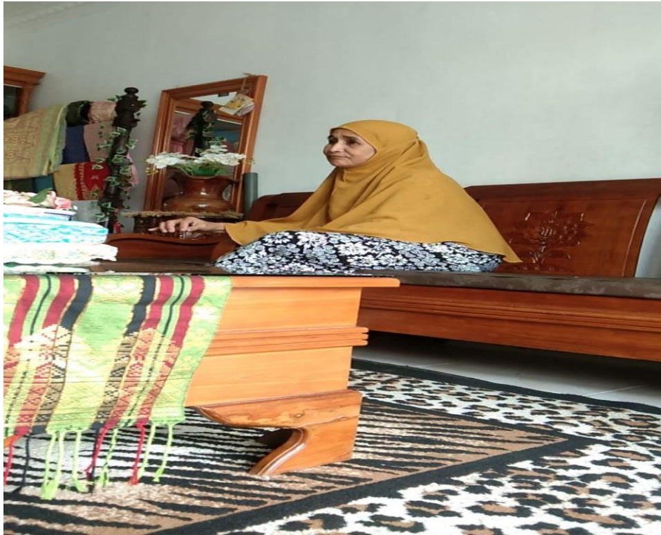
Gambar 3. foto pemilik usaha tenun songket