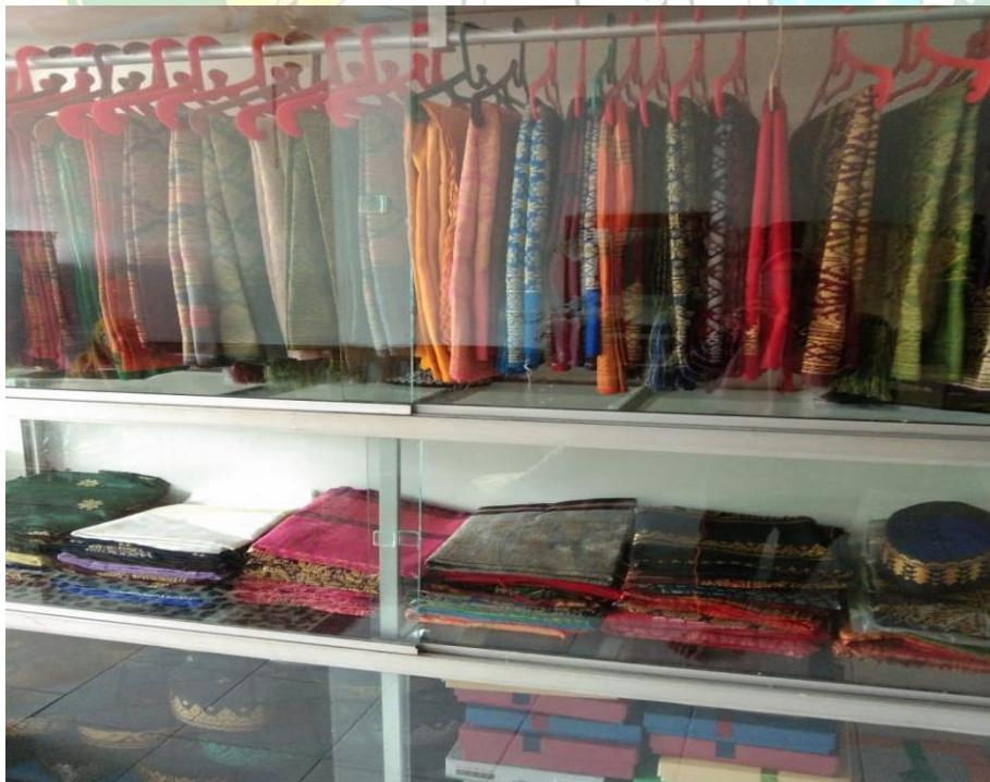
Gambar 8. foto berbagai kain tenun songket