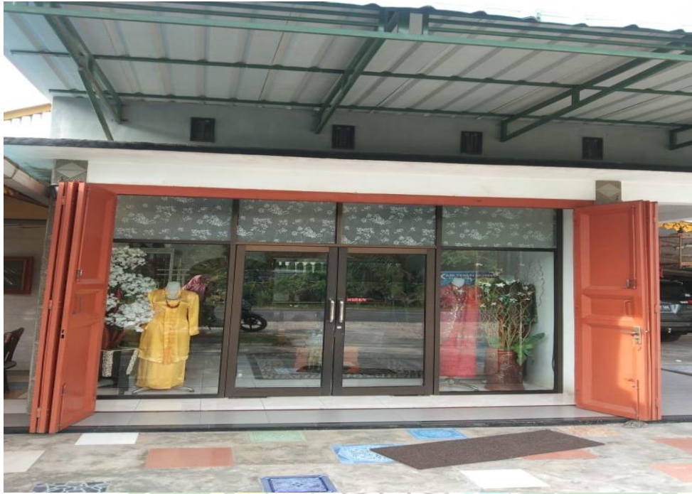
Gambar 5. foto toko pemilik usaha tenun songket