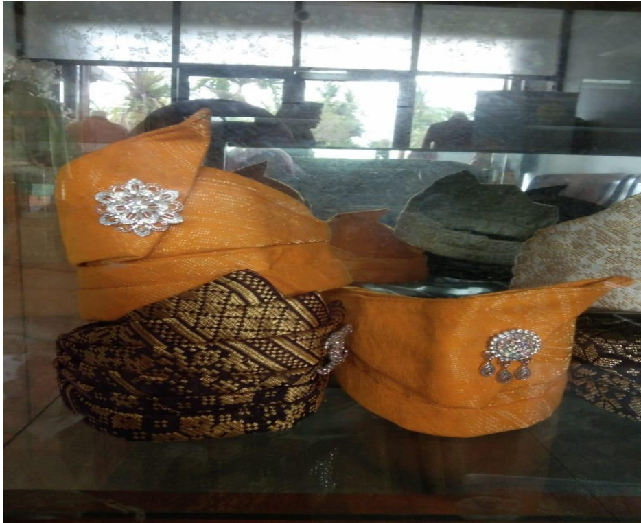
Gambar 7. foto tenun songket tengkuruk