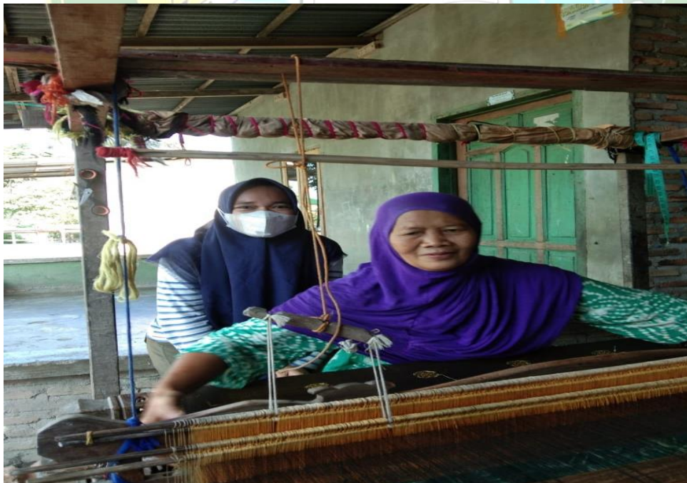
Gambar 4. foto bersama pemilik usaha tenun songket