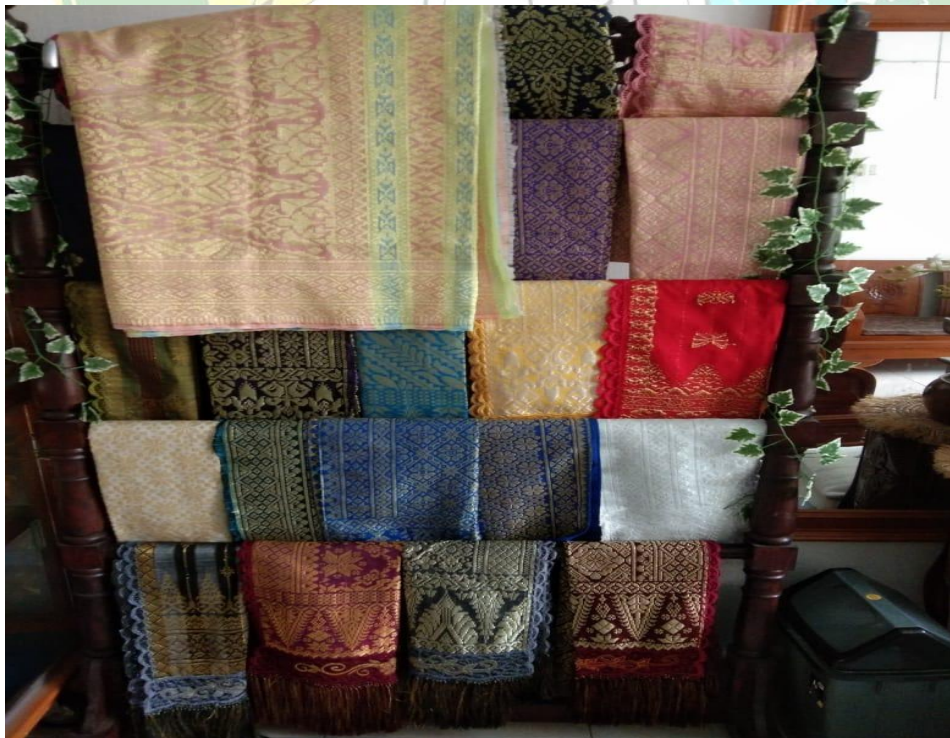
Gambar 6. foto kain tenun selendang untuk wanita