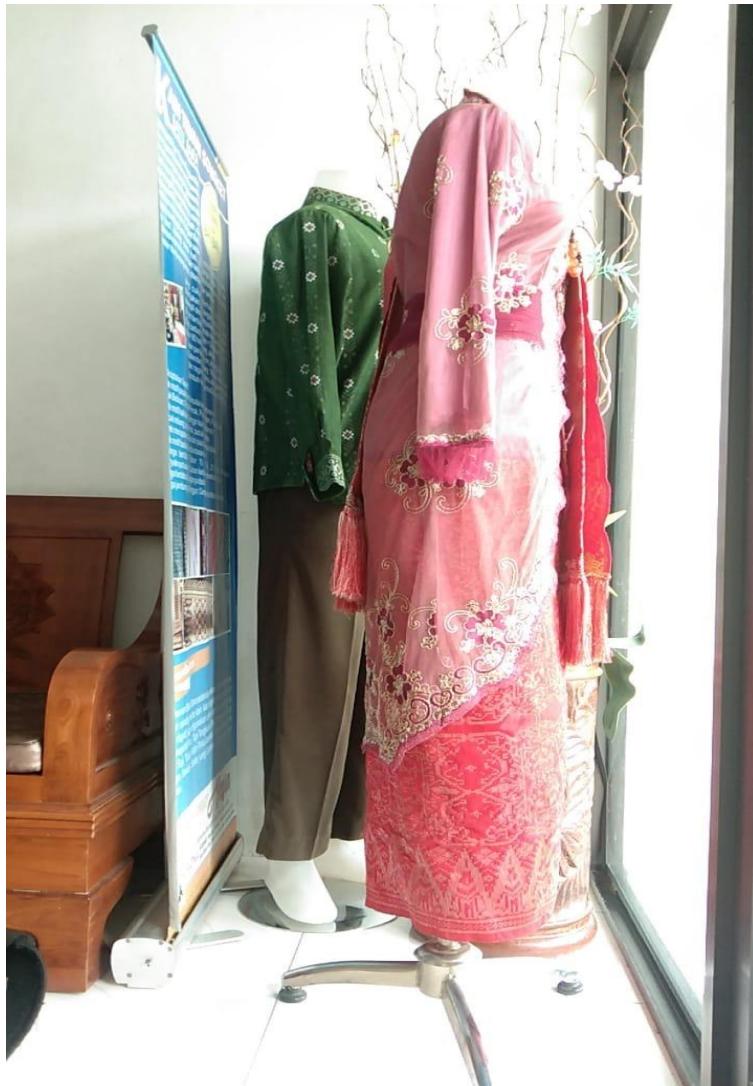
Gambar 9. foto baju jadi wanita dan pria