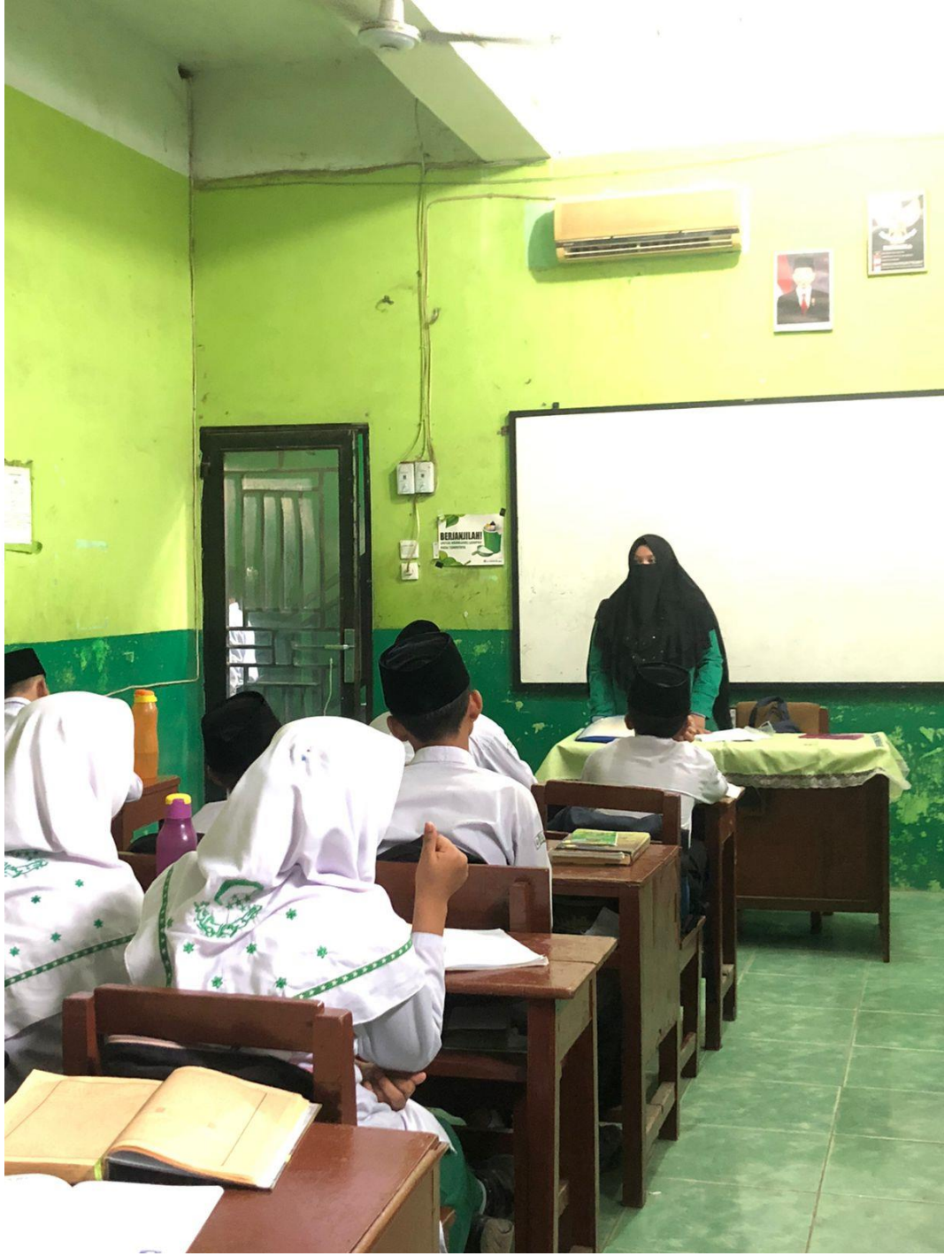
صور اعطاء هدية