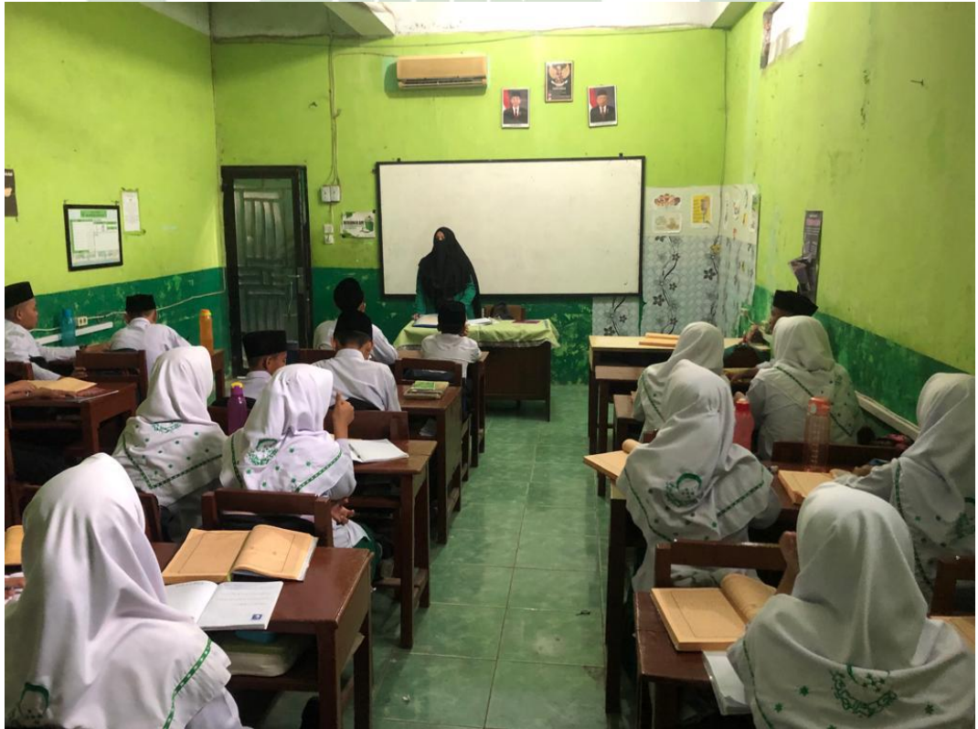
صور عملية التعليم