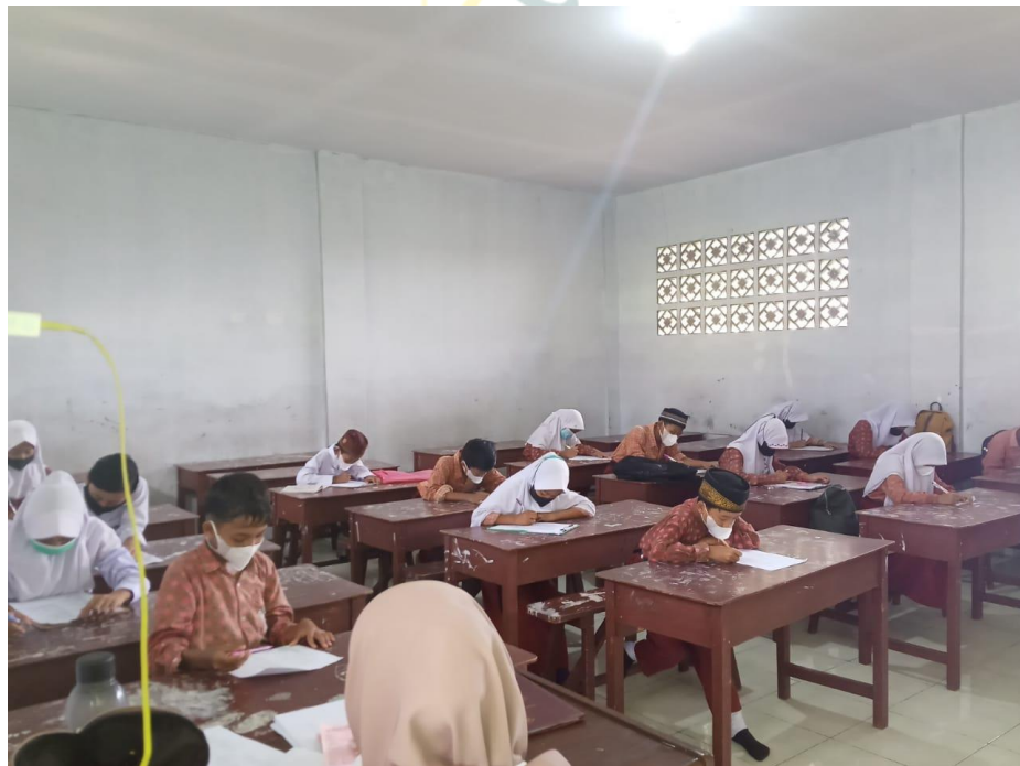
Mengawas Ujian Akhir Sekolah Kelas V-A/Gel. II