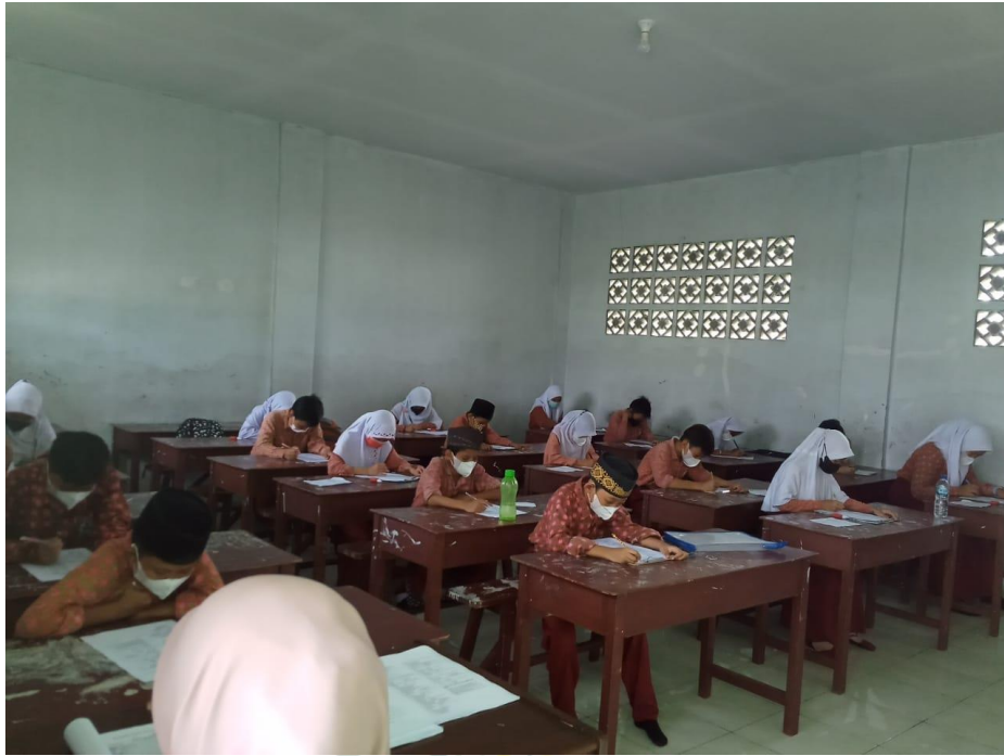
Mengawas Ujian Akhir Sekolah Kelas V-A/Gel. I