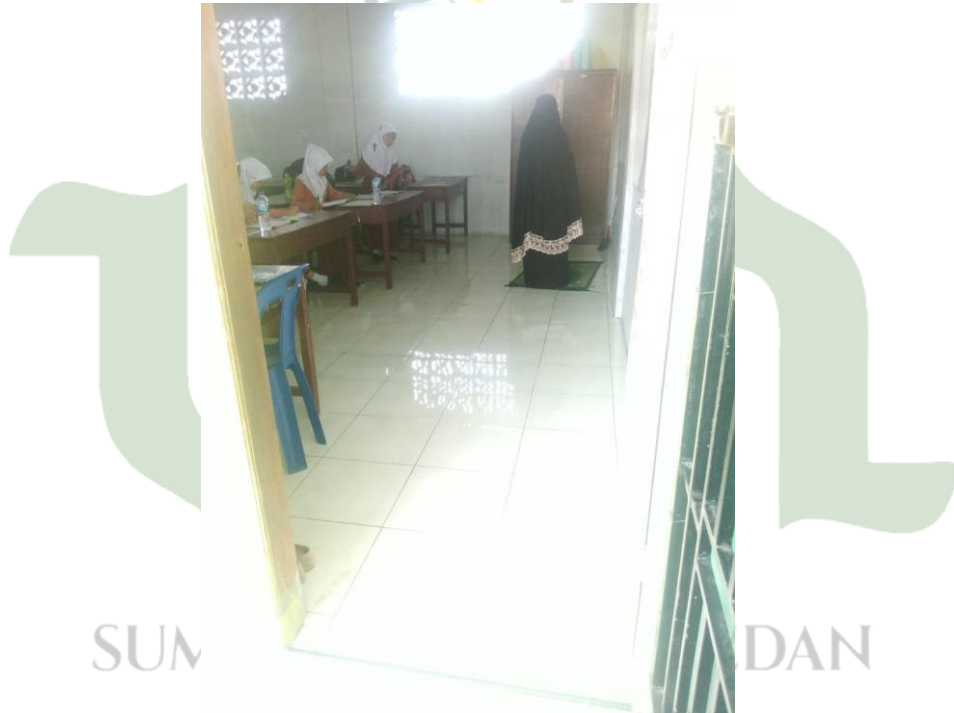
Gambaran salah satu guru yang melaksanakan sholat dzuhur di dalam kelas sebagai teladan bagi siswa