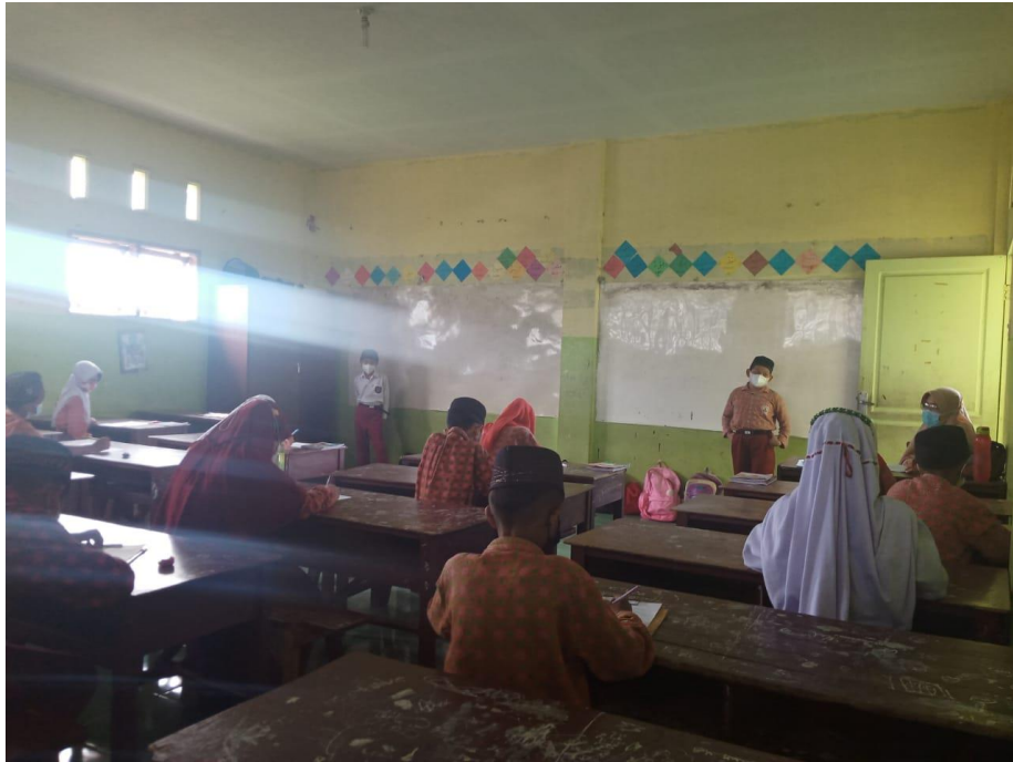
Mengawas Ujian Akhir Sekolah Kelas V-C/Gel. I