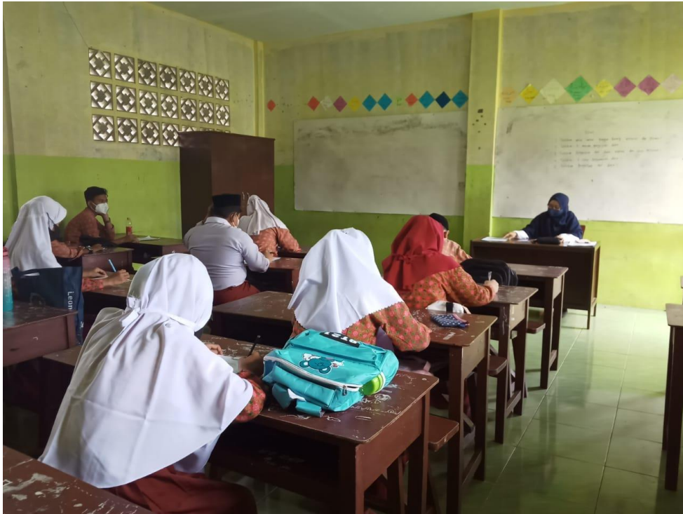
Mengawas Ujian Akhir Sekolah Kelas V-B/Gel. I