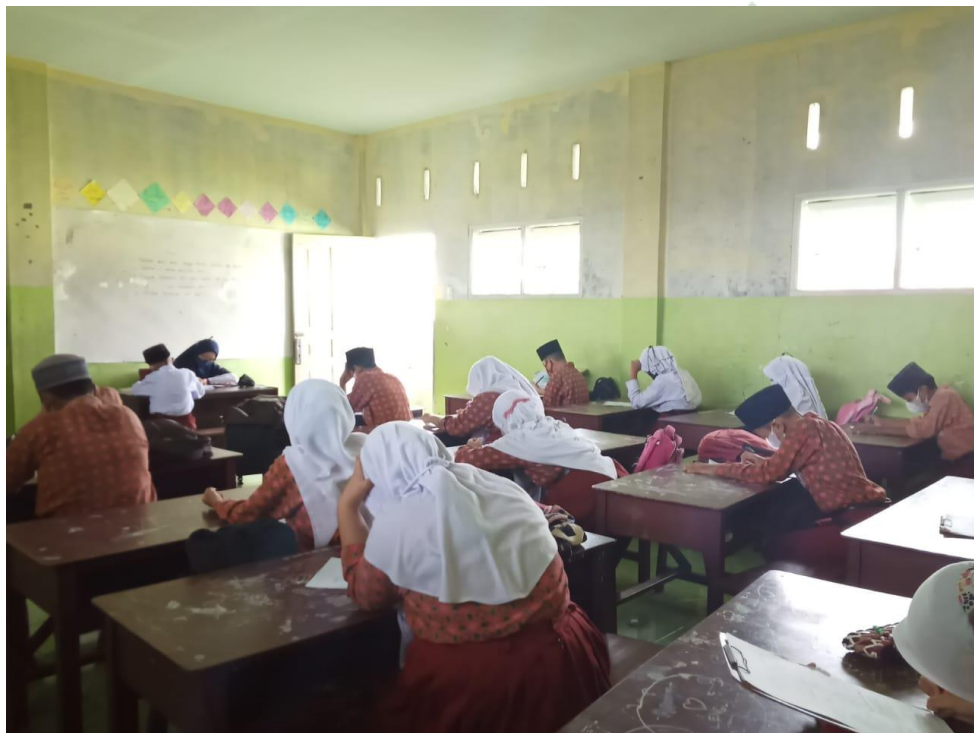
Mengawas Ujian Akhir Sekolah Kelas V-B/Gel. II