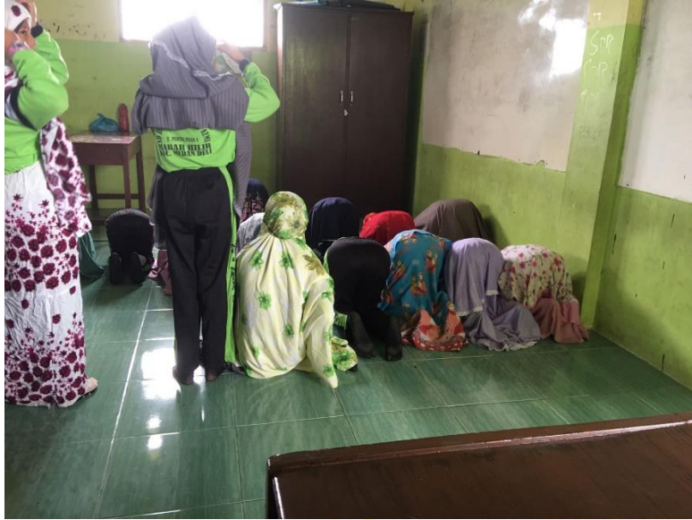
Gambaran siswi kelas V yang sedang melaksanakan sholat dzuhur di dalam kelas