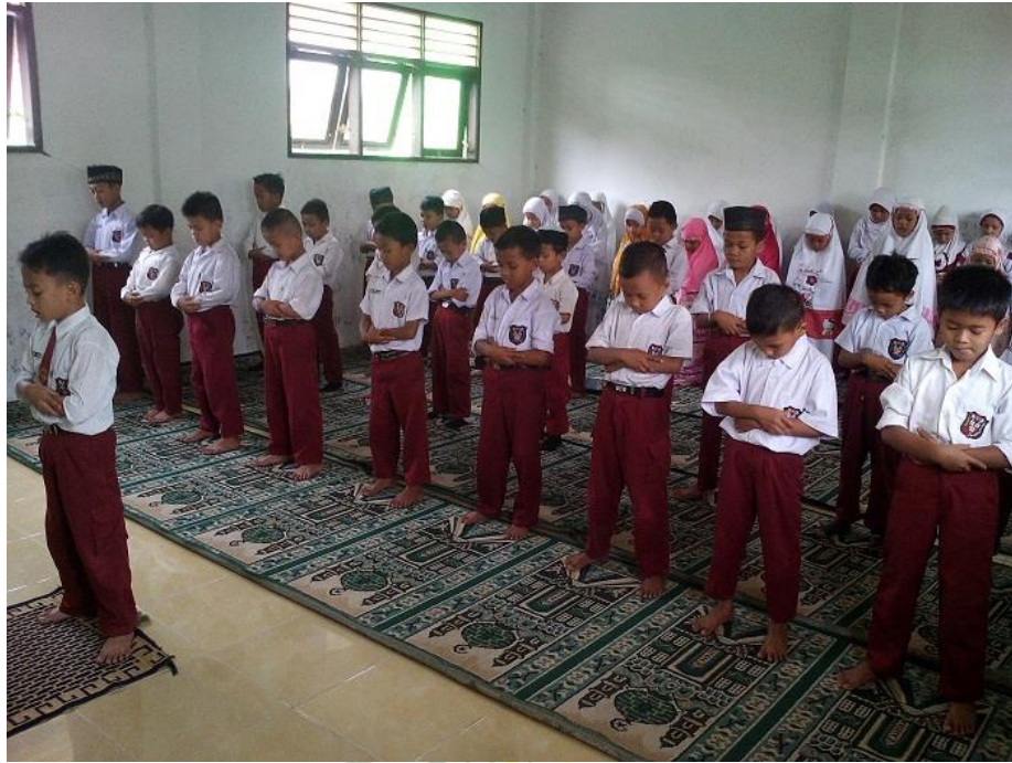
Gambaran siswa/i melaksanakan sholat dzuhur di musholla