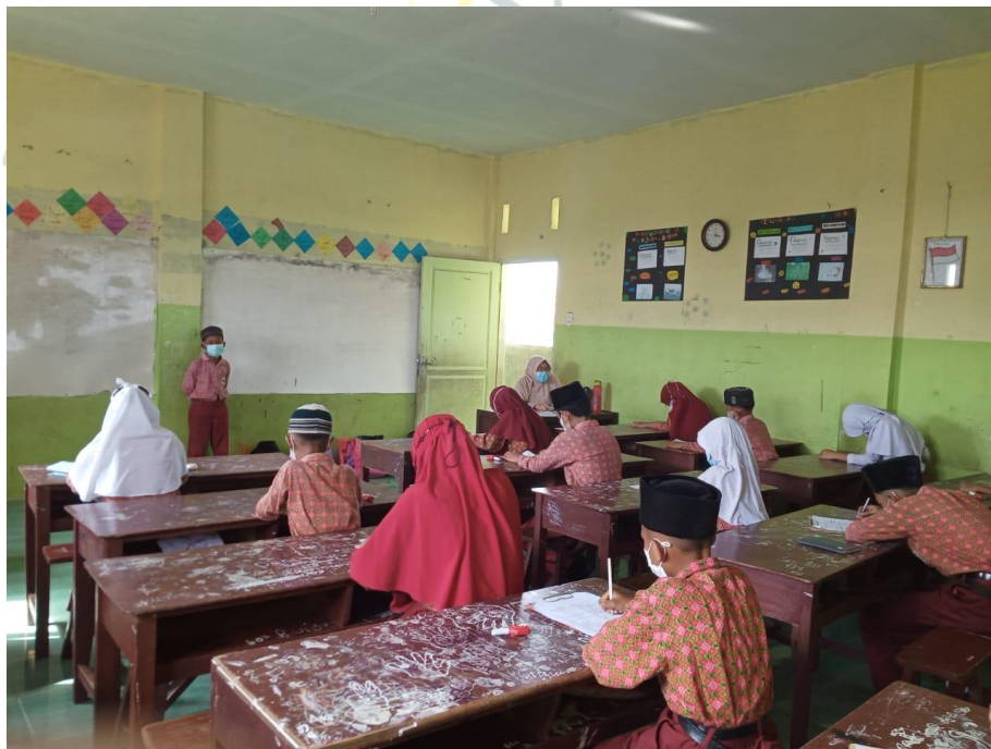
Mengawas Ujian Akhir Sekolah Kelas V-C/Gel. II

Dan terdapat potret siswa yang tidak disiplin mengumpulkan tugas sebagai syarat ujian