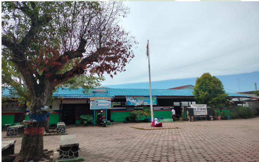
Penampakan sekolah UPTD. SD Negeri 27 Kotapinang