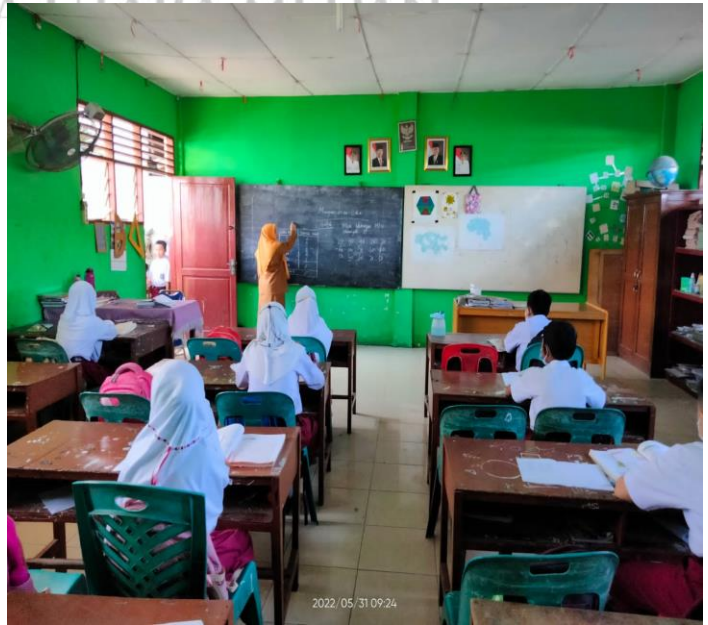
Kedaaan Pengajaran yang dilakukan Guru Kelas IV B