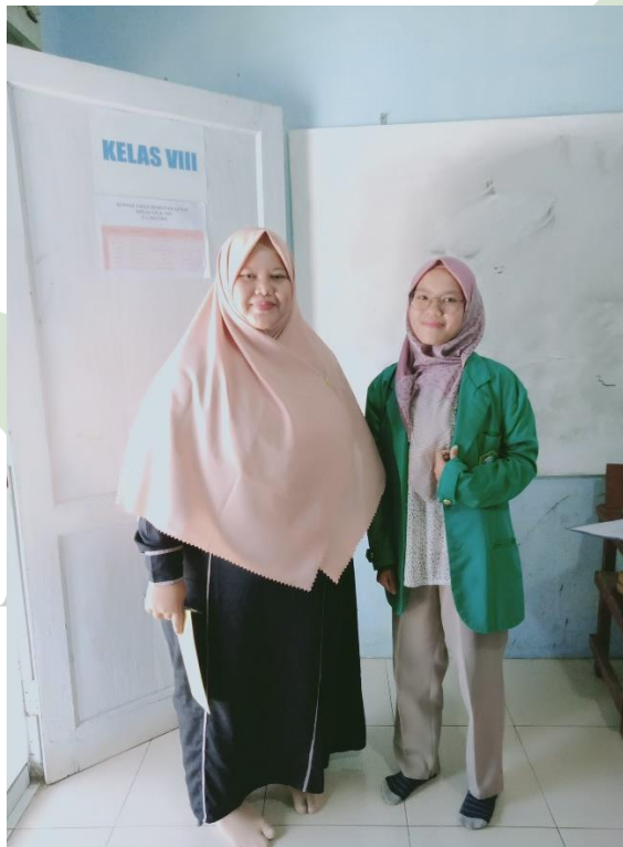
Wawancara dengan Kepala Madrasah MTs hidayatussalam Medan..