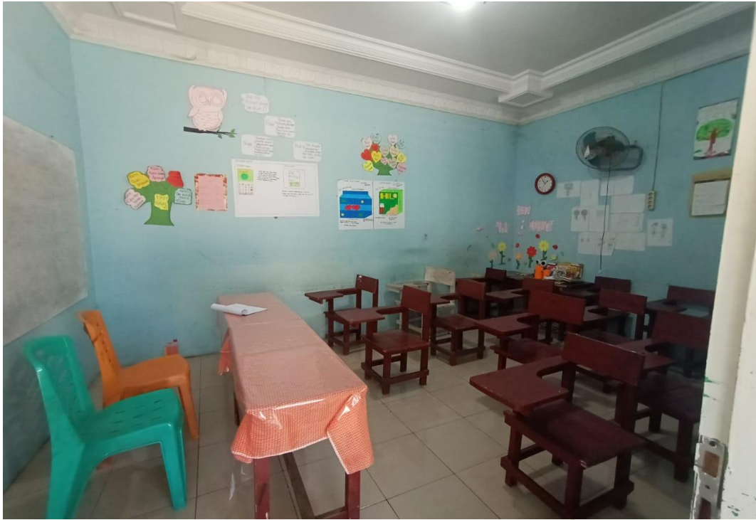
Ruang Kelas MTs Hidayatussalam Medan