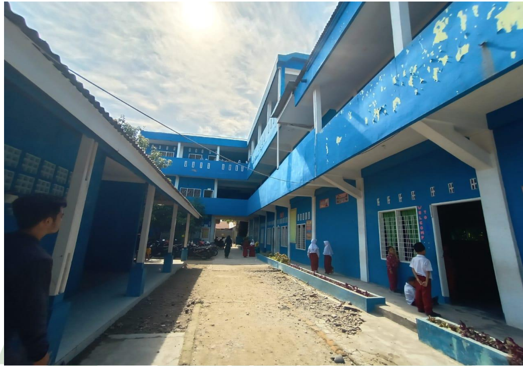
MTS Hidayatussalam Medan