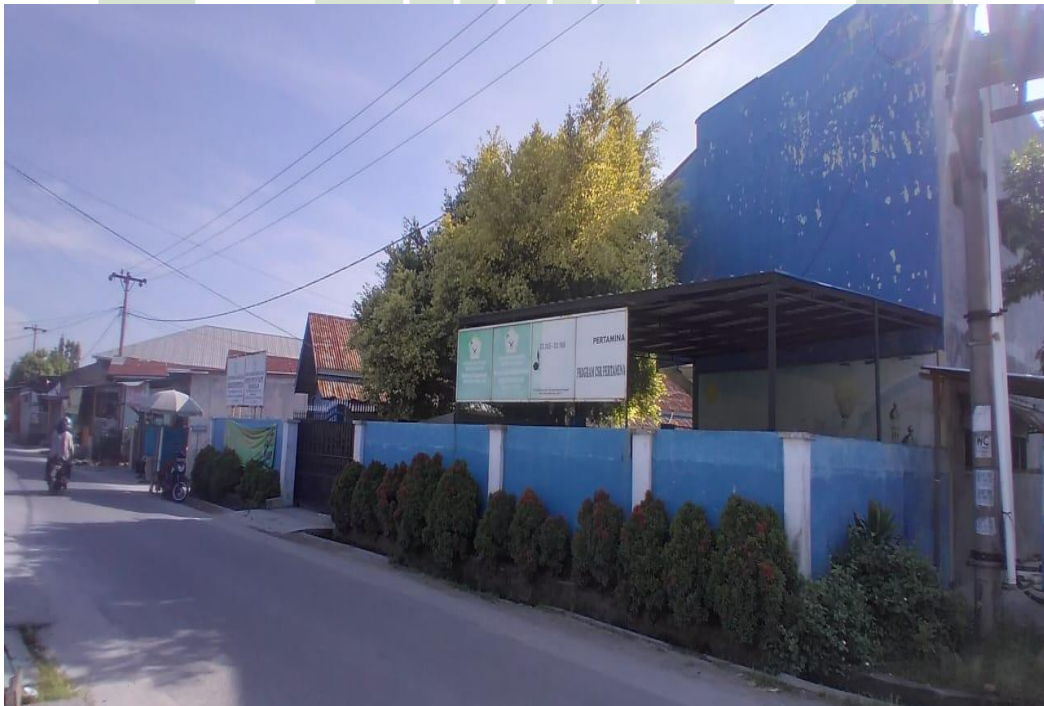
Depan MTs Hidayatussalam Medan