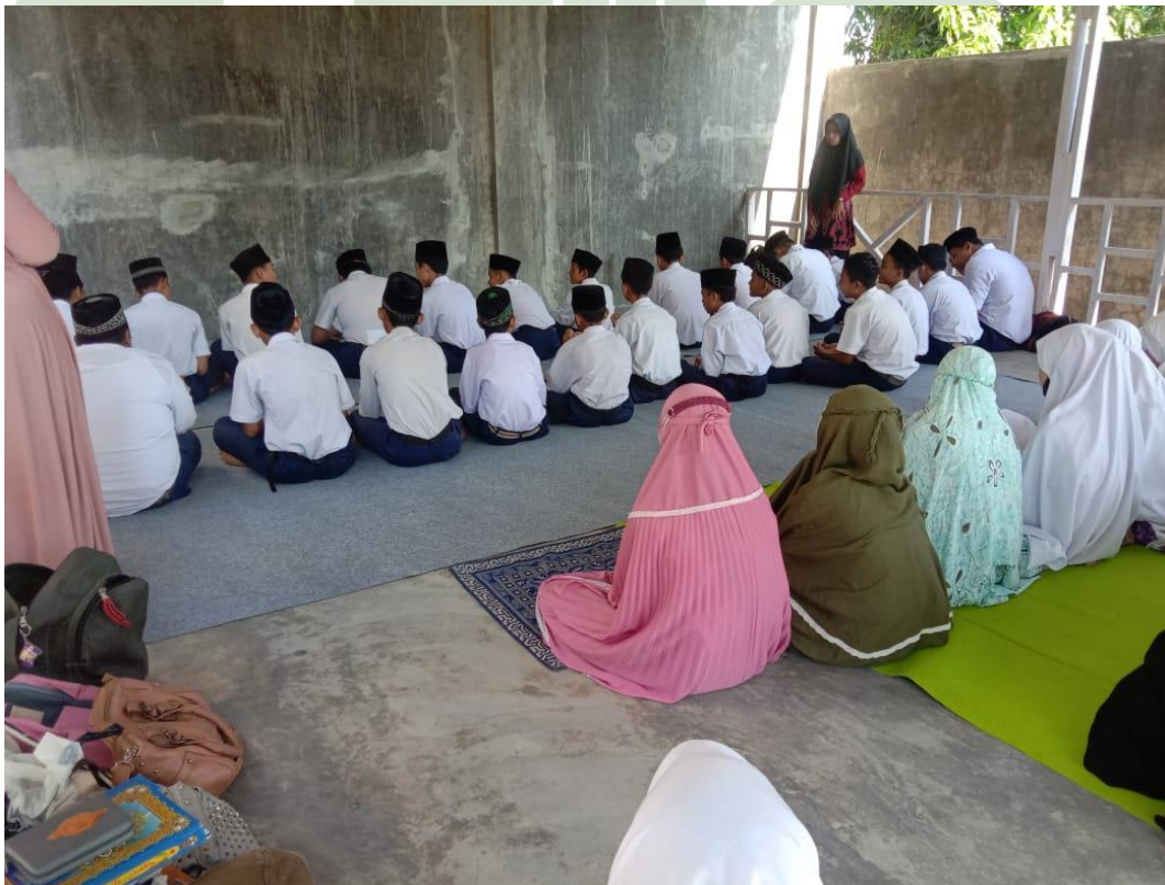
Proses Manajemen Kelas MTs Hidayatussalam Medan