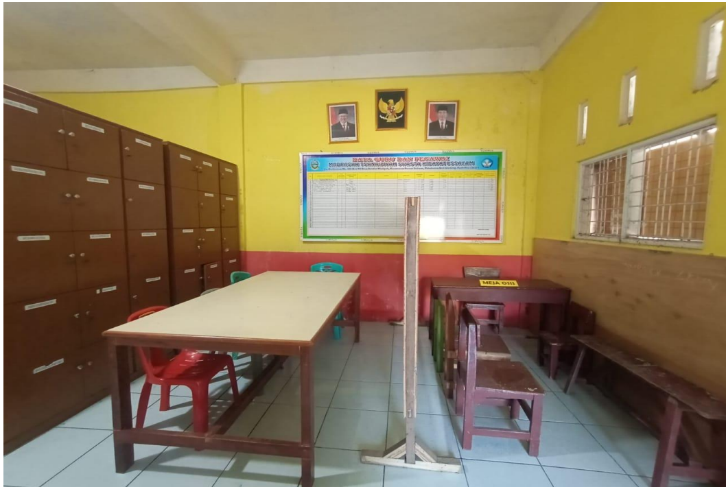
Ruang Perpustakaan MTs Hidayatussalam Medan