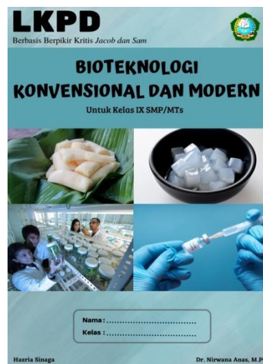
Gambar 2. Cover Setelah di Revisi