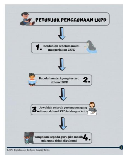
Gambar 4. Petunjuk Penggunaan LKPD Setelah di Revisi