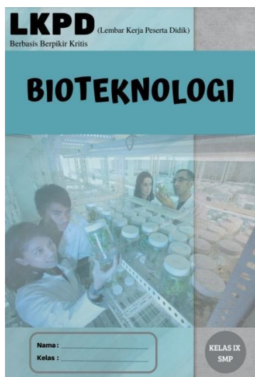
Gambar 1. Cover Sebelum di Revisi

Uji N-Gain dilakukan untuk melihat apakah nilai siswa meningkat sebelum dan sesudah diberikan LKPD. Berdasarkan hasil analisa data diperoleh skor N-Gain dengan nilai 0,6, yang termasuk kategori sedang, yang artinya nilai belajar siswa mengalami peningkatan. Hasil ini relevan terhadap penelitian yang dilakukan Apriyana et al., (2019) dengan uji N-Gain kelas A dengan nilai 0,7 serta kelas B dengan nilai 0,7 yang tergolong dalam kategori sedang. Hal tersebut menunjukkan pengembangan LKPD yang dikembangkan dapat menambah kemampuan siswa dalam berpikir kritis. Revisi pada produk ada pada beberapa bagian seperti pada cover, petunjuk penggunaan LKPD, penambahan aspek penilaian dan penambahan materi. Hasil revisi cover dan petunjuk penggunaan LKPD gambar 1 s/d 4.