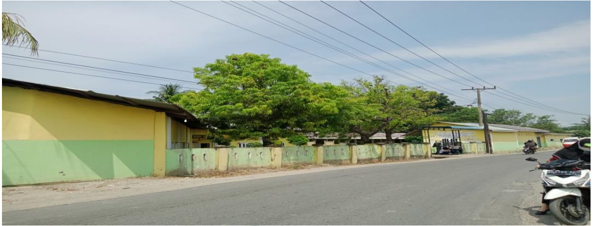
Foto Gedung Sekolah RA Rahmat