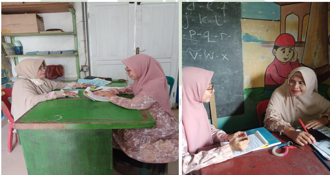
Wawancara dengan Guru Kelas RA Rahmat