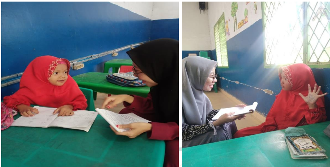
Wawancara dengan murid di RA Rahmat