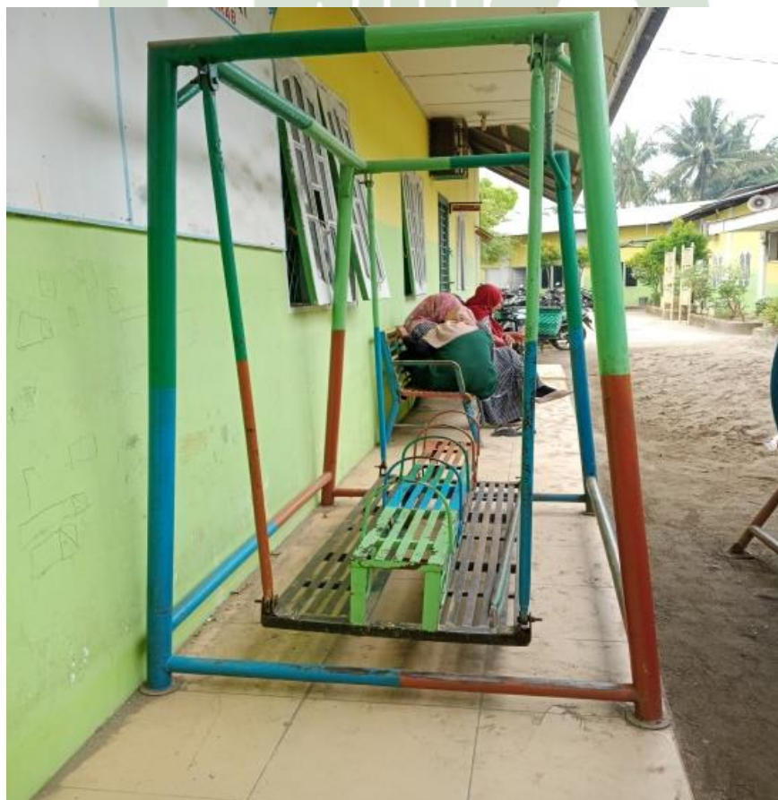
Foto Permainan Out Door di RA Rahmat