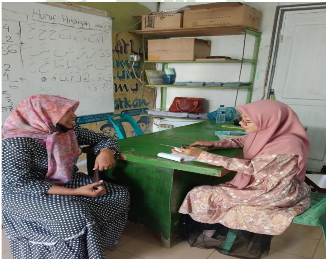
Wawancara dengan Orang Tua Murid di RA Rahmat