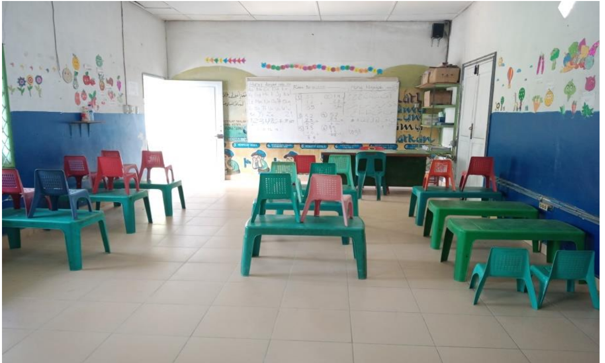
Foto Ruang Kelas RA Rahmat

UNIVERSITAS ISLAM NEGERI SUMATERA UTARA MEDAN