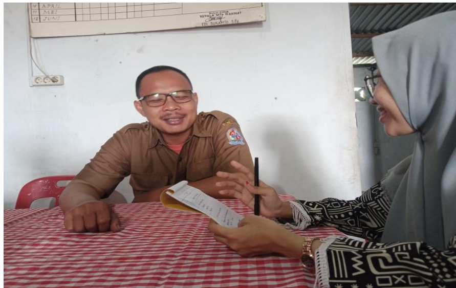
Wawancara dengan Kepala Sekolah RA Rahmat