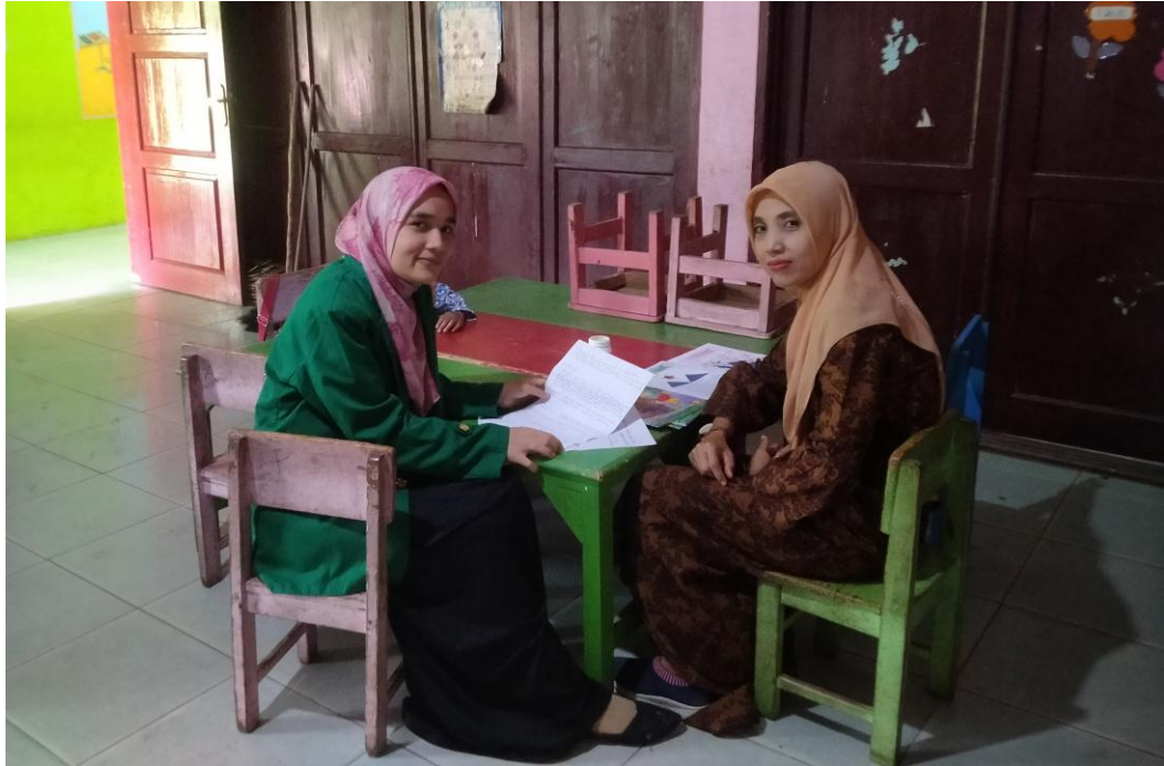
Wawancara dengan guru kelas b

UNIVERSITAS ISLAM NEGERI SUMATERA UTARA MEDAN