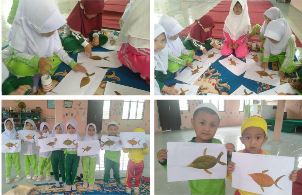
Foto Kegiatan Kolase Daun Nangka Membuat Ikan