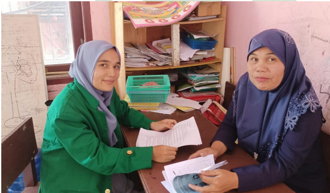
Wawancara dengan guru kelas a