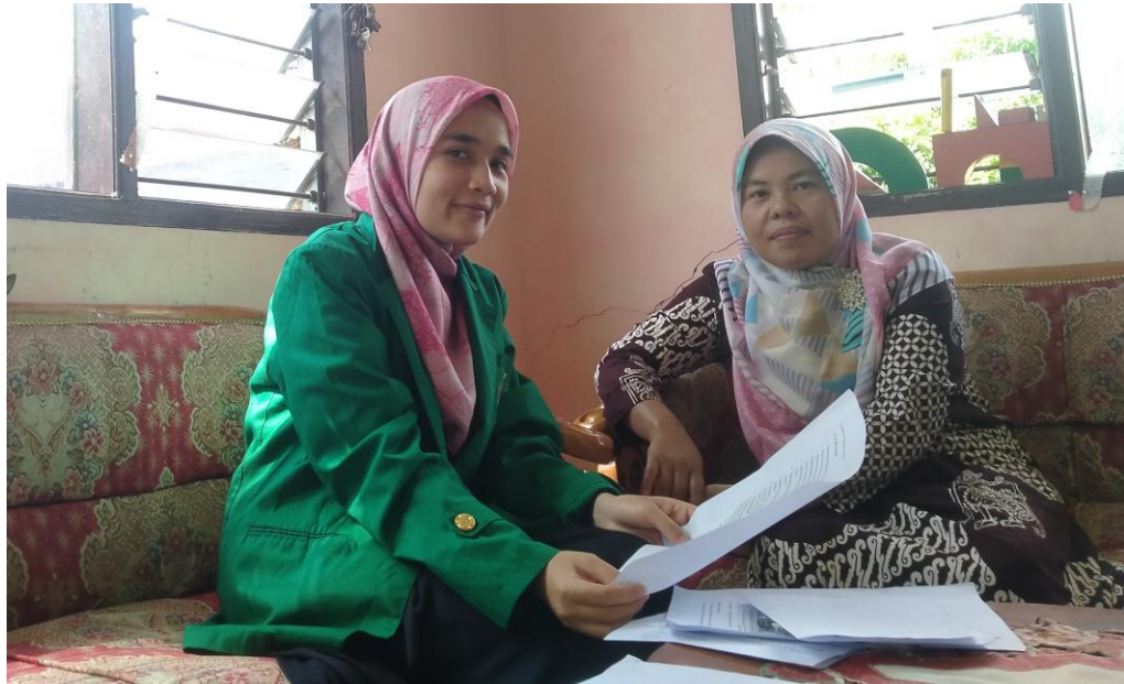
Wawancara dengan kepala sekolah