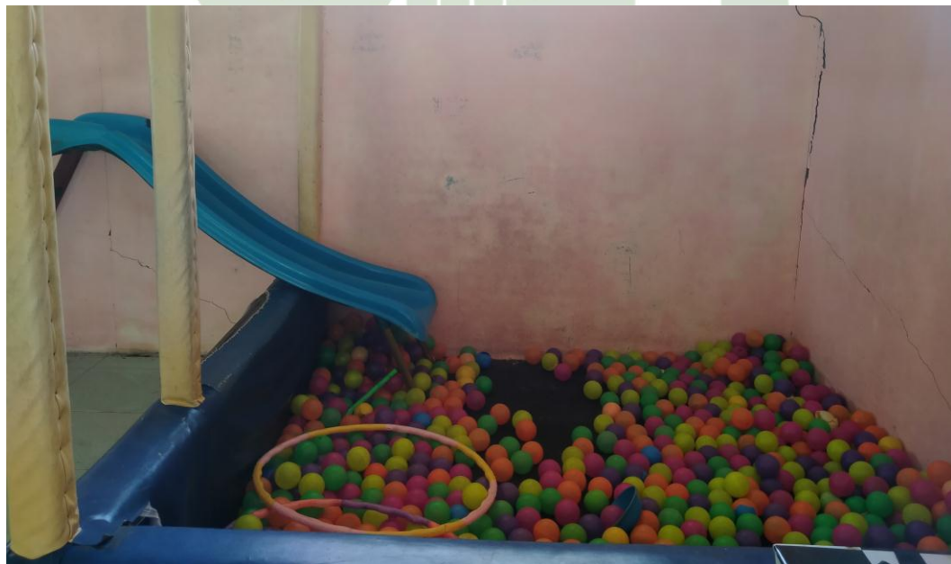
Alat Permainan Indoor RA Al-Khairat Kotanopan