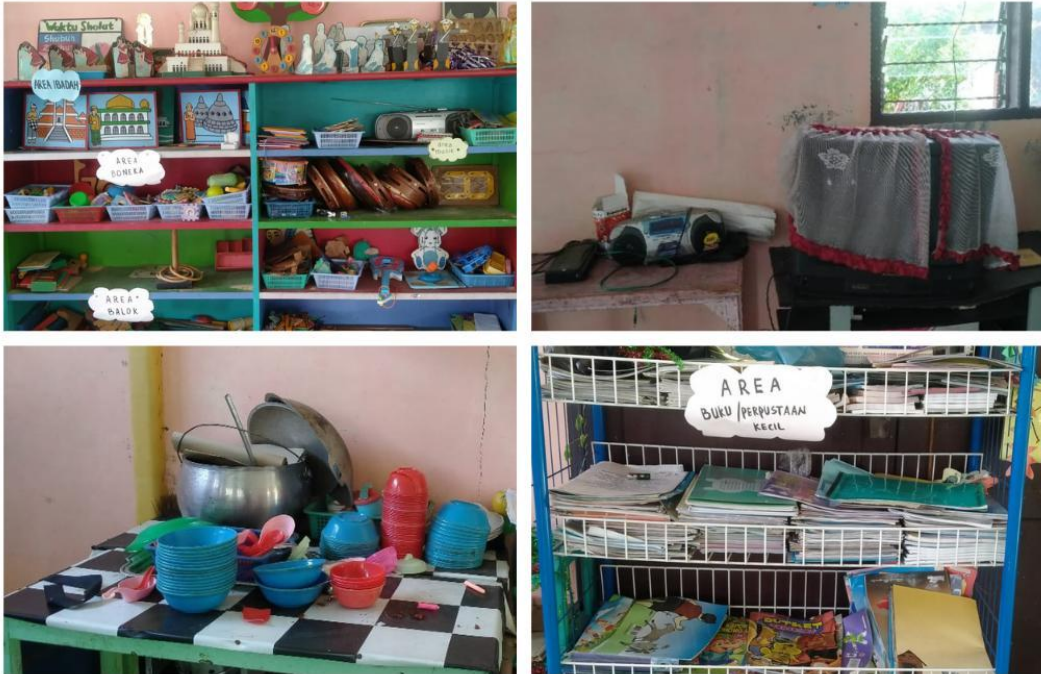
Foto Area Balok, Musik, Ibadah, Dapur, Elektronik, Perpustakaan