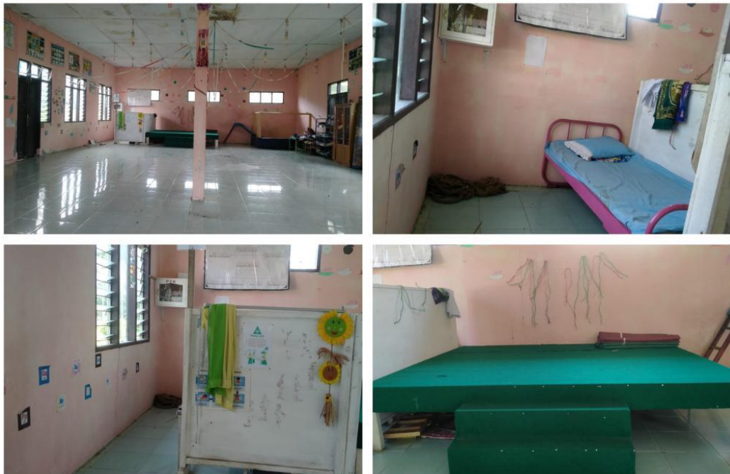
Foto Ruangan Aula, UKS, dan Pentas Seni