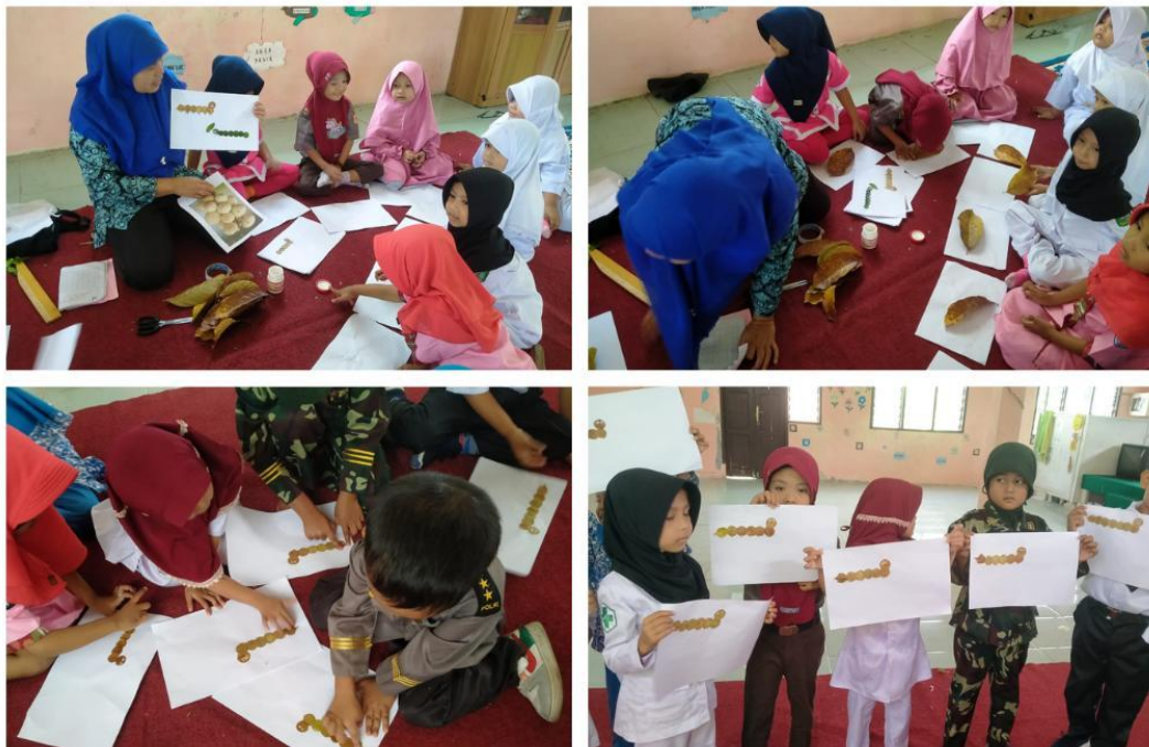
Foto Kegiatan Kolase Daun Buah Langsung Membuat Ulat