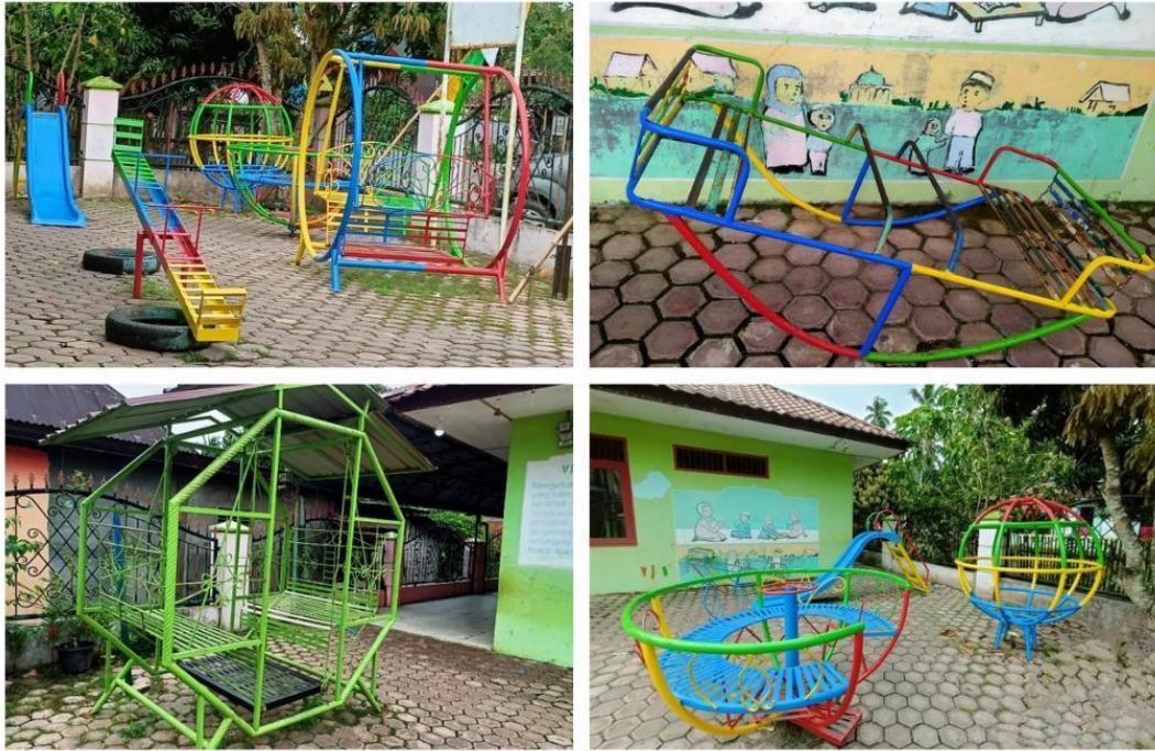
Alat Permainan Outdoor RA Al-Khairat Kotanopan